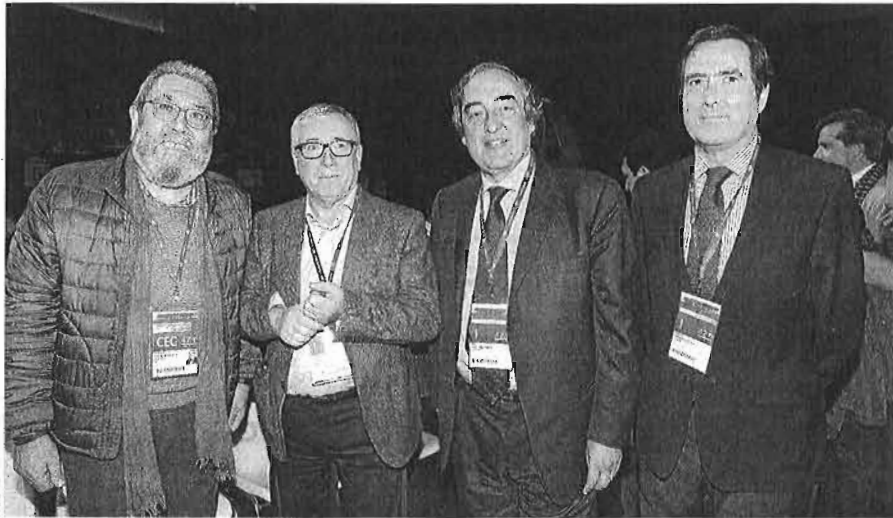
Los secretarios generales de UGT, Cándido Méndez, y de CCOO, Ignacio Fernández Toxo, con los presidentes de CEOE, Juan Rosell, y de Cepyme, Antonio Garamendi, el pasado miércoles, en el cuadragésimo segundo Congreso de UGT, que se celebra en Madrid.