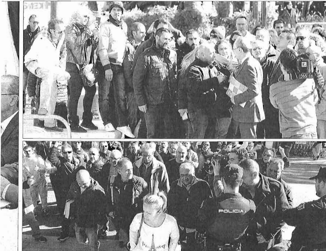
▶ LAS IMÁGENES DEL ENCUENTRO 1 El alcalde, Francisco de la Torre, conversó con los trabajadores de Limasa que esperaban ante el Ayuntamiento. 2 El comité sube las escaleras del Consistorio en el que había un cordón policial.