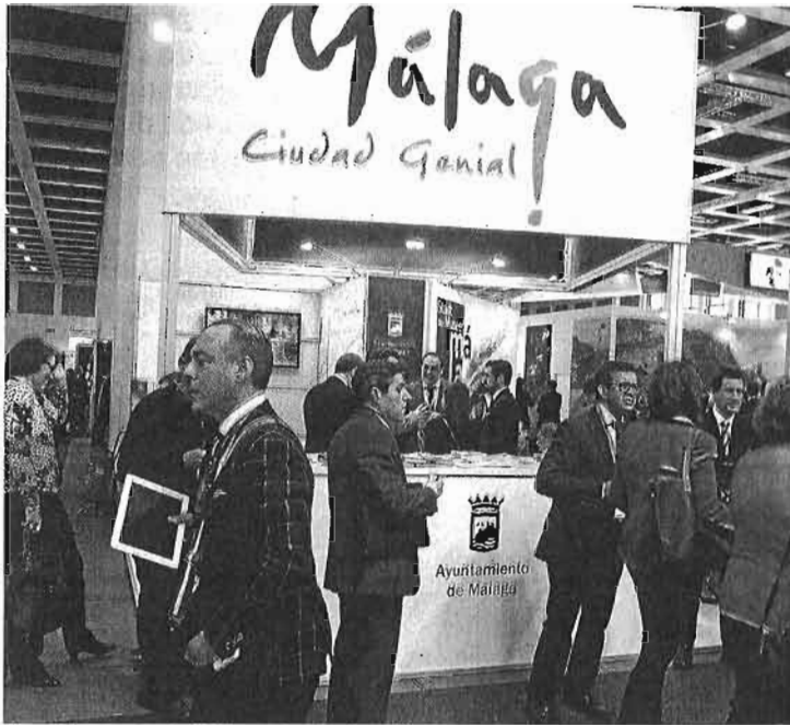
Vista del expositor de Málaga en la ITB de Berlín, que hoy encara su tercer día.