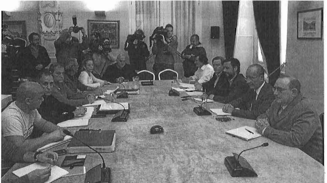
La reunión, que comenzó a primera hora de la tarde, se prolongó hasta la madrugada.

Con este as en la manga, el alcalde no solo rechazó la oferta que el comité presentó la tarde del miércoles, sino que lanzó un nuevo órdago por la mañana con una propuesta más dura que las anteriores en la que, además de reiterar que la plantilla no recuperará el dinero perdido por la huelga con dobles turnos cuando toque recuperar las calles, también ponía sobre la mesa la eliminación de las cláusulas que permiten heredar el puesto, exigía garantías de que no habría amenazas de huelga en dos años y condicionaba la mayor parte de las mejoras a la decisión del juez sobre cómo debe aplicarse el convenio 2010-2012 después de que otro juzgado diera la razón a los trabajadores al declarar que el único marco laboral vigente es el