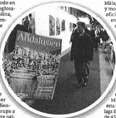
La revista que SUR reparte en la ITB de Berlín también le ha llegado a los suscriptores del diario Ruhr Nachrichten, en Renania-Westfalia.

La feria ITB encara hoy su último día para profesionales, y mañana y pasado abrirá sus puertas al público, lo que provocará una verdadera avalancha de gente, como ya suele ser habitual en este importante evento turístico, pese a los precios de las entradas, que no bajan de los 15 euros.