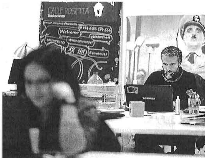
Los espacios de 'coworking' se han multiplicado en los últimos años.