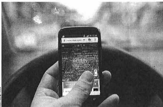
Uber es uno de los negocios que basan su modelo en la economía colaborativa.

Explica que, según la directiva, "lo que da lugar a la aplicación de la exención de responsabilidad es que el prestador de servicios adopte una posición pasiva en relación con los contenidos, y sólo serán responsables en caso de que tomen conocimiento de su ilicitud y no actúen con prontitud para su elimina-