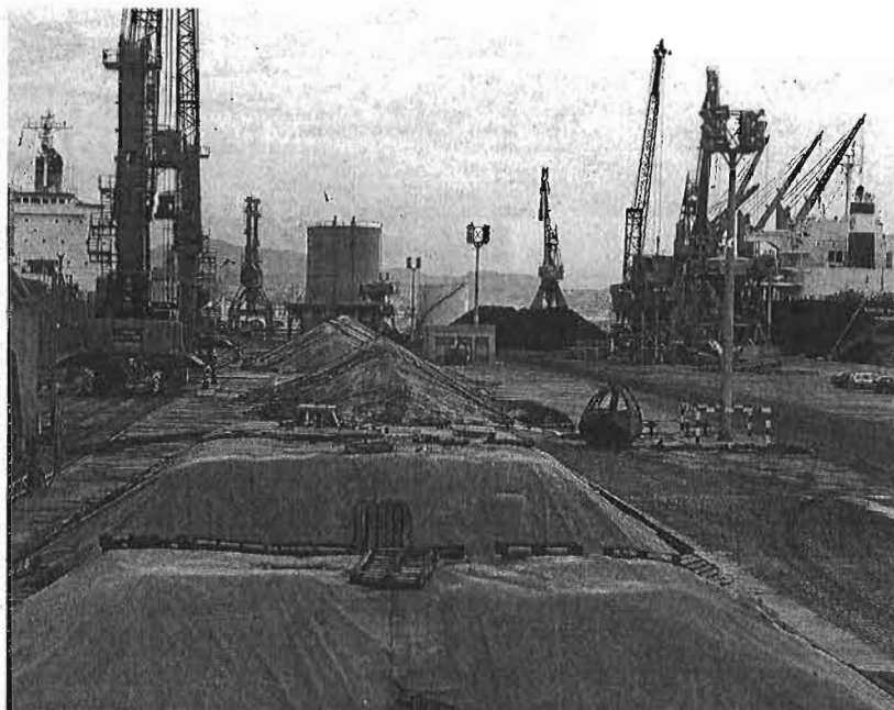
El trasiego de graneles sólidos casi se ha duplicado en el Puerto en los dos primeros meses. ff sur

vehículos de importación se han distribuido desde el muelle 9 en este periodo, un 5% más.