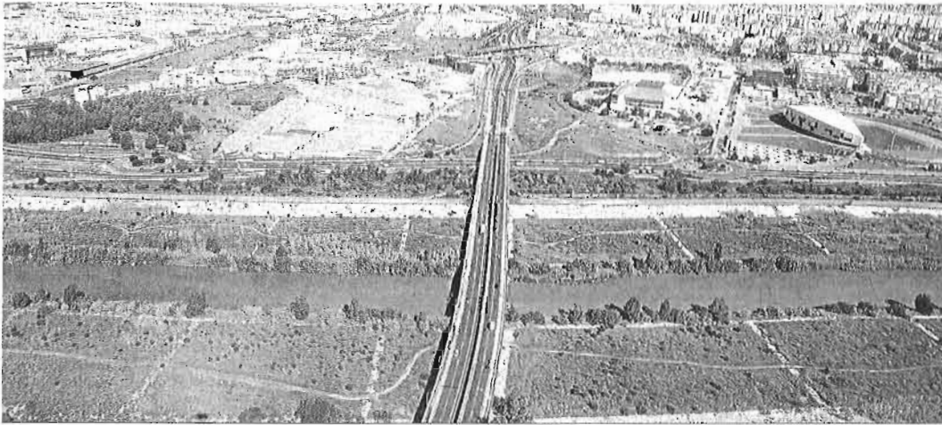
Vista del río Guadalquivir y de los terrenos industriales.

● Apoma teme que los propietarios que quieran desarrollar esas parcelas tengan que asumir el riesgo de construir en las mismas