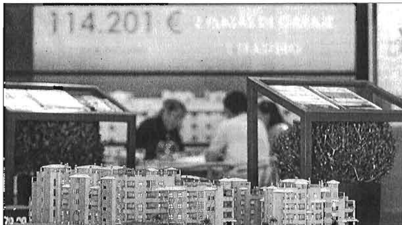
La venta de viviendas vive sus mejores momentos desde el arranque de la crisis. ARCINIEGA

En el resto del litoral malagueño se reparten subidas y bajadas interanuales. Las operaciones subieron en Benalmádena (un 0,6% para un total de 1.878 compraventas), en Vélez Málaga (un 18,2% con 1.076), en Benahavís (un 3,5% con 733), y en Rincón de la Victoria (un 23,4% con 553). Por contra bajaron un 2,8% en Estepona (2.052), un 0,4% en Mijas (2.373),