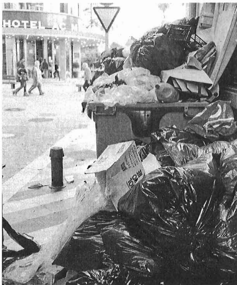
La basura que se acumula en la calle de los hoteles Málaga Palacio y Molina Lario.

Domingo de Ramos los hoteles de la ciudad ya tienen, de media, reservadas el 80% de sus plazas, lo que supone cuatro puntos menos que lo que se esperaba por la velocidad que estaba teniendo este destino en lo que va de año. "Íbamos mejor que el año pasado pero se han podido frenar un 4% las reservas por el impacto de la huelga", explica Moro, quien subraya que "está todo un poco parado a la espera de ver qué ocurre aunque somos optimistas y queda aún una semana para recuperar". En cualquier caso, los hoteleros sí lamentan la imagen que se ha dado de la ciudad durante estos días tanto a escala nacional como interna-