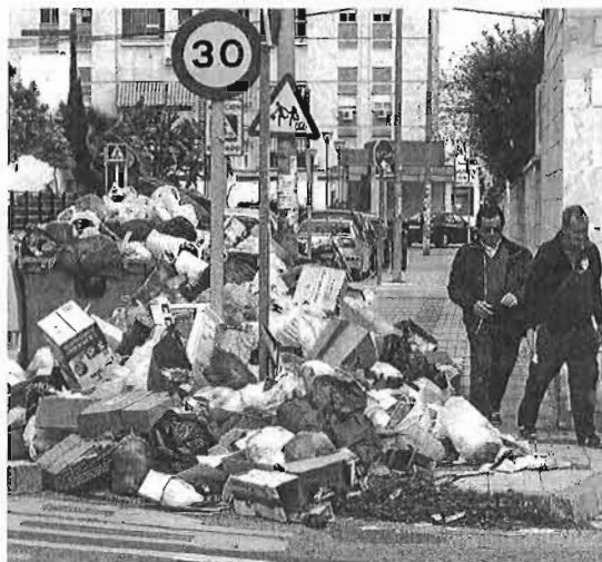
Basura acumulada en el entorno de La Unión...