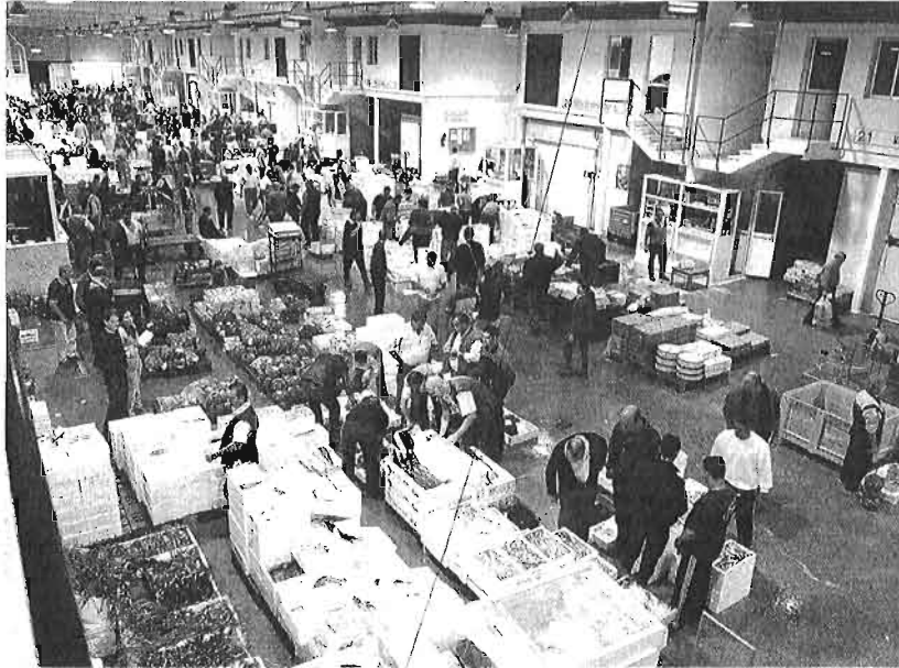
El puerto de Málaga ha visto reducir a la mitad sus capturas desde 2010.