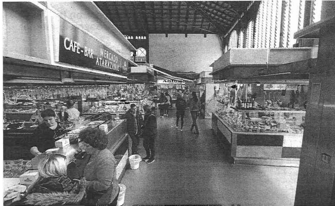
El mercado cuenta actualmente con cuatro bares.

Según ha podido conocer este periódico, tres de ellos se instalarían en el lateral sur del recinto, junto a la entrada de calle Atarazanas; mientras que el cuarto lo haría en la parte opuesta, junto a la calle Sagasta. De autorizarse estos proyectos, el mercado central contaría con ocho negocios de restauración –algunos de ellos ya disponen de varios puestos repartidos por el recinto–.