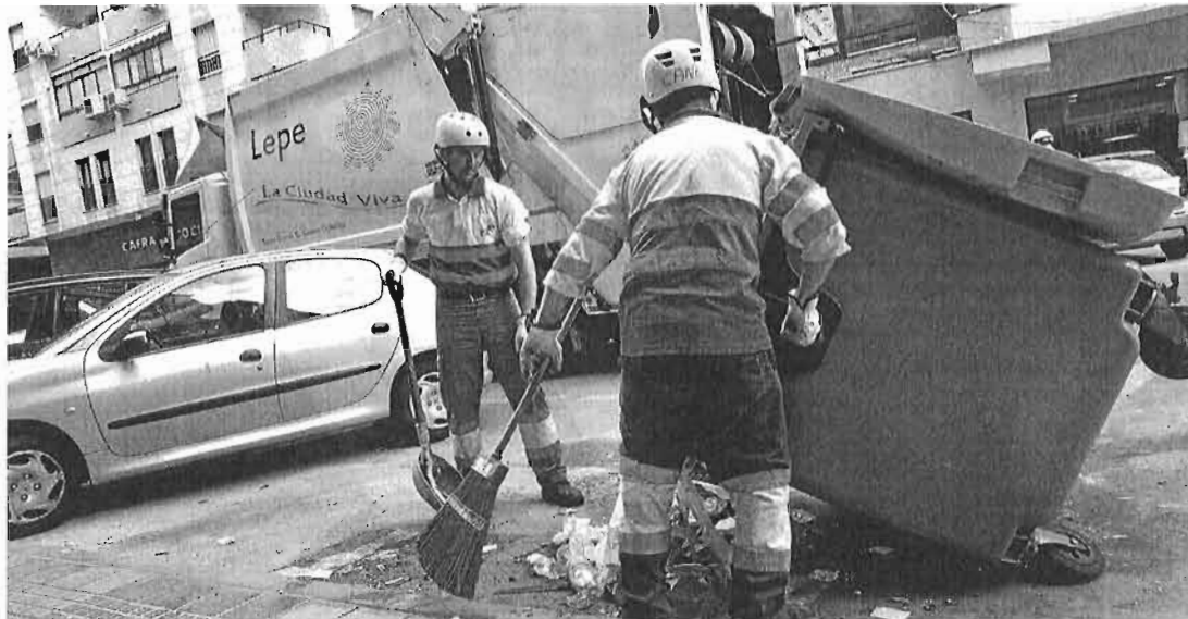
Operarios del servicio de recogida de Lepe (Huelva) se incorporaron ayer al dispositivo para recuperar la ciudad...

Durante la jornada de ayer, el dispositivo de Limasa dedicado exclusivamente a la retirada de la basura estuvo compuesto por 575 operarios (428 era del servicio de limpieza) y 156 vehículos. Un despliegue al que