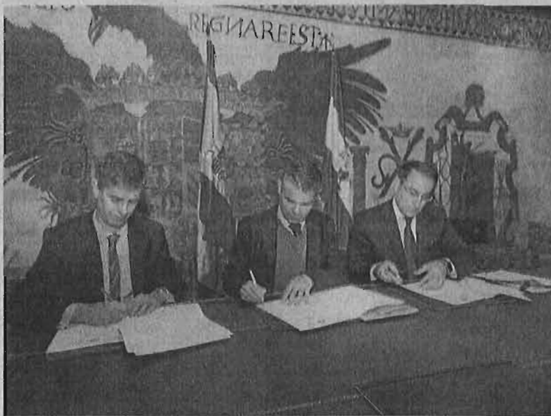
Firma del acuerdo alcanzado ayer por el Ayuntamiento con los empresarios, ayer.

Entre los compromisos previstos en el acuerdo se encuentra la puesta en marcha del Foro de Innovación y Promoción Turística de Marbella, en el que estará representado el sector privado, además de contemplar otras cuestiones como la gestión de los servicios públicos, las grandes infraestructuras y la imagen de la