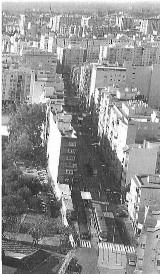
Recreación del tranvía a su paso por Blas de Lezo.

En cuanto a la respuesta ciudadana al proyecto, Fomento esgrimió las reuniones que a lo largo de este mes ha mantenido con una treintena de colectivos, tales como vecinos de otros barrios, empresarios, sindicatos, comerciantes y colectivos ciclistas, entre otros, «que han manifestado un amplio consenso» hacia la solución pactada. Sobre el rechazo de las dos plataformas anti-