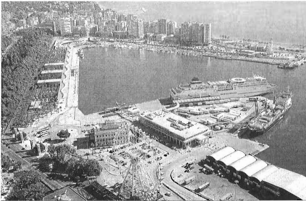
Imagen aérea del puerto de Málaga, con el centro comercial Muelle Uno al fondo.