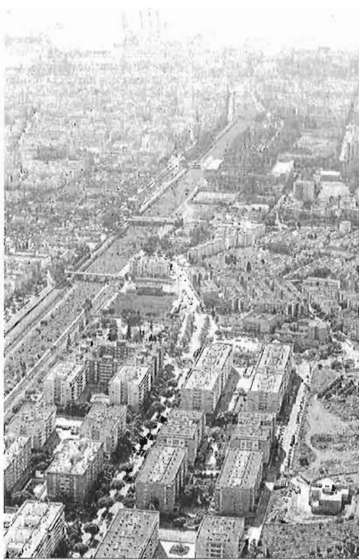
Imagen aérea del Guadalmedina.

"No podemos retrasar más este trabajo hasta que la Junta se aclare", dijo de manera crítica el concejal del PP, que aseguró que el punto de partida es el de realizar los postulados que se con-