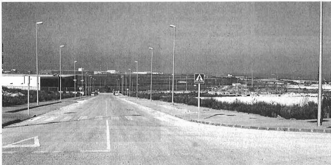
El Tecnoparque de Humilladero lleva desde 2008 sólo con dos empresas implantadas, por lo que más del 80% de los terrenos están libres.

El complejo fue promovido por el Ayuntamiento de Vélez y la Junta de Andalucía con el objetivo de impulsar el desarrollo tecnológico, la innovación y la investigación en la industria agroalimentaria con el fin de dar valor añadido al 'agro'. Sin embargo, acuciada por las deudas, la empresa que gestiona la tecnópolis, integrada por la empresa municipal de la Vivienda (Ermvipsa) y la Agencia de Gestión Agraria y Pesquera (AGAPA), que tiene que hacer frente al pago de un préstamo de 9,5 millones de euros solicitado para ejecutar las obras de urbanización, se ha visto obligada a vender ya una de las parcelas a una industria que no tiene nada que ver ni aporta al sector agroalimentario para poder abonar las facturas. «No hemos tenido otro remedio. Con los 230.262 euros de los 1.257 metros cuadrados del suelo en el que se ubicará esta em-