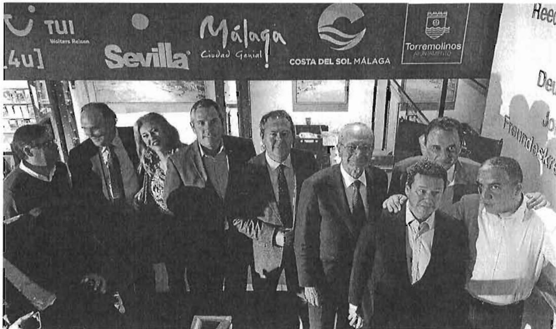
Autoridades y empresarios andaluces, en la cena de bienvenida al congreso en el Museo Marítimo de Hamburgo.