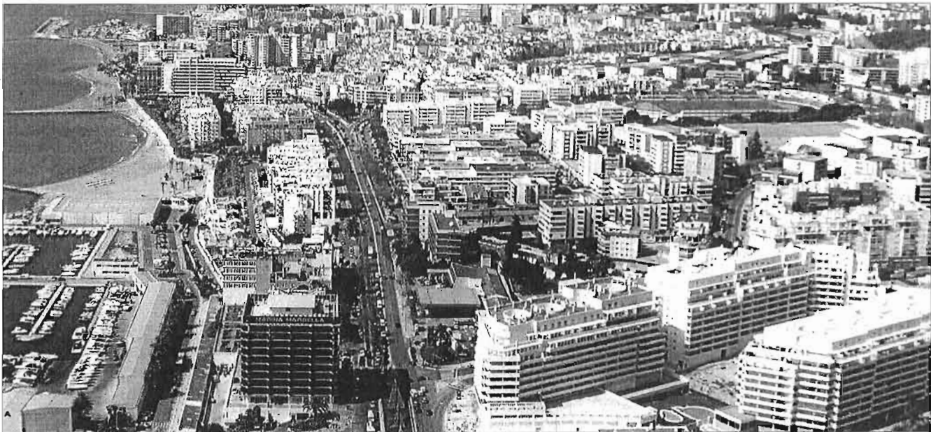
La localidad se prepara para un nuevo período de crecimiento. LA OPINIÓN