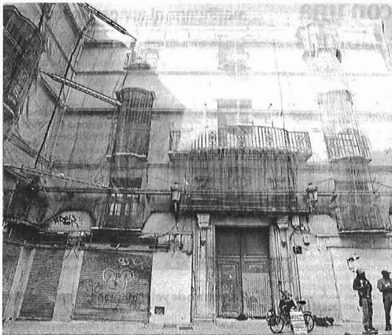
El Palacio del Marqués de la Sonora, comprado por un grupo inversor alemán para un hotel.

A esa decisión de poner los ojos en la capital ayuda también la falta de oferta hotelera. De la Maza apunta un dato esclarecedor. "Seguimos siendo una plaza hotelera pequeña, con unas 10.000 camas; Granada tiene 14.000, y Valencia y Sevilla andan por 20.000", expone. Una situación que, augura, se mantendrá a pesar de los últimos proyectos en ponerse sobre el escenario, caso del Miramar, el hotel de Moneo... "Hemos trabajado para diferen-