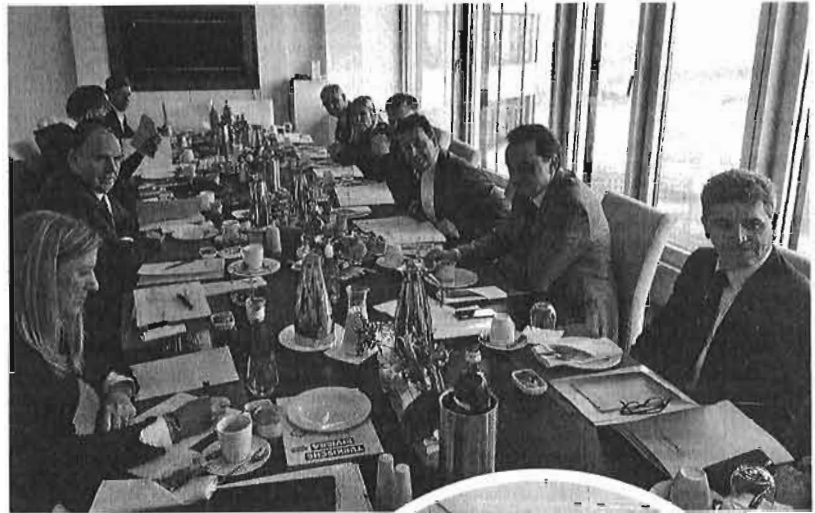
Vista del desayuno de trabajo con el que arrancó ayer el programa de actos del congreso de TSS Group.