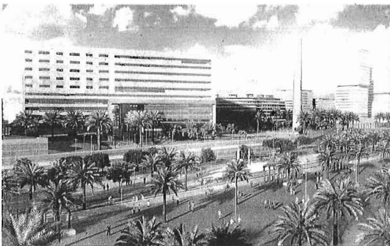
Infografía del proyecto contemplado en los suelos de La Térmica.