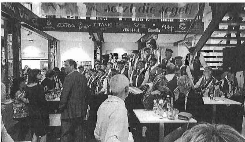
Un grupo de folclore recibió a los agentes de viajes con cantos tradicionales.