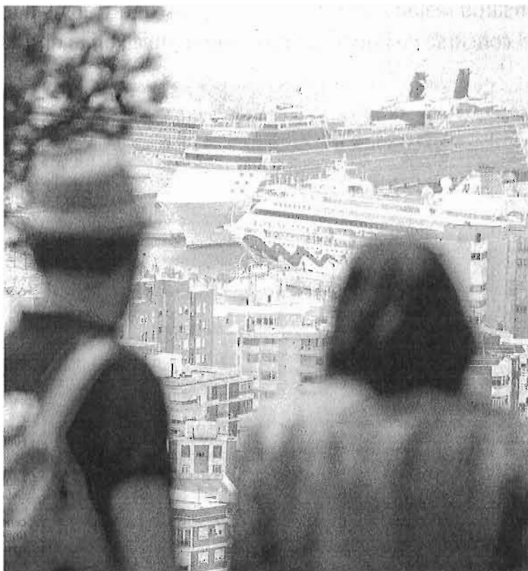
Dos turistas observan desde Gibralfaro los cruceros atracados ayer.

De cara al verano, Escrivano se mostró optimista porque "se está trabajando bien con las reservas anticipadas pues veníamos de una época en la que la última hora se había puesto de moda". Los