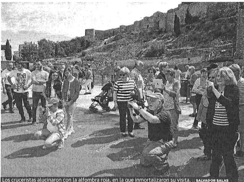
Los cruceristas alucinaron con la alfombra roja, en la que inmortalizaron su visita.