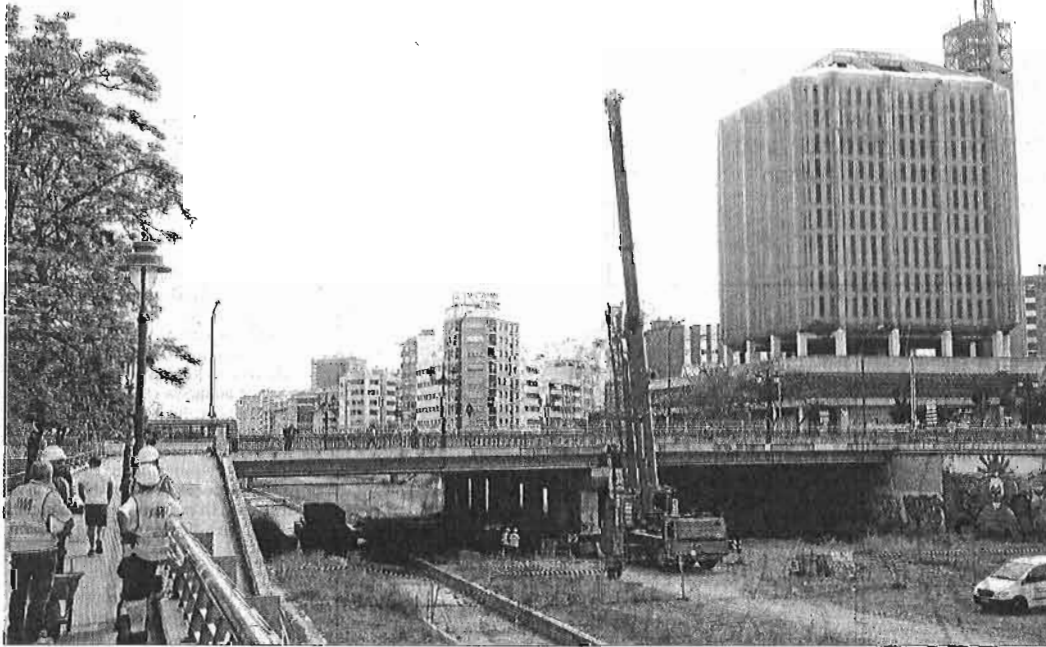
Trabajos previos a la demolición del tablero norte del puente de Tetuán.

● La firma australiana Macquaire compra a FCC su 10% en la sociedad Metro Málaga y, acto seguido, impulsa la venta de un 24% de sus acciones a al segundo banco de Francia, Natixis