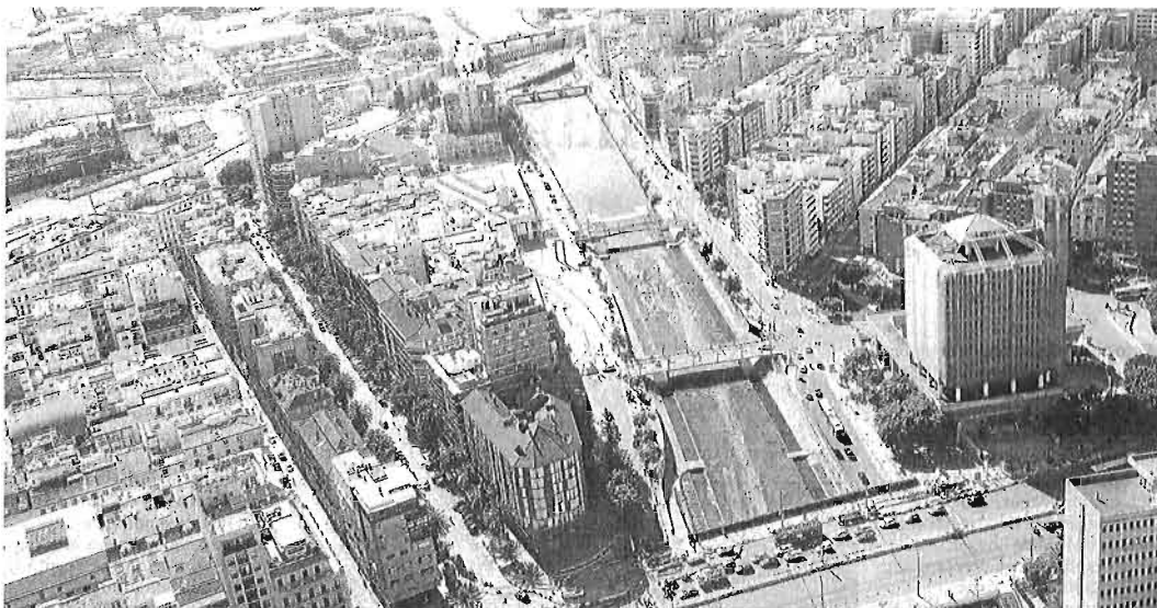
Vista área del río Guadalmedina.