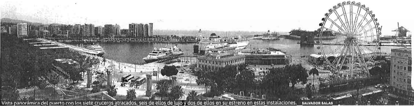
Vista panorámica del puerto con los siete cruceros atracados, seis de ellos de lujo y dos de ellos en su estreno en estas instalaciones.