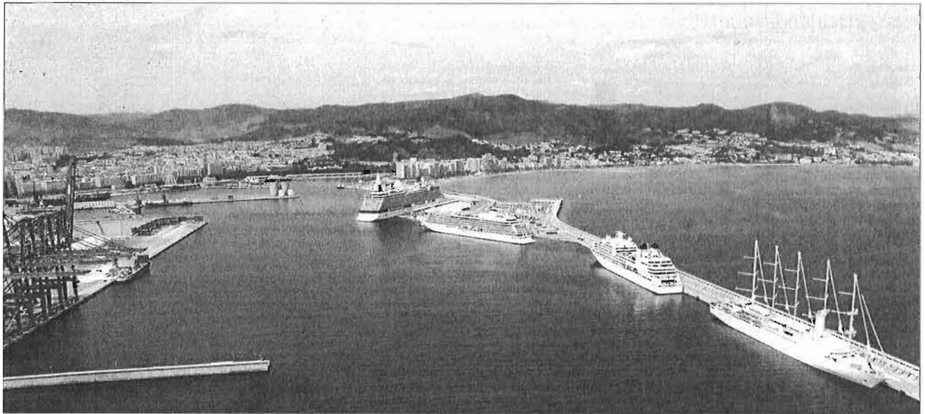
Vista aérea de cinco de los siete cruceros que atracaron ayer en el puerto de Málaga.

► La llegada del Celebrity Equinox a las 7.00 horas de la mañana de ayer marcó el inicio de una jornada que contó con 7 cruceros coincidiendo en el puerto, lo que obligó a ocupar dos atraques en el Dique de Levante - Wind Surf y Seabourn Quest -, además del atraque sur, el atraque Norte y dos en el muelle 2. Unos 6.000 cruceristas desembarcaron en Málaga, con algunas excursiones a Antequera, Granada, Mijas y Marbella. La afluencia de turistas a los principales monumentos del Centro fue notable, como los grupos de Aidacara y Viking Sea de las fotografías.