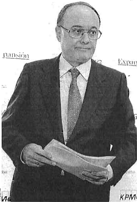
El gobernador del Banco de España, Luis María Linde.

Es verdad que continua el crecimiento del consumo de los hogares. Sin embargo, el Banco de España ha detectado la desaceleración de la actividad en algunos sectores. Por ejemplo, en la construcción, tanto en la producción de materiales como en la afiliación de la Seguridad Social. Si bien