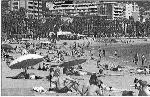
Bañistas en la playa de La Malagueta. ALEX ZEA

La confluencia del Festival de Cine, junto al buen encaje del calendario y la tendencia mostrada por el destino en los últimos meses, hacen que, en las horas previas, proliferen el optimismo, con una perspectiva de ocupación hotelera cifrada de antemano por la patronal en un 83 por ciento. La pro-