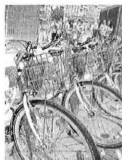
Estación de bicis.