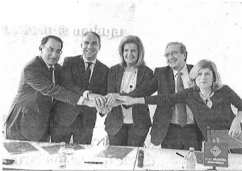
Un momento de la presentación del plan Primera Oportunidad, ayer en la Diputación.

La Diputación pondrá un millón de euros y los empresarios en torno a medio millón. Se desconoce aún a cuántos universitarios se podrá contratar porque dependerá de la demanda existente, del sector o del salario que vayan a percibir