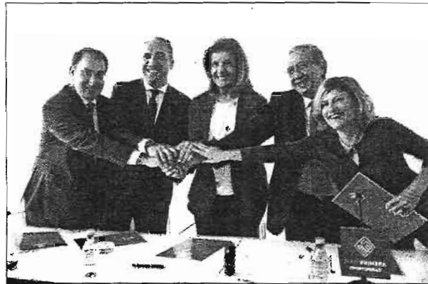
La ministra Fátima Báñez, durante su visita a Málaga. ANTONIO PASTOR

El objetivo, según Báñez, es favorecer la inserción laboral de los jóvenes, un sector de edad que actualmente presenta una tasa de paro del 46% en la provincia, una de las tasas más altas del país. «Málaga, a través de ese contrato en prácticas, se suma a esta estrategia de emprendimiento y empleo joven. Este plan es, de verdad, una pasarela directa al empleo para los jóvenes universitarios de Málaga», señaló la ministra quien destacó que «el compromiso