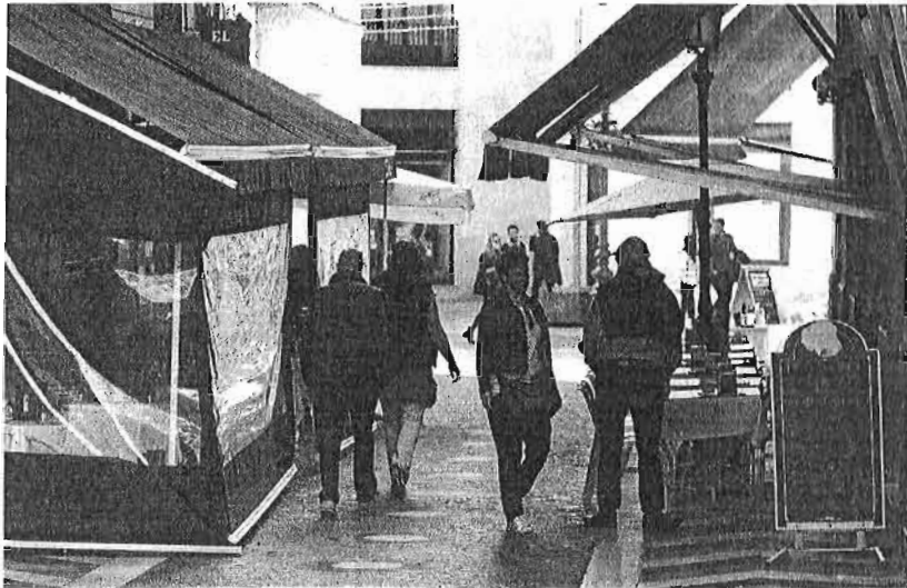
Los empresarios piden que se sancione a quienes no tienen permiso de terraza.