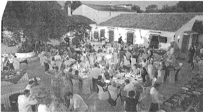
La firma se caracteriza por ofrecer servicios a medida a grandes multinacionales. :: SUR