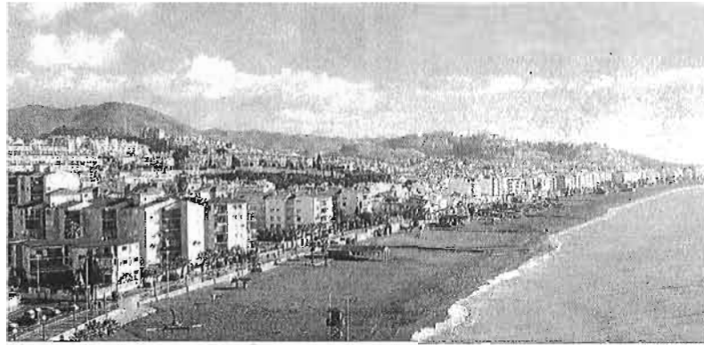
Vista panorámica de Rincón.

● Alianza de fuerzas en busca de un modelo que conjugue la calidad y sostenibilidad ambiental sin perder competitividad en el mercado