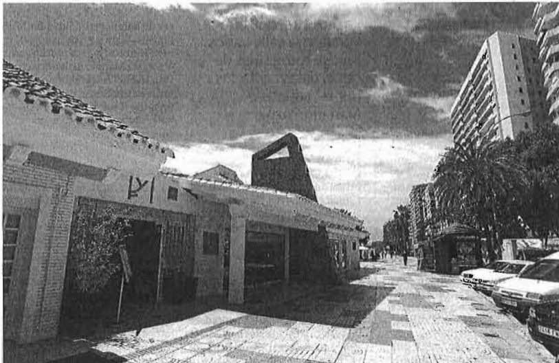
El grupo Gorki explota las instalaciones desde hace un año.