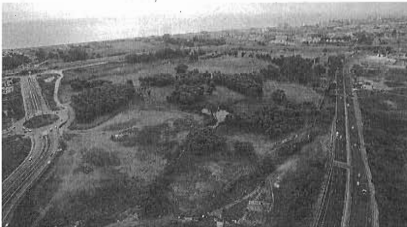
El plan urbanístico para la obra del parque en el Benítez acumula ya dos años de trámites.

MÁLAGA. El proyecto para convertir en parque los suelos del antiguo campamento Benítez sigue aún lastreado por los trámites urbanísticos previos, pese a que el equipo de gobierno municipal desea iniciar las obras cuanto antes. En agosto del año pasado, el Ayuntamiento puso en marcha la contratación de los nuevos accesos a este ámbito. Todo parecía indicar que estos trabajos, financiados con un millón de euros que aportó la Diputación Provincial, podrían ejecutarse al margen de que aún no esté aprobado el plan especial para la zona, ya que los futuros viales discurrirán por sus bordes. Sin embargo, la Gerencia Municipal de Urbanismo ha optado por paralizar este proceso de contratación hasta que se resuelvan totalmente los re-