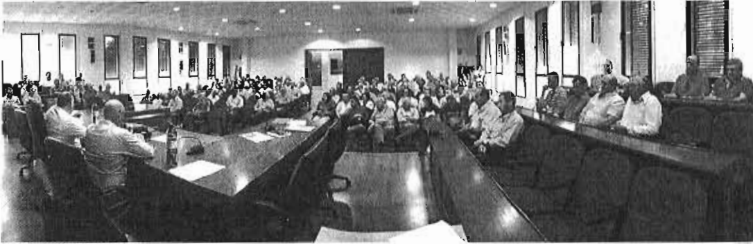
Más de 60 comunidades de regantes de la comarca y las organizaciones agrarias y de productores se unen para pedir agua. 1: SUR