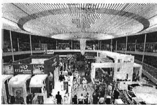
Una edición de Euroal en Torremolinos.

Mena explicó que Euroal, desde sus inicios, "se ha proyectado siempre como una plataforma de promoción para dar a conocer todos los atractivos que ofrece tan-