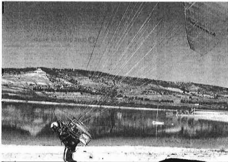
Un turista en una práctica deportiva en Andalucía.

Según este anuario, en 2014 los residentes en España realizaron 2.545.800 viajes principalmente por motivos vinculados al deporte y llevaron a cabo un gasto de 474,9 millones de euros. En el 15,4% de los viajes de residentes en España se realizó algún tipo de actividad deportiva, cifra que asciende al 17,4% en el caso de entradas de