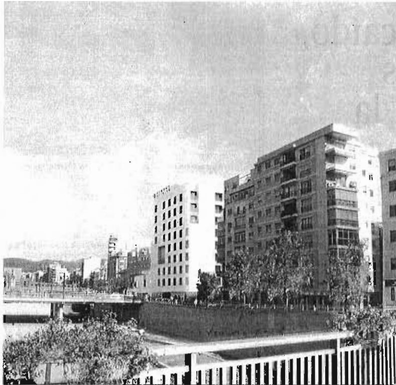
Vista del proyecto del hotel de Moneo desde el puente de Tetuán.

rectamente relacionada con la advertencia lanzada el pasado miércoles por De la Torre a los ediles de la oposición, que ya han anunciado su idea de tumbar la propuesta. Ante esta posibilidad, el regidor recordó que la ley marca la posibilidad de hacer recaer sobre los concejales los efectos patrimoniales que pudieran producirse en el supuesto de que la empresa afectada llegase a exigir responsabilidades patrimoniales al Ayuntamiento.