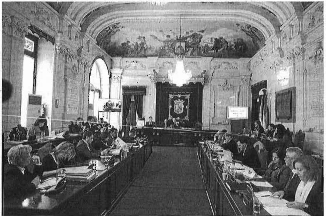
Un pleno del Ayuntamiento de Málaga.

La quinta parte de los municipios no deben ni un euro a las entidades financieras