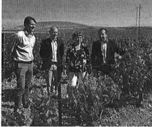
Responsables autonómicos visitaron las viñas de Mollina.