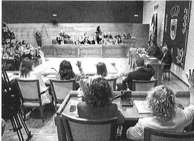
Un momento del pleno celebrado ayer.

Por otro lado, el pleno dio ayer el primer paso para la creación de huertos urbanos municipales a raíz de la aprobación del reglamento para la gestión de estos espacios. La iniciativa aglutina espacios de ocio, esparcimiento y de encuentro para mayores, asociaciones, colectivos, escolares, desempleados y personas con necesidades terapéuticas, entre otros. En palabras de la concejala delegada de Parques y