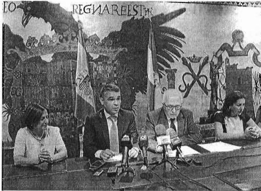
El alcalde de Marbella, durante su intervención.