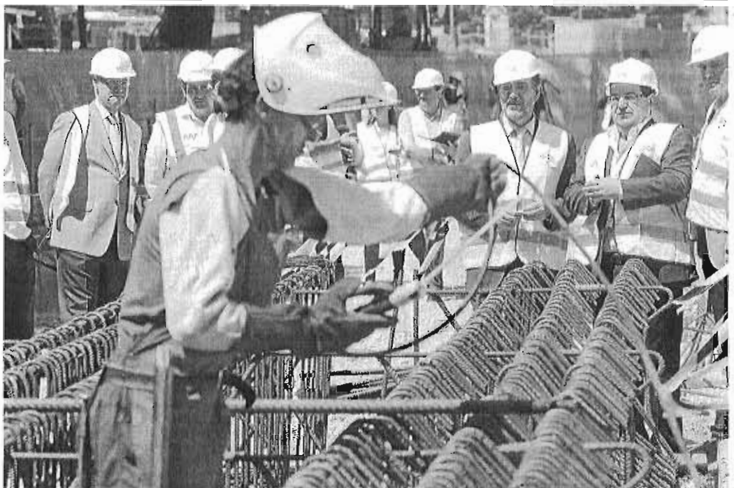
El consejero, ayer, durante su visita a los trabajos.

Bien es cierto, que la incidencia sobre las arcas municipales se mantendrá en 17,5 millones de euros en el supuesto de que el Metro se alcance la zona norte. El parámetro económico se corresponde con el 25% de la factura de explotación global, que se estima en una media de 70 millones de euros anuales. El 75% restante, también según el convenio, corresponde a la Junta.