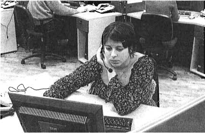
Los cursos están relacionados con los sectores de ventas, cocina, restauración y administración y gestión. :: sur