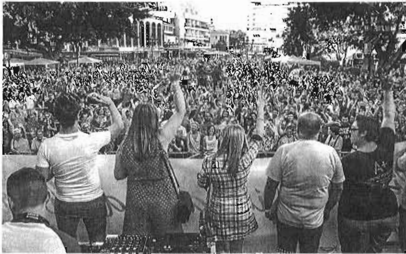
La manifestación y el desfile de carrozas congregaron a cerca de 8.000 personas en Torremolinos.