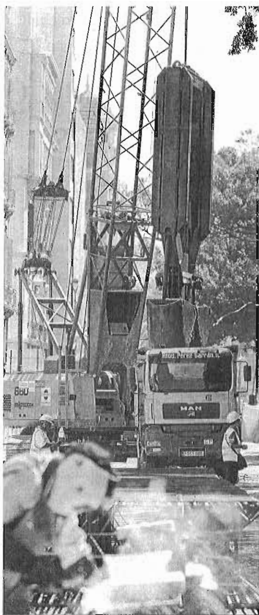
Trabajos, ayer, en la Alameda.

López dijo no tener inconveniente en hablar con De la Torre de la adenda al convenio de 2003, aunque incidió en que antes debe "aceptar el trazado" al que él mismo dio su aval en noviembre de 2013, con la firma del protocolo de intenciones que fijaba la llegada del trazado en superficie hasta el Civil.