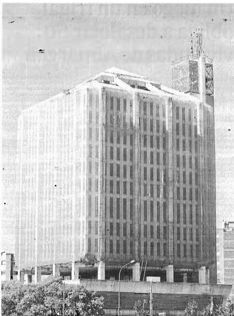
Edificio de Correos, en Málaga capital.

El escenario actual no ha impedido, sin embargo, como viene re-