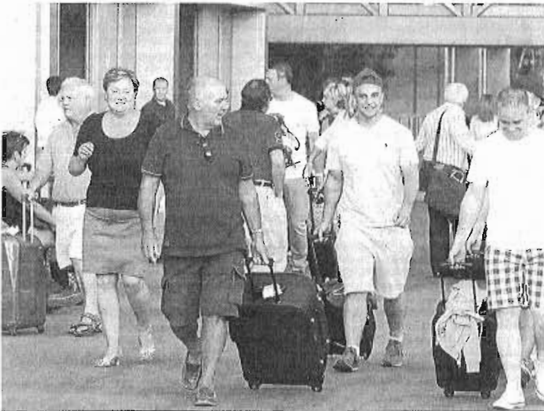
Varios turistas en el aeropuerto de Málaga.