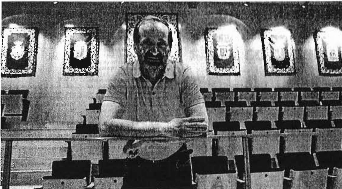
Schar, ayer, en el salón de plenos de la Institución provincial.