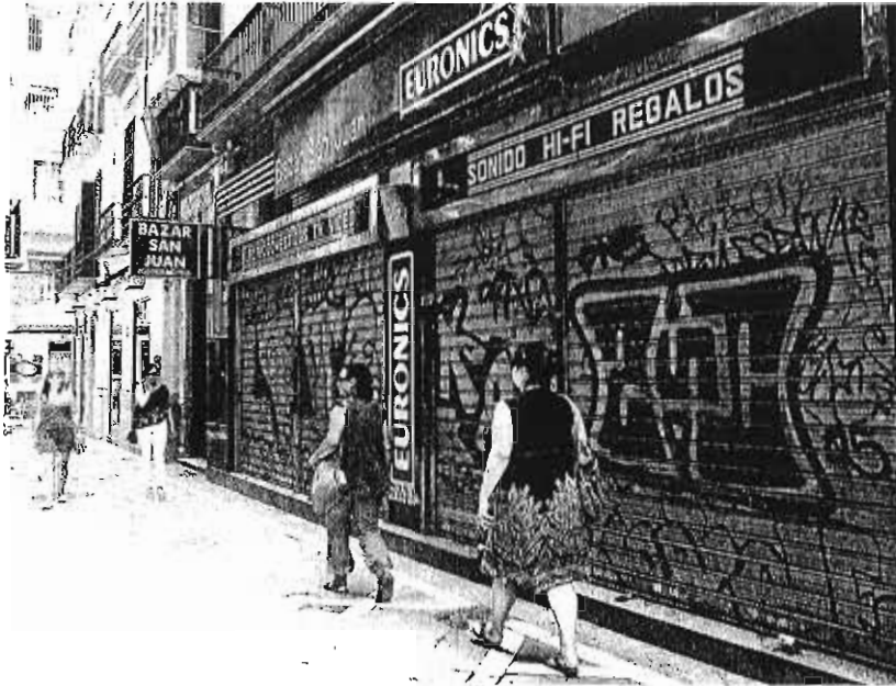
Imagen de una de las tiendas cerradas, en la céntrica calle Santos.