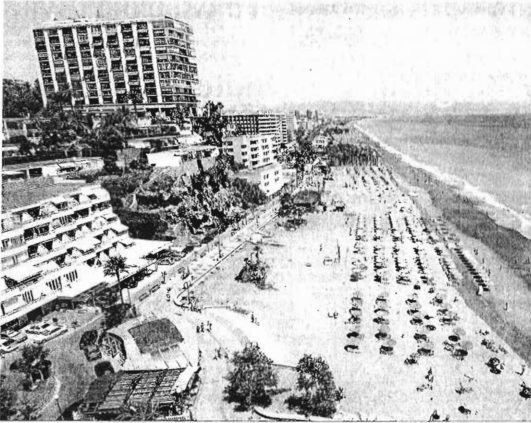
Imagen aérea del litoral de Torremolinos.