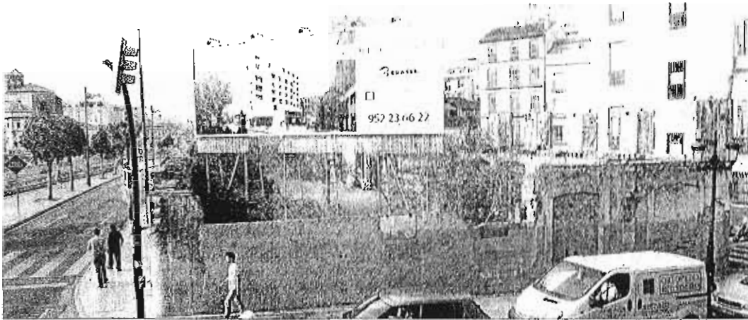
Imagen de archivo de parte de los suelos de Hoyo de Esparteros, donde se proyecta el hotel de Moneo.