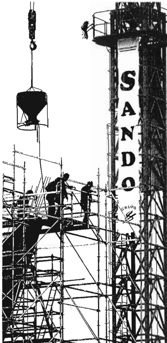
La empresa ha reducido su pasivo en casi mil millones en seis años.

La refinanciación, que es la tercera conseguida por Sando desde que empezó su particular 'via crucis' financiero en 2009, no sólo consiste en alargar el plazo de vencimiento de la deuda. También contempla una modificación de la naturaleza del pasivo: la mayor parte pasa de ser privilegiado a subordinado. Esto quiere decir que si la compañía no consiguiera cumplir en 2020 con los pagos estipulados, los bancos podrían convertir la deuda en acciones, aunque en ningún caso superarían el 40% del capital de Sando, que actualmente está 100% en manos de la familia Sánchez-Manzano. Esto supone además que todos los acreedores pasen a tener el mismo nivel y por tanto cobrarían a la vez. En caso de un hipotético concurso de acreedores, la deuda subordinada se sitúa detrás de la privilegiada y la ordinaria en orden de pago.