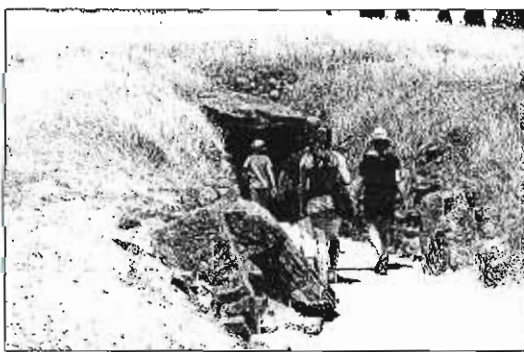
Visitantes acceden al tholos de El Romeral.

hacia La Peña de los Enamorados y el segundo hacia El Torcal. A este aspecto excepcional se une la magnitud y las técnicas de construcción empleadas en los megalitos.