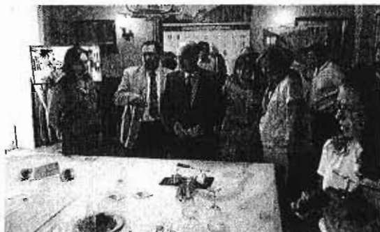
La presentación se celebró en el restaurante El Chinitas. :: SUR

Según detallaron durante la presentación, los empresarios implicados en este proyecto aspiran a dinamizar el entorno, promover acciones conjuntas, construir una marca común y trabajar en beneficio de los turistas nacionales e internacio-