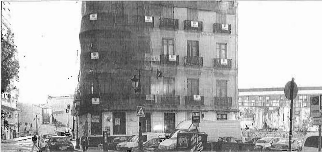
El edificio de La Mundial volvió a ser ayer protagonista de la polémica entre el PP y la oposición. G. TORRES