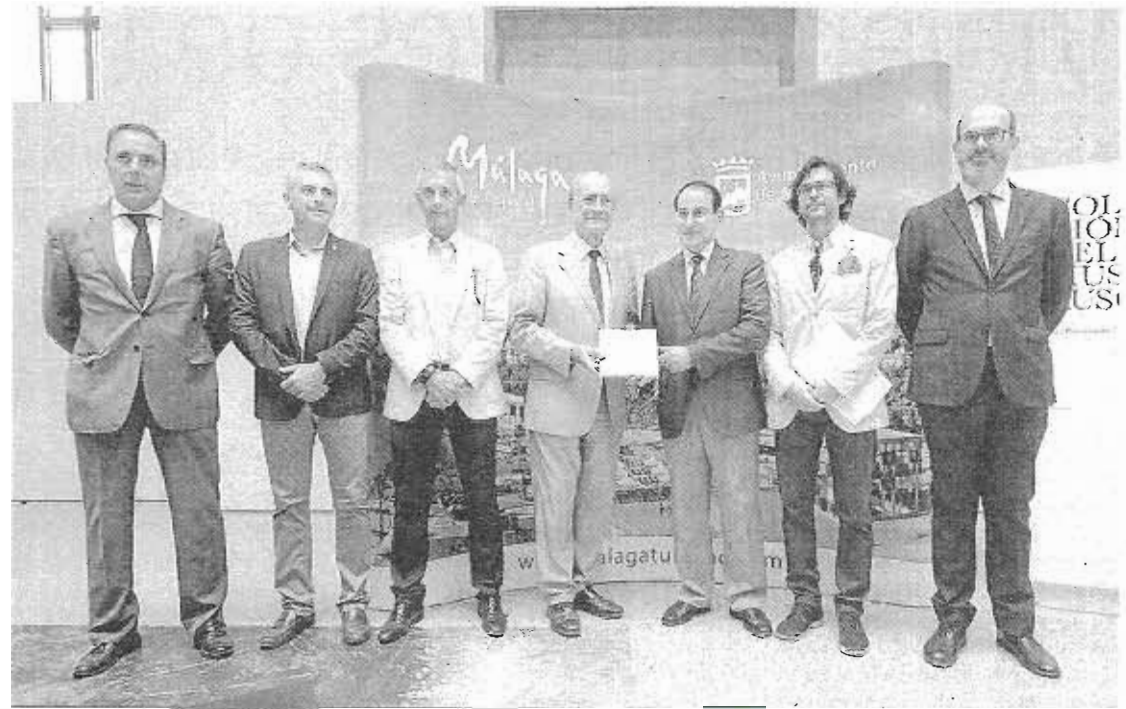
Foto de familia en la Colección del Museo Ruso durante la presentación. M H

Este libro, editado por Tuimagina con la colaboración del Área de Turismo del Ayuntamiento, fue presentado ayer en la Colección del Museo Ruso. No es una guía turística al uso, sino un original álbum de fotos de recuerdo de la visita a la capital de la Costa del Sol, así como una divulgación de la oferta turística. Será entregado desde hoy en las habitaciones de hoteles de tres, cuatro y cinco estrellas. 210 páginas en total, de las que 195 corresponden a fotografías. Además, trae un mapa en 3D realiza-