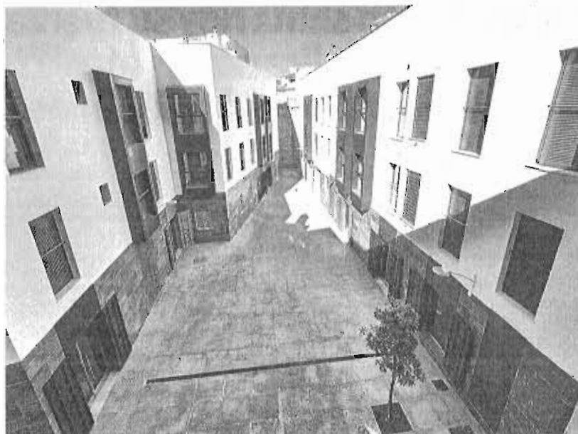
Aspecto de la nueva plaza en la que se abrirán locales de negocios artesanales.

Promálaga ha puesto en marcha estos días la primera de las iniciativas para dinamizar y dar a conocer este nuevo enclave del Centro Histórico que muchos malagueños todavía desconocen porque no se trata de un lugar de paso, sino que está enmarcado por las