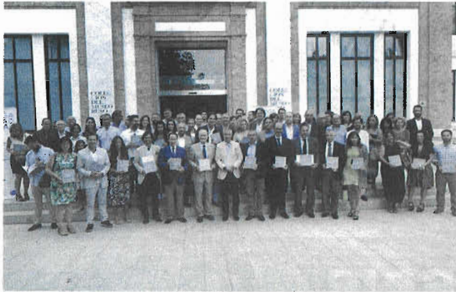
Presentación del libro a representantes del sector turístico. VIVA MÁLAGA

El alcalde aseguró que este libro "ocupa un hueco" que existía y "jugará un papel de difusión" de la capital, ya que cumple con el "reto difícil" de