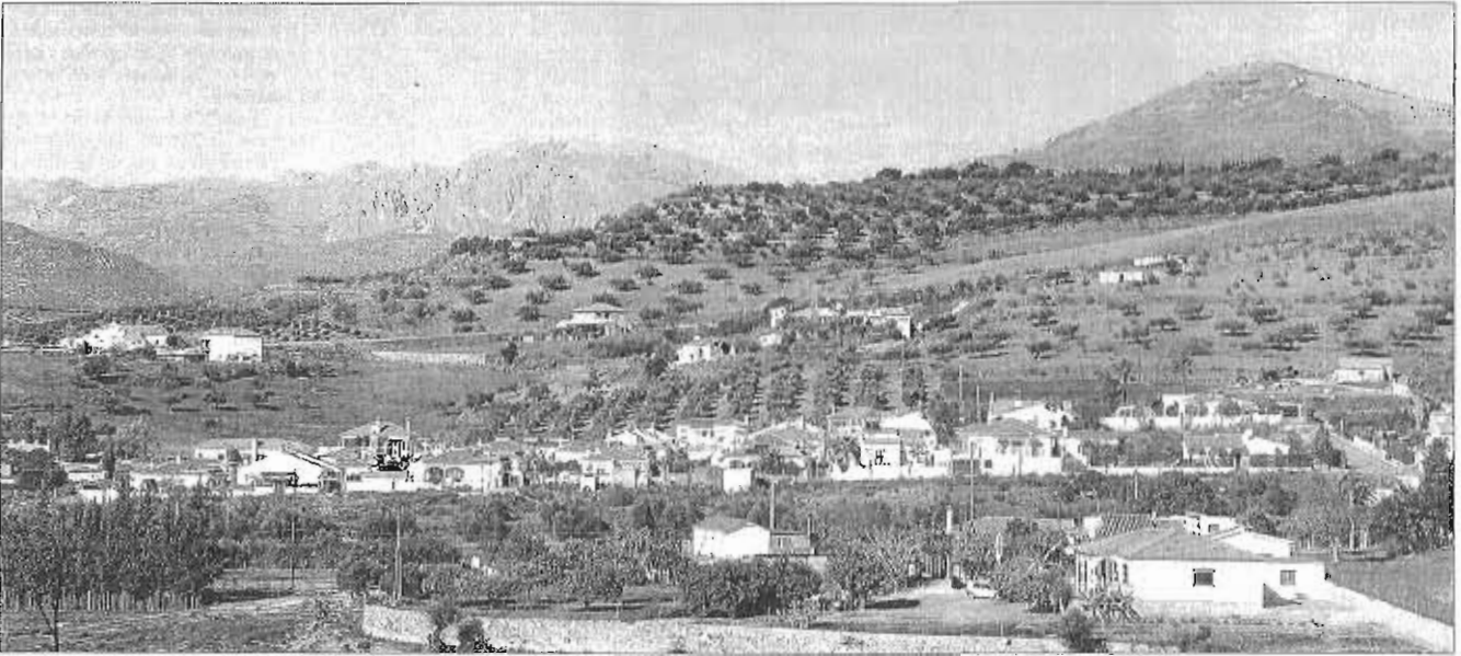
Vista panorámica del entorno de la localidad axárquica de Alcaucín, donde más de 300 propietarios podrán beneficiarse de esta nueva normativa. R.E.