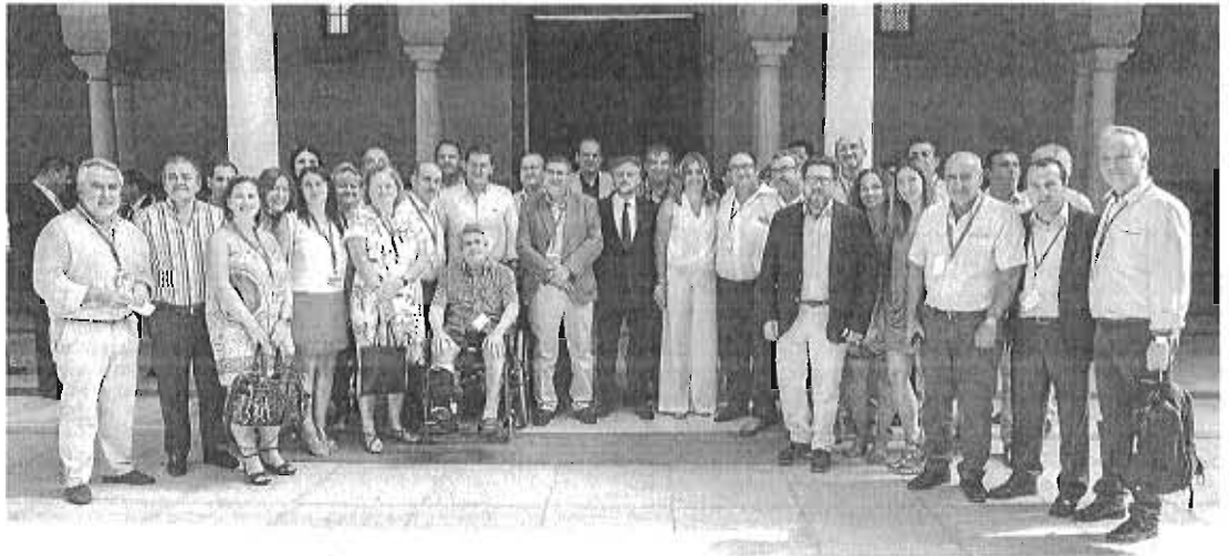
Alcaldes de la Axarquía, propietarios de casas y delegados de la Junta en Málaga junto a Susana Díaz, tras el pleno del Parlamento andaluz.

La Consejería de Ordenación del Territorio estima que la medida puede beneficiar a unas 30.000 viviendas en toda la comunidad de las 300.000 edificaciones irregulares que existen en suelo no urbanizable. Para colectivos de afectados como la Asoc-