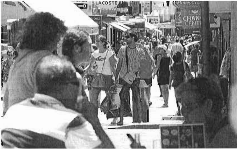
Las llamadas 'licencias exprés' han facilitado además la cuestión administrativa.

Destacan, por tanto, las zonas de la plaza Costa del Sol, avenida Palma de Mallorca, calle Hoyo y calle Cruz, con 23 nuevos licencias concedidas con respecto al periodo anterior de diciembre de 2014 a junio de 2015, en el que se con-