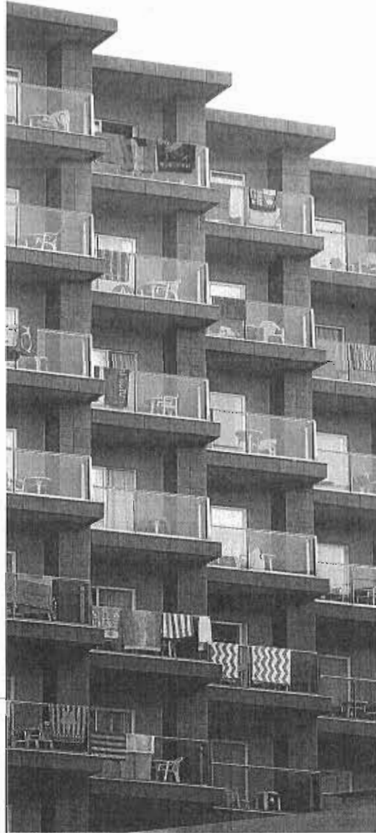
Terrazas de un hotel en Torremolinos ayer por la tarde.