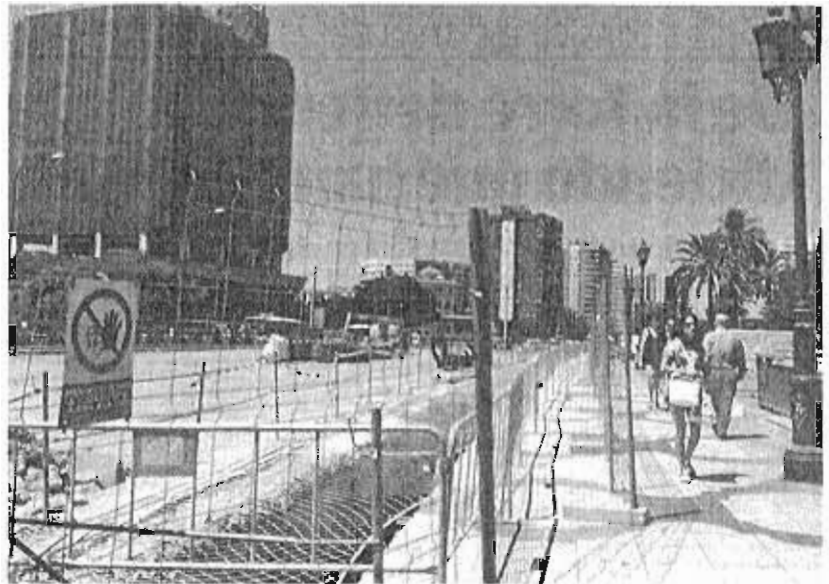
Estado de las obras previas a la demolición del lateral norte del puente de Tetuán.

Desde principios de junio está en marcha el complejo operativo que terminará con la retirada de medio puente. La Ute Sando-Acciona, que construye el tramo Guadalmedina-Atarazanas del metro de Málaga, ya ha acondicionado el espacio, de manera que se pueda mantener el tráfico y el tránsito de peatones por la parte que quedará en pie. Para ello, se