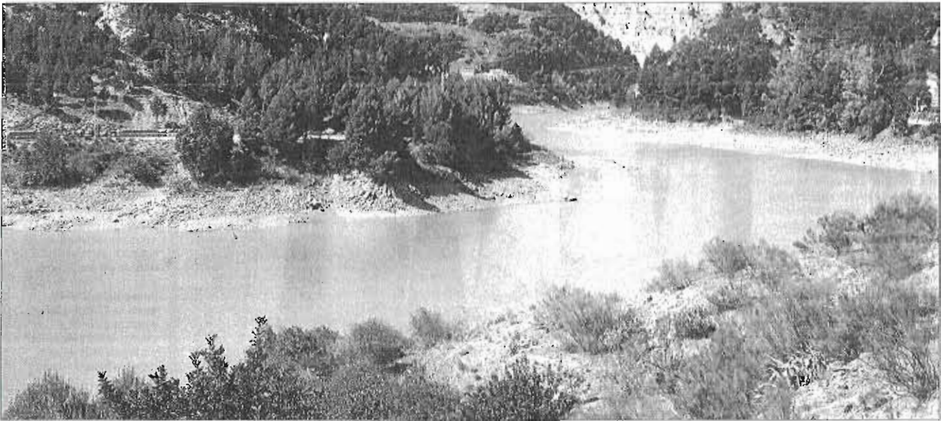
Una imagen reciente del conjunto de embalses del Guadalhorce, afectados por la falta de caudal.