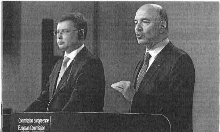
El vicepresidente de la Comisión, Valdis Dombrovskis, y el comisario de Asuntos Económicos, Pierre Moscovici, ayer en Bruselas.

A favor de España han jugado la difeíl situación política de Europa (ver análisis), las reformas y ajustes fiscales aplicados en los últimos años, y los compromisos a futuro. En palabras ayer de Pierre Moscovici, comisario de Asuntos Económicos, "aunque estos han sido insuficientes, no se pueden ignorar". Los ciuda-