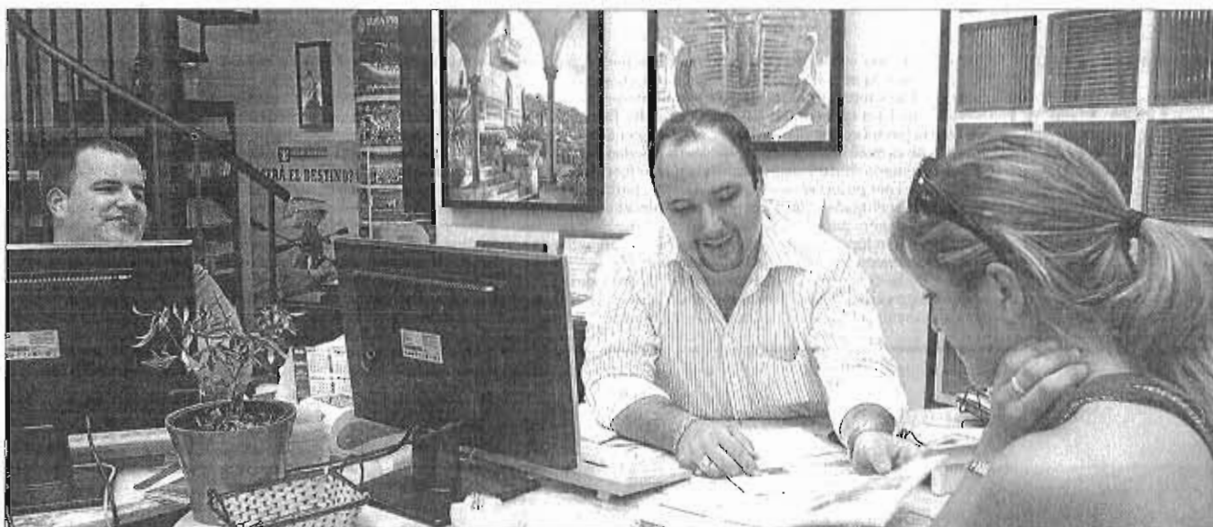
Una cliente es atendida en una de las agencias del Centro de Málaga. ARCONIEGA