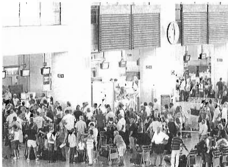
Pasajeros haciendo cola en el aeropuerto de Málaga.

En Jerez de la Frontera se contabilizaron 613.139 viajeros,