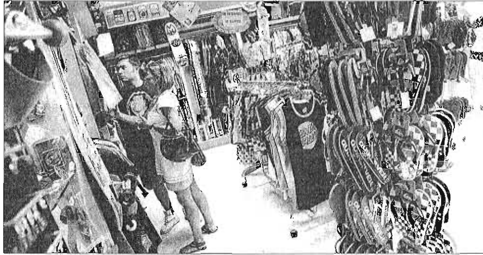
Un establecimiento comercial de Málaga.

Los datos del INE dejan también en Málaga un saldo muy favorable comparando el número de sociedades que se crean con el de las disueltas. De hecho, durante este ejercicio han desaparecido 503 sociedades, lo que significa que en la provincia se están constituyendo siete nuevas firmas por cada una que se disuelve. El presidente de la Confederación de Em-