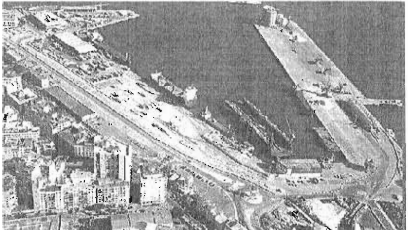
Zona en la que está prevista la instalación del centro comercial.

En el Ayuntamiento de Málaga aseguran que «gusta la idea» de ganar para uso ciudadano una de las joyas urbanísticas del Centro y se muestra abiertos a aprobar este cambio de uso en el Plan Especial, pero están a la espera de que sea el Puerto, como propietario de los terrenos, el que nueva ficha. «Consideramos