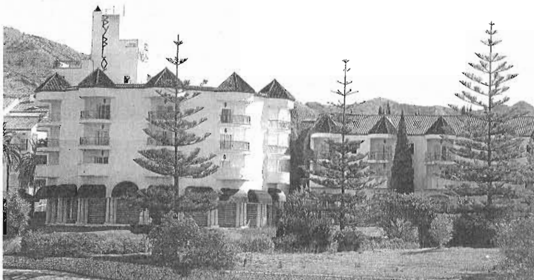
El Hotel Byblos, en una imagen de archivo.