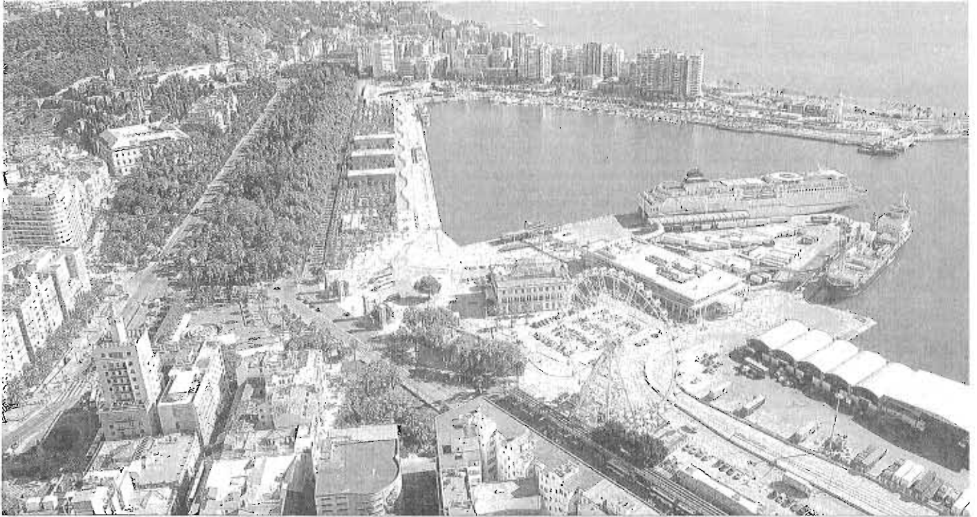
Vista aérea del puerto de Málaga.

INVERSIONES | INTERVENCIONES SOBRE LA MESA EN EL RECINTO PORTUARIO