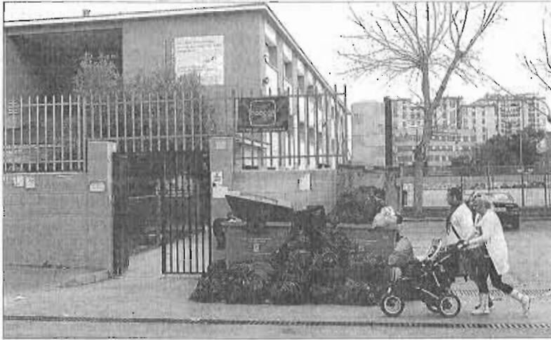
Basura acumulada delante de la puerta de un colegio en la pasada huelga de marzo.

de las dos partes, la idea no es presentar ninguna plataforma sobre la que discutir, sino que empresa y comité estarían por dar categoría de convenio a los acuerdos alcanzados en marzo de este año y que permitieron desconvocar la huelga. A ellos habría que añadirle el resto de los artículos del convenio vigente sobre los que no hay discrepancias.