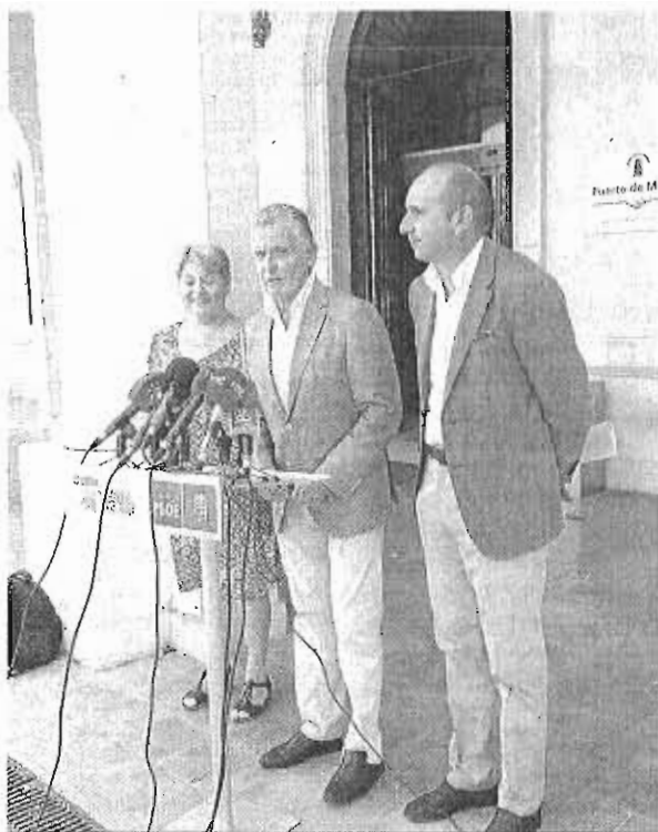
Moreno, Plata y Conejo, ayer, en la comparecencia de prensa.

construcción para minimizar los obstáculos del proyecto.