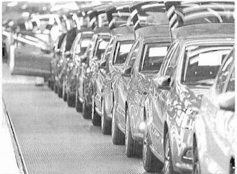
Vehículos salen de la cadena de montaje de una fábrica española de automóviles.

Funcas apunta a una desaceleración más acusada de lo previsto en el último trimestre de 2016 y en todo 2017 debido a una ralentización de la demanda nacional, sobre todo del consumo de los hogares y de las administraciones públicas, ya que la prórroga de los presupuestos de 2016 provocará la congelación de algunas partidas de gasto.