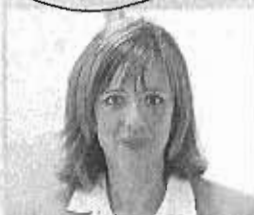
Auxiliadora Jiménez SECRET. GENERAL DE UGT

"Es una propuesta enormemente atractiva para la generación de empleo"