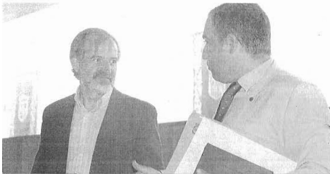
Gonzalo Sicchar, portavoz de Ciudadanos, conversa ayer con Elías Bendodo, presidente de la Diputación, momentos antes del Pleno.