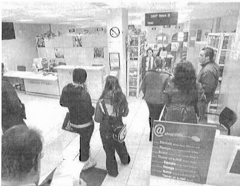
Demandantes de empleo en una oficina del SAE.