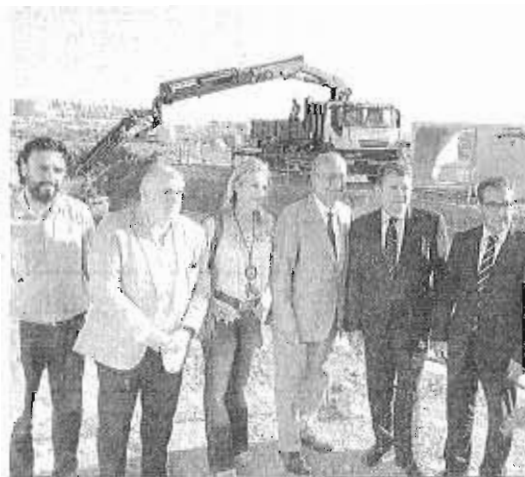
Visita de los cargos políticos a las obras del centro.

Antonio Sanz también destacó la importante labor de investigación que realiza el Instituto Español de Oceanografía en Málaga y el referente que suponen a nivel europeo, colaborando con más de 25 instituciones públicas. El delegado apuntó que, una vez finalizadas las obras, este centro "se convertirá, dentro de los 11 centros que existen en España, indiscutiblemente en uno de los centros más punteros, más modernos y que más posibilidades tiene".