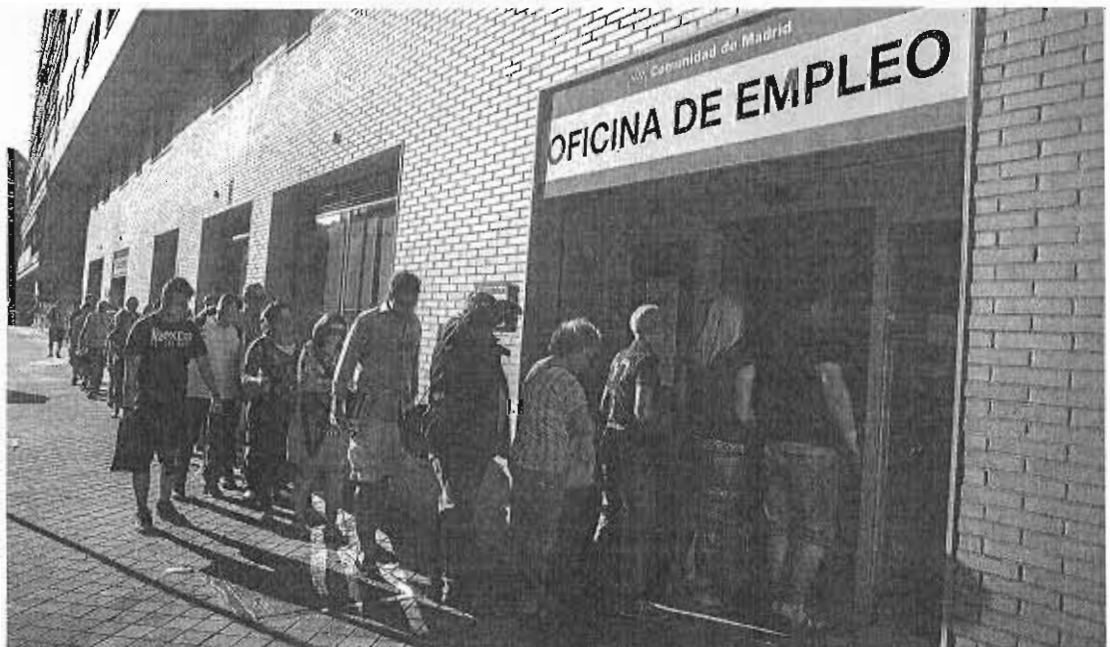
Un grupo de parados esperando su entrada a una oficina de desempleo en Madrid.

nes y, por tanto, no «podrá implementar los cambios oportunos si así lo estima conveniente». Pero a su vez deja caer que el pacto entre PP y Ciudadanos solventaba este problema en cuanto a que establecería un contrato único que equiparaba las indemnizaciones de los temporales a los indefinidos. Los sindicatos, por su parte, expresaron su «máxima satisfacción» ante una sentencia que «remienda la plana» a la reforma laboral y pone «negro sobre blanco» en el principio de igualdad de los trabajadores.