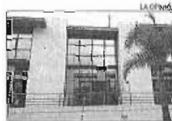
La sede de Extel en Málaga.

«Durante casi cuatro horas se ha intentado configurar la mesa de negociación; y no ha sido posible ningún acuerdo debido a que la empresa no ha querido asumir nuestras propuestas», explicó CCOO. La parte de los trabajadores solicita que el número de integrantes permita a todos los sindicatos con delegados en los cen-