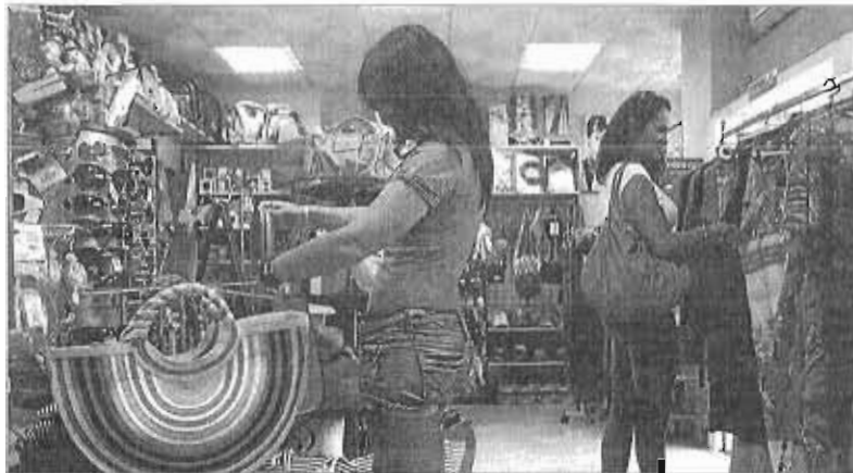
Un comercio malagueño.