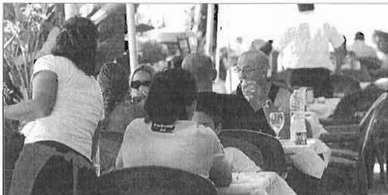
La hostelería es un sector que recurre en muchas ocasiones a los contratos temporales.