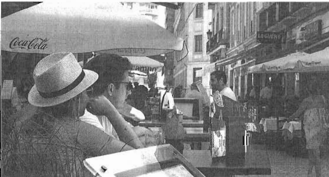
El estudio del OMAU aboga por un mayor celo en el cumplimiento de las normas para la ocupación de la vía pública con mesas. PAULA HERVELE

El trabajo del OMAU ha analizado cuatro zonas del Centro —calles Strachan y La Bolsa, y las plazas de las Flores, Uncibay y la Merced— para ver si sus negocios de hostelería acatan las normas para ocupar la calle con mesas y sillas. El resultado es que el 58% de los locales estudiados ocupan una superficie superior a la que tienen permitida, y solo el 14% cumplen con todos los condicionantes establecidos para colocar mesas en la vía pública, en relación a dimensiones, todos, publicidad, etc.