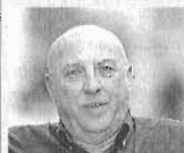
Antonio Herrera SECRET. GENERAL DE CCOO

"El impacto será tan fuerte que hará desvanecer la Catedral o la Alcazaba"