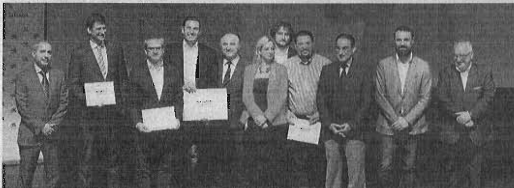
El ganador posa con los finalistas y organizadores del evento en el salón de actos del Museo Picasso Málaga.

La empresa Regemat 3D gana el Premio Emprendedor XXI en Andalucía, impulsado por La Caixa y celebrado en el Museo Picasso Málaga