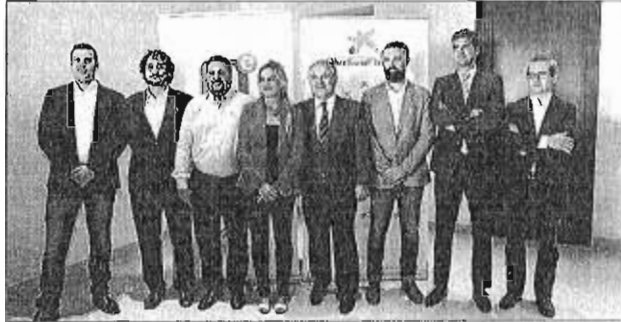
Una imagen con el ganador y los finalistas del galardón. L. O.

■ La empresa granadina Regemat 3D, dedicada a la comercialización de sistemas de bioimpresión 3D de tejidos, ha sido galardonada con el Premio Emprendedor XXI Andalucía 2016, por parte de la Caixa, a través de Caixa Capital Risc; la Consejería de Economía y Conocimiento, a través de Andalucía Emprende, y el Ministerio de Industria, Energía y Turismo, mediante Emisa, por su alto potencial