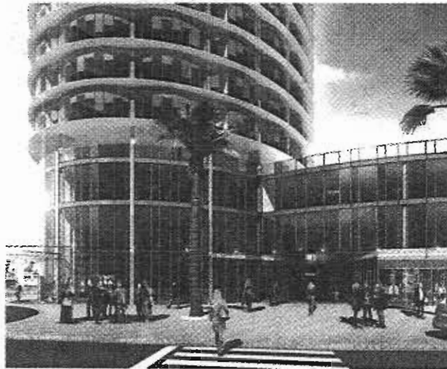
Recreación realizada por el Estudio de Arquitectura Seguí. VM

Asimismo, ha apuntado que “incluso” el sector hotelero está “satisfecho” por una iniciativa que “podría generar competencia”, aunque ha matizado: “Siempre decimos que la peor competencia es la incompetencia, así que bienvenidas sean las inversiones y la ciudad de Málaga creciendo y creando actividad”.