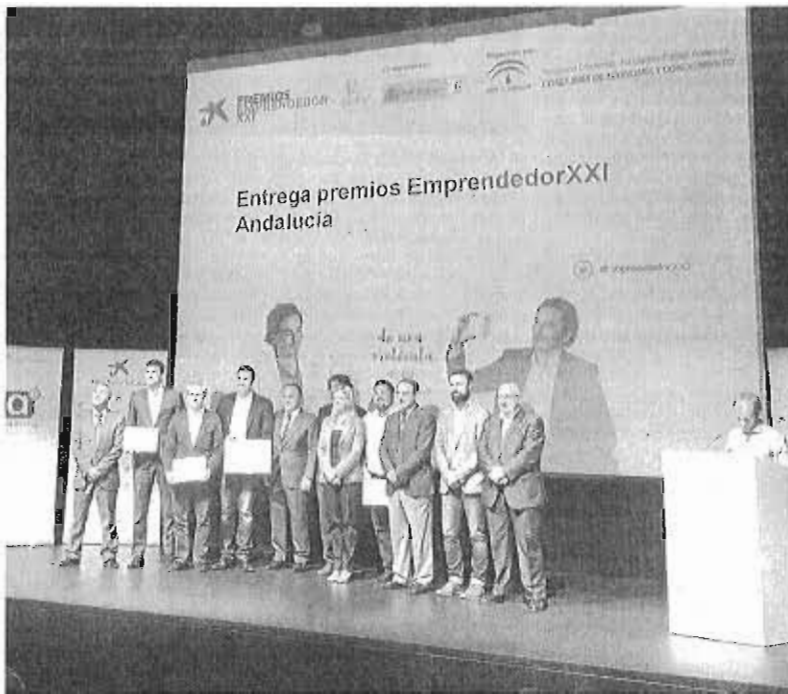
Un momento del acto de ayer celebrado en el Museo Picasso de Málaga.

edición, y ayer se conoció el ganador a escala andaluza, que posteriormente competirá a nivel nacional.