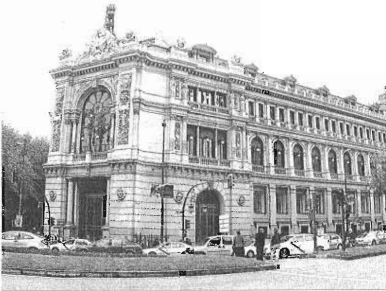
Sede central del Banco de España, en Madrid.

Sin embargo, incide en que existen riesgos externos e internos para la economía y destaca la ausencia de reformas importantes para frenar el déficit público y garantizar el cumplimiento de los objetivos marcados por Bruselas. Es tajante al advertir que la dilación en el proceso de formación del Go-