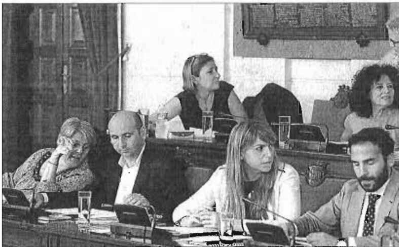
La oposición de izquierdas logró ayer hacer resurgir la consulta de Repsol, que estaba muerta. G. TORRES

En el aire del debate sobrevoló el informe del interventor sobre dicha consulta, un documento que, como los billetes de 500 euros, existe pero nadie ha visto o, al menos, todos dicen no haberlo leído,