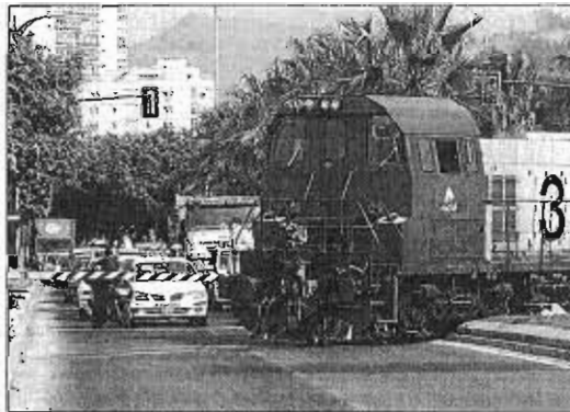
Un tren atravesando la ciudad desde el puerto. ARONIEGA

Plata, durante la inauguración de las II Jornadas de Innovación en Logística Portuaria, incidió en el