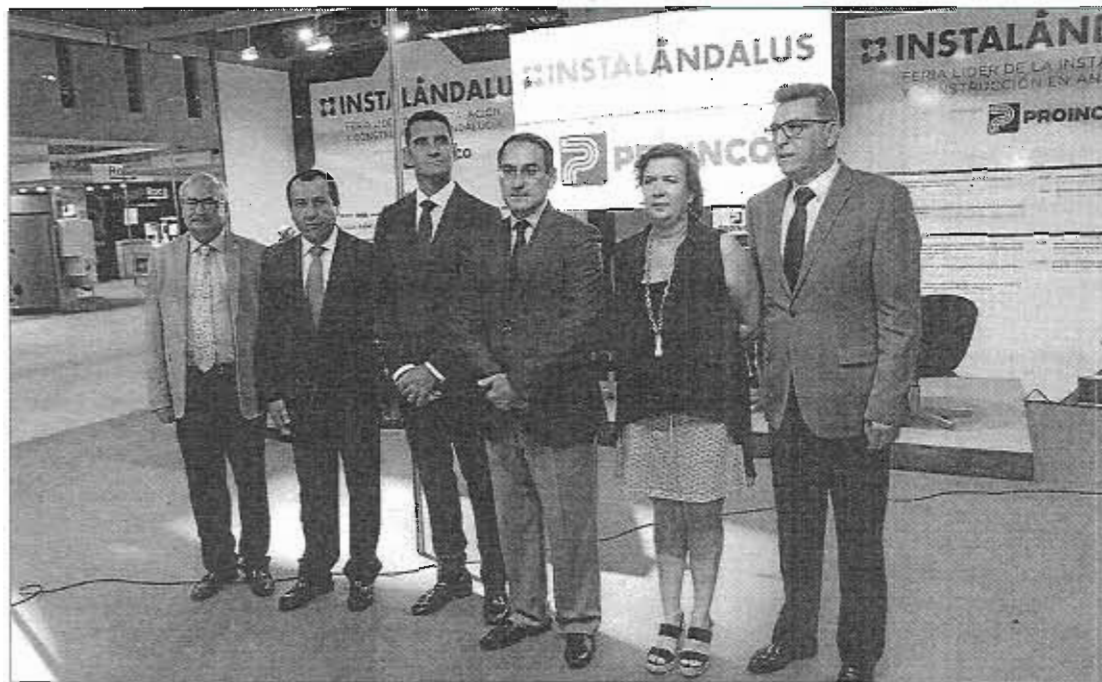
La feria Instalándalus se inauguró ayer en el Palacio de Ferias de Málaga.

Los asistentes a la feria podrán conocer hasta mañana sábado, 1 de octubre, en horario de 10.00 a 19.00 horas, las tendencias más candentes en cuanto a innovación y decoración de baños, cocinas, piscinas, climatización, así como cualquier otro espacio fundamental en la edificación y el con-