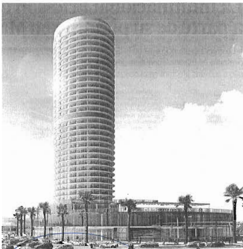
Fotografía de la torre proyectada en el puerto.

De ese montante, 319.804 euros anuales se corresponderían con la tasa de ocupación (con un tipo de gravamen del 7,3%) y al menos otros 518.000 euros por la tasa de actividad. Esta es fruto de aplicar un porcentaje sobre la previsión de ingresos anuales de la empresa. Si bien la mercantil planteaba una tasa de actividad del 2%, la posición del Puerto era la de proponer aumentar el grava-