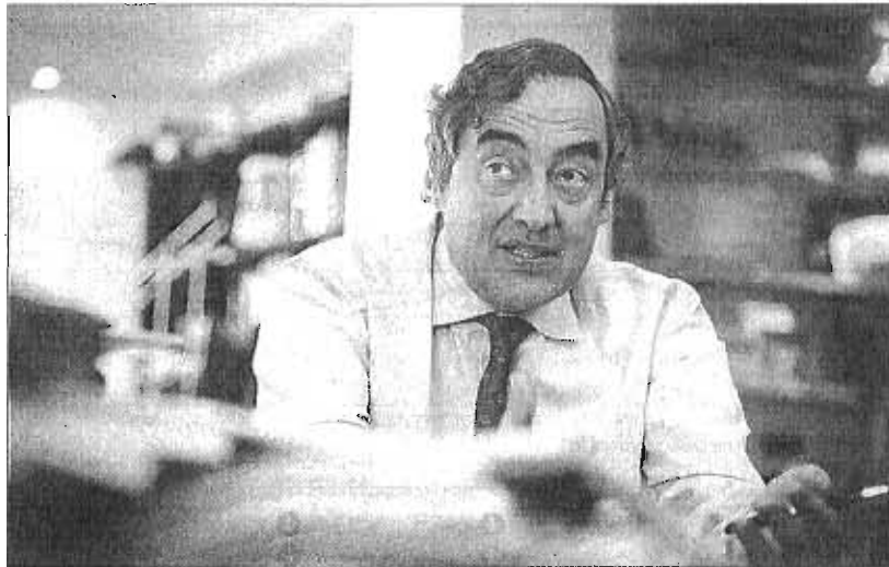
Juan Rosell, presidente de la CEOE.

En los últimos días, el presidente de la CEOE, Juan Rosell, ha enviado sendas cartas a los ministros de