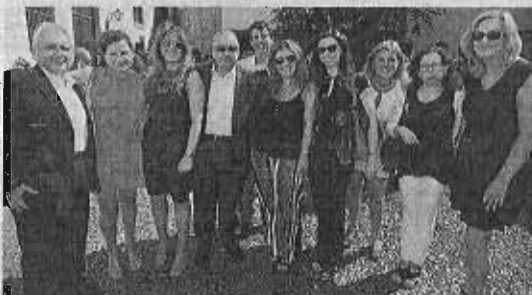
Grupo Andalucía Emprende.