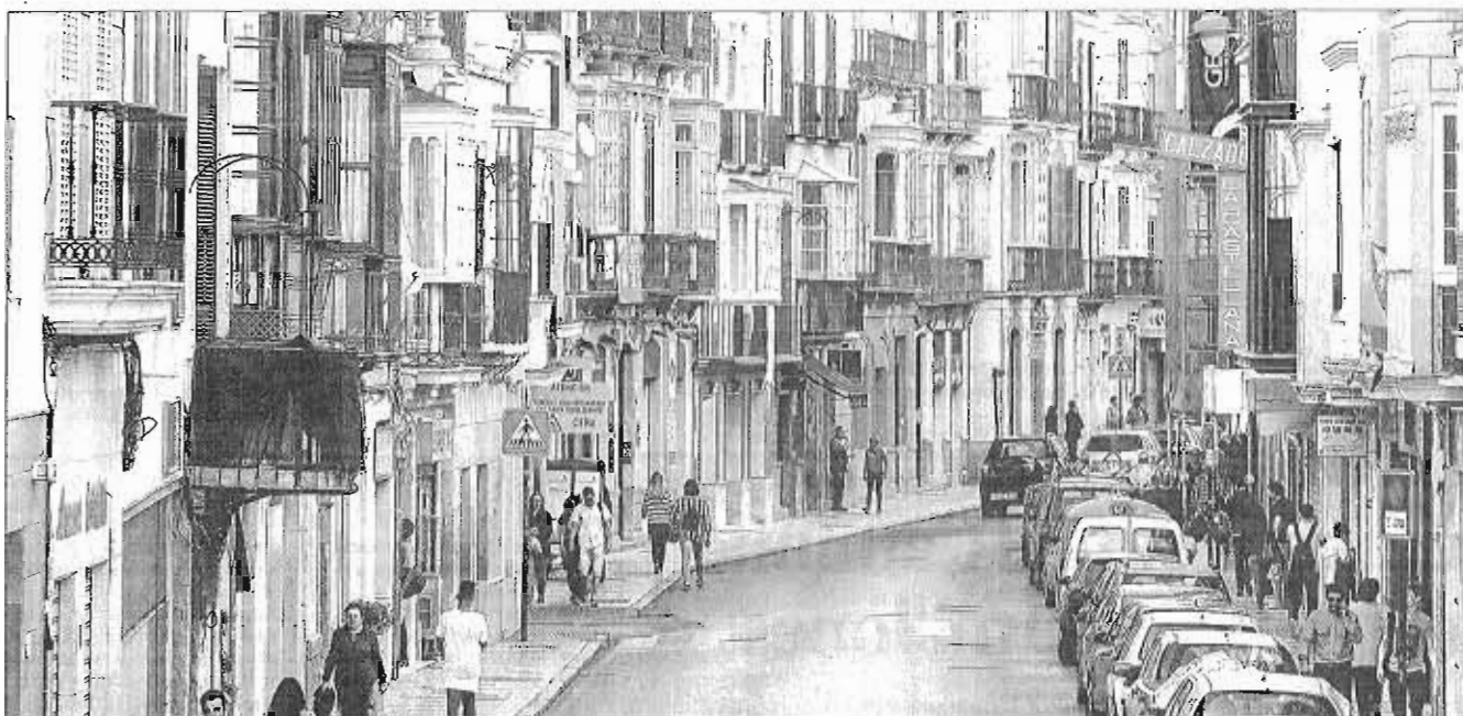
La semipeatonalización de las calles Carretería y Álamos implicará ampliar las aceras a costa de los aparcamientos, sobre todo en la primera vía. ALEX ZEA

FONDOS UNIÓN EUROPEA ▶ EL AYUNTAMIENTO SUMARÁ 3,75 MILLONES DE FONDOS PROPIOS A LA AYUDA EUROPEA