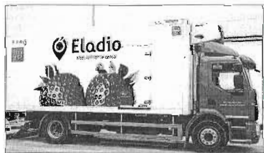
Un camión de la flota de Eladio Frutas y Verduras.

«El tujón del verano en las ventas ha estado liderado muy especialmente por los hoteles, que han logrado un nivel de ocupación muy alto y constante desde principios de junio y hasta finales de septiembre. También se ha apreciado un importante aumento del nivel de exigencia de la hostelería, principalmente entre los hoteles y los restaurantes tipo gourmet», apuntó La distribuidora cuenta con unas instalaciones en Marbella que superan los 2.500 metros