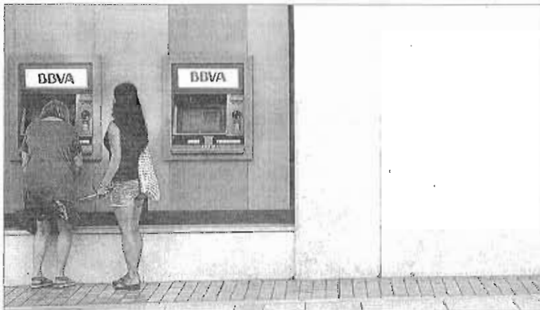
Dos mujeres en un cajero de una entidad bancaria situada en el Centro de Málaga.

Tanto entre los economistas como en el propio sector bancario se reconoce que la tendencia tiene todavía bastante recorrido, dado que la intención de las entidades financieras parece ser la de seguir ajustando la red de sucursales aplicando para ello criterios de rentabilidad. Por otro lado, no se descarta que en los próximos meses pueda producirse una nueva oleada de fusiones, lo que podría llevar al solapamiento en una misma zona de oficinas que hoy día son de bancos distintos. Eso por no hablar de las medidas de ajuste anunciadas recientemente por al-