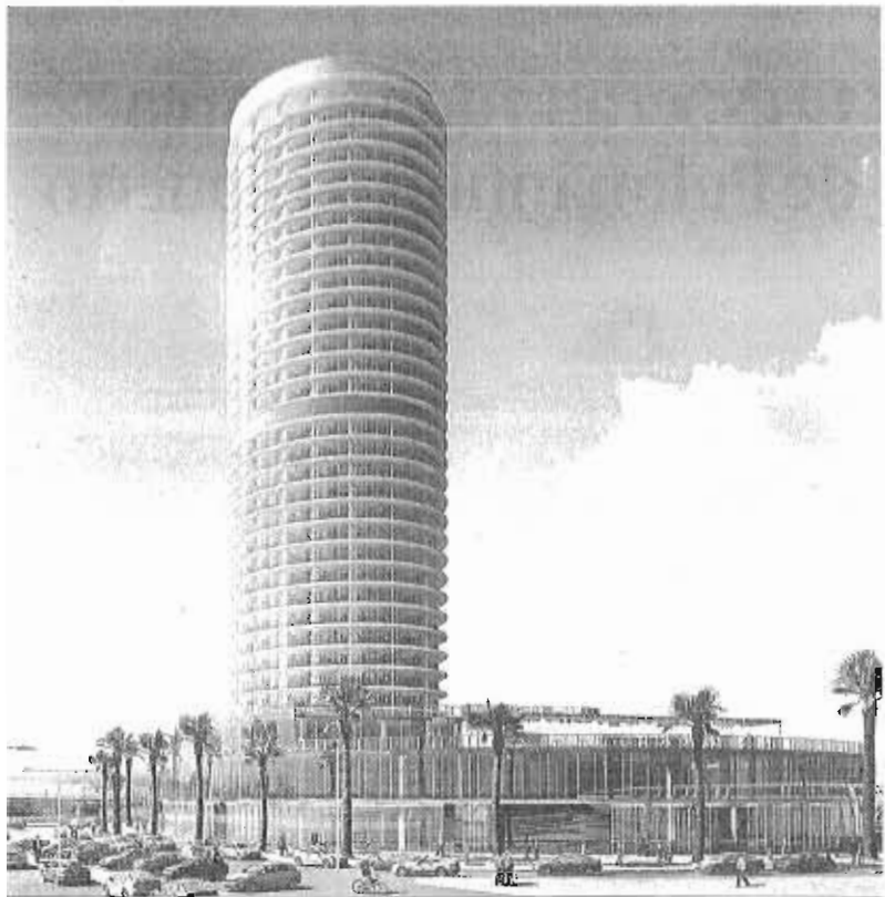
Diseño propuesto para el hotel de puerto.

El proyecto cuenta ya con el aval de la Autoridad Portuaria, que le ha adjudicado de forma condicionada la concesión sobre la parcela de 15.000 metros, a la entidad Andalusian Hospitality II, y el Ayuntamiento de la ciudad. Y ello a pesar de que aún se requiere de una modificación de elementos del Plan Especial del Puerto para permitir el uso hotelero sobre la parcela seleccionada. Para que cobre firmeza la concesión, a la aprobación de esta variación urbanística, que marcará los parámetros de edificabilidad autorizados sobre ese espacio, se tendrán que sumar la aprobación definitiva de la Delimitación de Espacios y Usos Por-