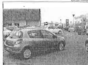
Vehículos en un concesionario.

En España, las matriculaciones alcanzaron un volumen de 874.220 unidades durante los tres