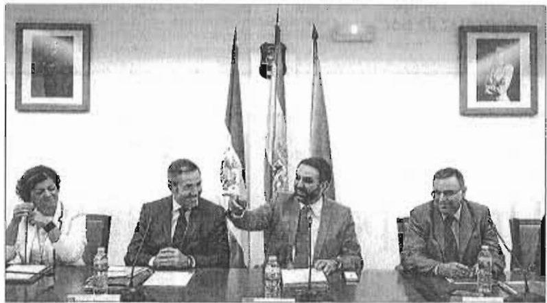
Fernández, segundo por la derecha, junto al alcalde de Mijas, segundo por la izquierda.

«Estamos haciendo todo el trámite administrativo para que sea una propuesta seria al Ministerio de Hacienda. La estacionalidad es algo que está aquí y cuando la acabemos la trasladaremos, que