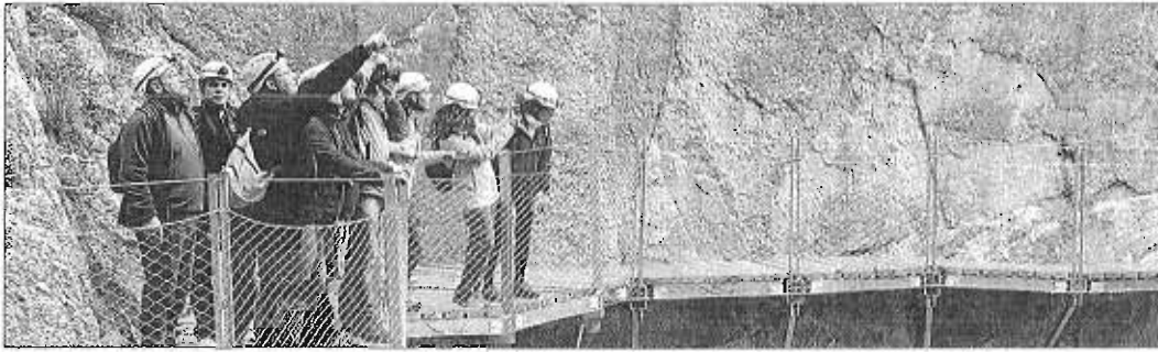
La apertura del Caminito del Rey ha supuesto un impulso económico para la zona que se quiere reforzar con fondos europeos. L. U.

FONDOS UNIÓN EUROPEA ► EL CAMINITO DEL REY RECIBE UN NUEVO IMPULSO