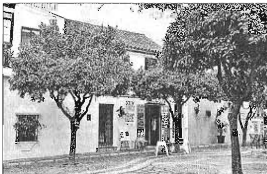
Una de las calles de Estepona mejorada con Jardines de la Costa del Sol.