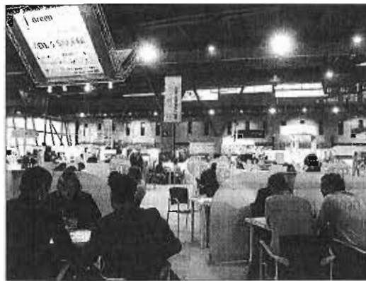
El evento cerró sus puertas ayer. ARCINIEGA

El incremento de las reuniones de trabajo va en consonancia con el aumento de ciudades participantes en la zona de networking, que también han doblado su presencia. Así, 32 ciudades españolas y latinoamericanas han contado