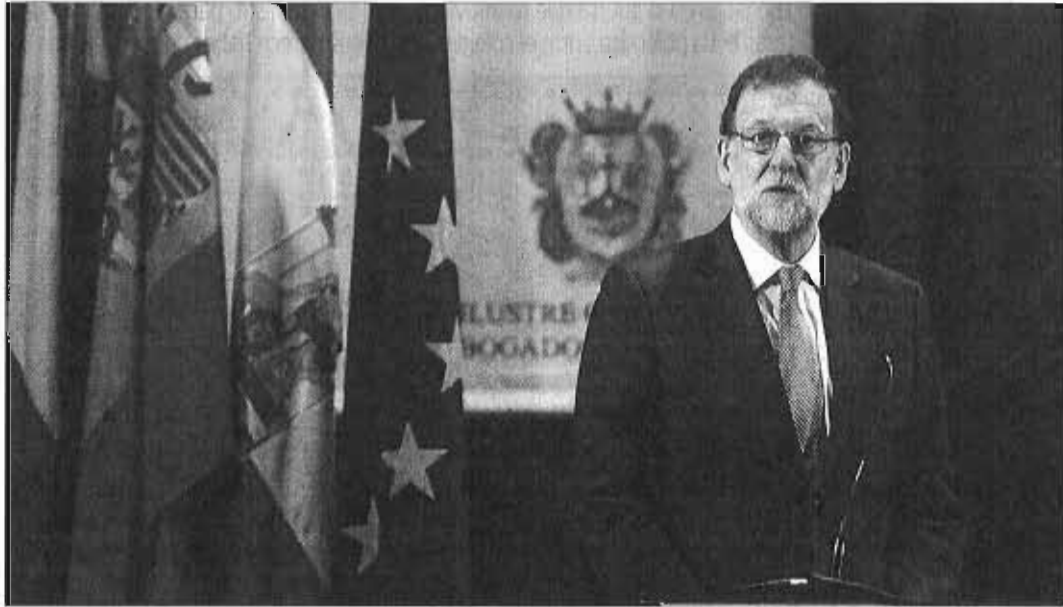
El congreso fue inaugurado ayer por el presidente del Gobierno en funciones, Mariano Rajoy

Lo que más llamó la atención fue cuando reconoció que la voz de los