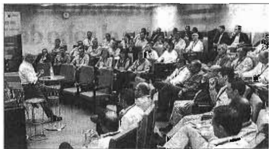
El programa se ha desarrollado en la sede de San Telmo. C.A.

Coca-Cola European Partners ha celebrado por segundo año consecutivo el programa de Alta Dirección en colaboración con el Instituto Internacional San Telmo, dirigido a más de un centenar de directivos. Los principales objetivos que persigue son sensibilizar y acercar a los principales directivos de la empresa el nuevo contexto de negocio europeo y global en el que desarrollan su actividad, ahora como empresa de carácter multinacional. «Un proceso de cambio en el que la formación ha sido un aliado indispensable», afirmó. El