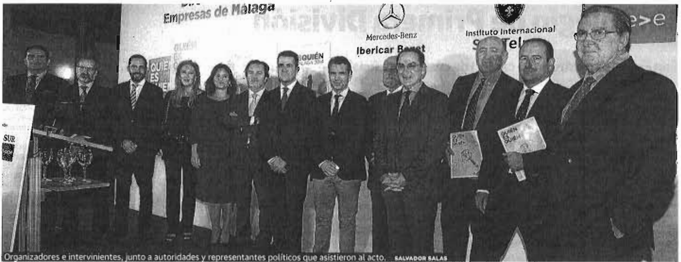
Organizadores e intervinientes, junto a autoridades y representantes políticos que asistieron al acto. SALVADOR SALAS