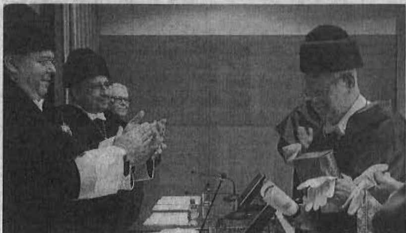
Los rectores de la Politécnica de Madrid y de Málaga felicitan al honoris causa.