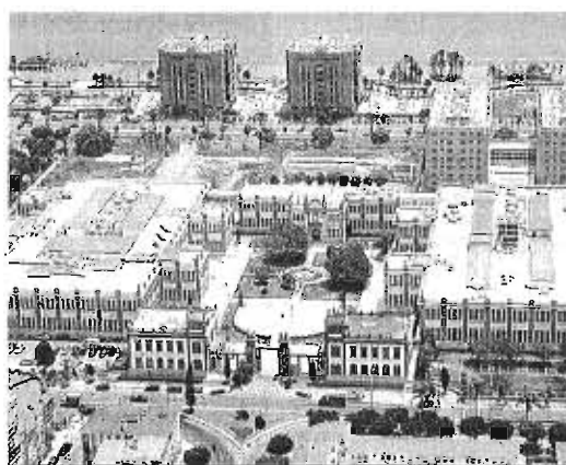
Vista aérea del complejo de Tabacalera.