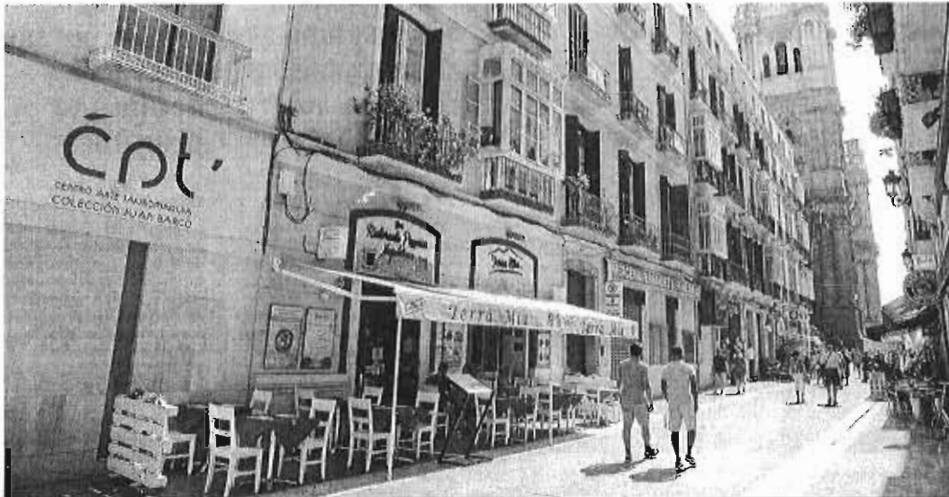
Un establecimiento hostelero en el centro de Málaga.