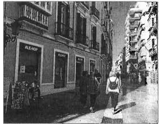
Fachada del local que acogerá Ale-Hop en la calle Cister.

Ale-Hop es una cadena de tiendas que pertenece a la empresa familiar Clave Denia, con sede en Alicante. Su actividad comenzó en 1991 pero fue el año 2000 cuando empezó a crear su red de tiendas.