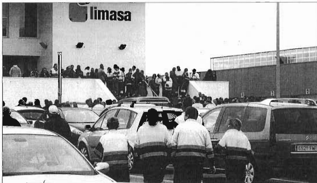
Operarios de Limasa llegando a la sede central de la empresa en Los Ruices. ALEX ZEA

La cuestión reside en que el fisco considera que el abono de ese canon de asistencia técnica debe computarse como un beneficio empresarial y no como un gasto, tal como han venido defendiendo tanto los socios privados como la propia dirección de Limasa e incluso el Ayuntamiento de Málaga en estos años. Limasa defiende que el canon es un gasto, ya que