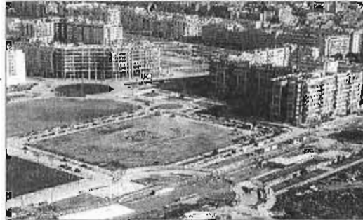
El nuevo IES Teatinos irá junto a la avenida Jorge Luis Borges.

Un mes más tarde, el cambio en la Dirección de Contratación y Recursos Materiales de la Agencia