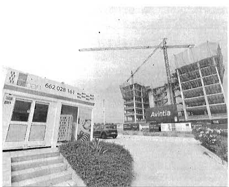
Una de las promociones actualmente en ejecución en la zona de Testinos.