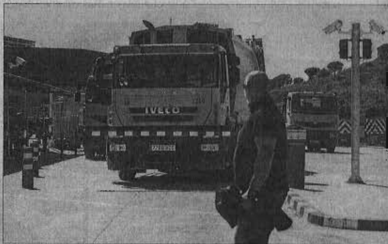
Camiones de la flota de Limasa en las instalaciones de la empresa.

Durante los años 2001 a 2010, según datos de la gerencia de Limasa, la empresa certificó como canon de asistencia la cantidad de 16.316.845 euros, que fueron a parar íntegramente a manos de los socios privados. Fomento de Construcciones y Contratas (FCC), Urbaser y Sando. Sin embargo, Limasa, según reclama ahora Hacienda, debió declarar el 30 por ciento de esa cantidad, que supone casi 5 millones de euros. Significa que Limasa ha dejado de de-