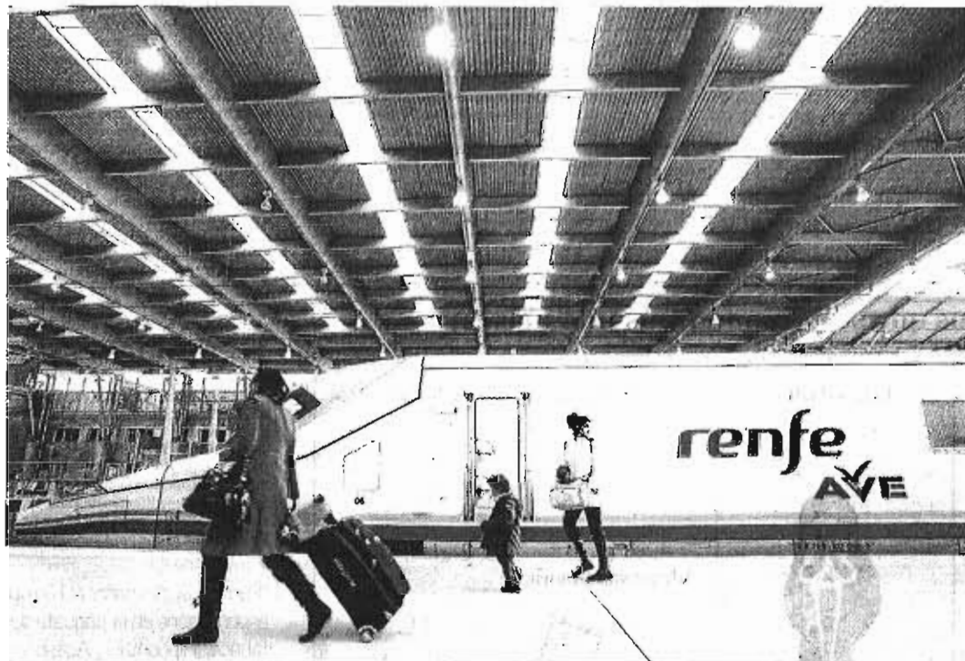
Imagen de archivo de uno de los trenes AVE Málaga-Madrid, en la estación María Zambrano.

● El procedimiento está paralizado desde abril ● La solución, con un coste previsto de 31 millones, rebajaría el trayecto en unos 20 minutos