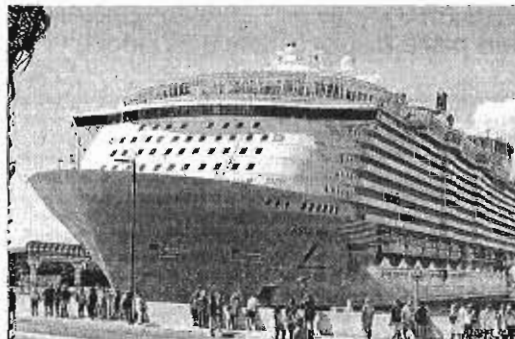
Un crucero atraado en el puerto de Málaga.

La web cuenta con al menos cinco millones de usuarios en todo el mundo, que han tenido la oportunidad de votar entre el 1 de agosto de 2015 y el 31 de julio de este año. Son estos usuarios los que han decidido que los cinco mejores destinos del Mediterráneo debido a su oferta turística son Barcelona, Cannes, Nápoles, Cartagena y Málaga.