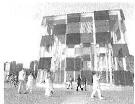
Performa en las puertas del Centre Pompidou de Málaga.

Los museos analizados son el Centro de Arte Contemporáneo (CAC), el Museo Picasso, el Centre Pompidou, el Museo Carmen Thyssen, la Fundación Picasso Museo Casa Natal, el Museo del Patrimonio Municipal (MUPAM), Ars Málaga-Palacio Episcopal, la Colección del Museo Ruso, el Museo Automovilístico y de la Moda, el Museo Interactivo de la Música, el Museo Reveño de To-