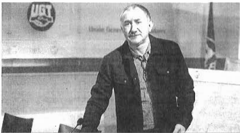
El secretario general de UGT, Pepe Álvarez, ayer.

Álvarez insistió en que los acuerdos de subida salarial en el pasado siempre tenían bandas y