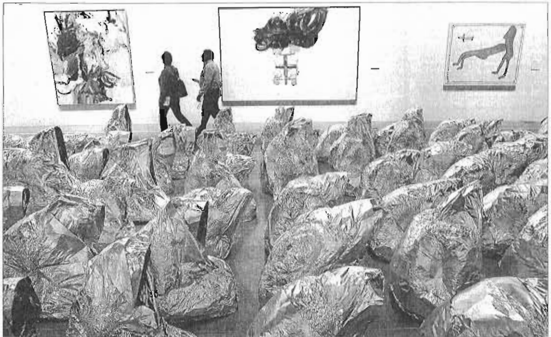
Detalle del interior del Centre Pompidou de Málaga. GREGORIO TORRES

De la Torre dijo ayer poca importancia a las críticas a la ciudad recogidas en el Informe sobre los visitantes de los museos, que consideran la limpieza como un aspecto claramente a mejorar. El regidor dijo respetar la opinión de los encuestados, si bien insistió en que existen otros sondeos que reflejan justamente lo contrario. Por otro lado, insinuó que el descontento del que se hace eco el estudio podría deberse al mal aspecto que presenta el entorno de La Alameda por culpa del retraso acumulado en las obras del metro.