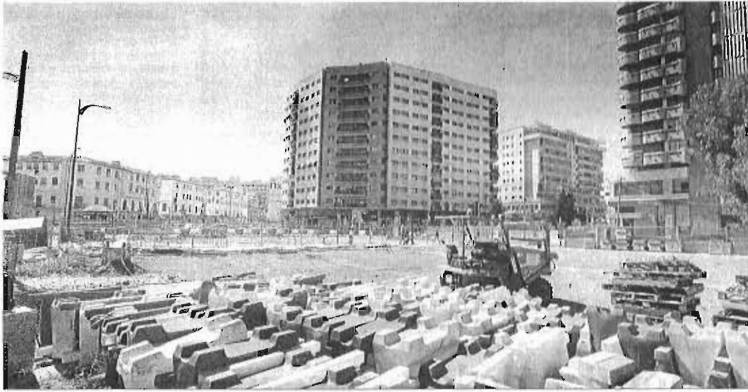
Vista de las obras en la plaza de Albert Camus al comienzo del conflicto con la constructora.