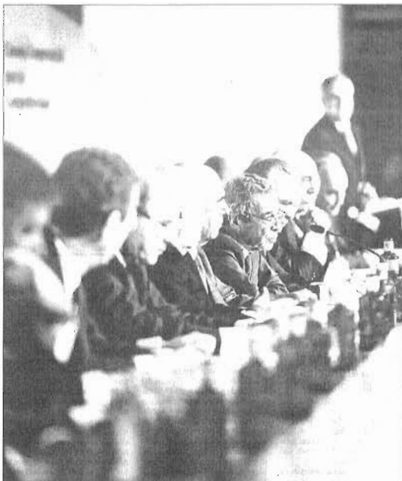
César Alierta (en el centro), durante una reunión del Consejo Empresarial para la Competitividad. GONZALO ARROYO

Otros miembros reconocen que sí se ha hablado de política y de medios de comunicación en diversas reuniones y sobre qué opciones podían ser mejores para España, pero siempre sin montar conspiraciones u operaciones políticas, sostienen. Cuando Pedro Sánchez era líder del