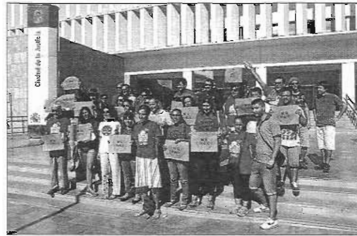
Concentración de afectados por la hipoteca en Málaga.

En este sentido, recordaron que los gastos derivados del préstamo corresponden al prestatario y los de la hipoteca correspondrían al prestamista. Respecto a los gastos que podría reclamar el consumidor, la asociación apun-