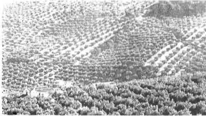
Paisaje oliverero en la provincia de Jaén, la más afectada por los impagos de las ayudas de la Junta.

La Junta adeuda a los jóvenes agricultores la ayuda al pago básico, conocido como greenig , la mitad de las ayudas a la primera instalación de 2015, las ayudas a zonas desfavorecidas y la reserva nacional. "Los jóvenes están pidiendo préstamos personales a los bancos o tirando de ayudas de sus padres, los que pueden, para financiar el importante coste que supone la recogida de aceituna", asegu-