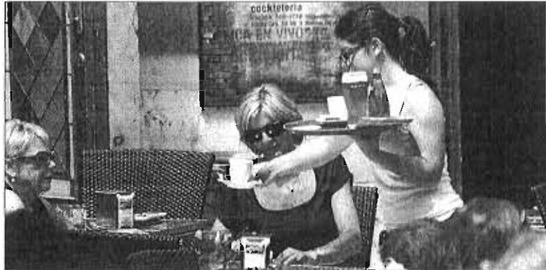
Una trabajadora de hostelería en Málaga.

El problema de la temporalidad en la provincia, muy dependiente de segmentos estacionales como el turismo, es tradicional pero, como denuncian persistentemente los sindicatos, se ha agudizado a raíz de la crisis y de la reforma laboral.