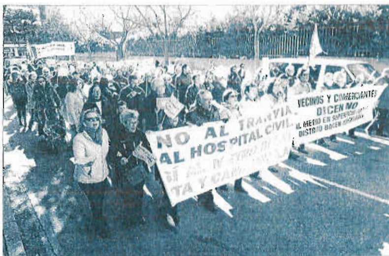
La manifestación en contra del tranvía al Civil apenas reunió a un centenar de personas.