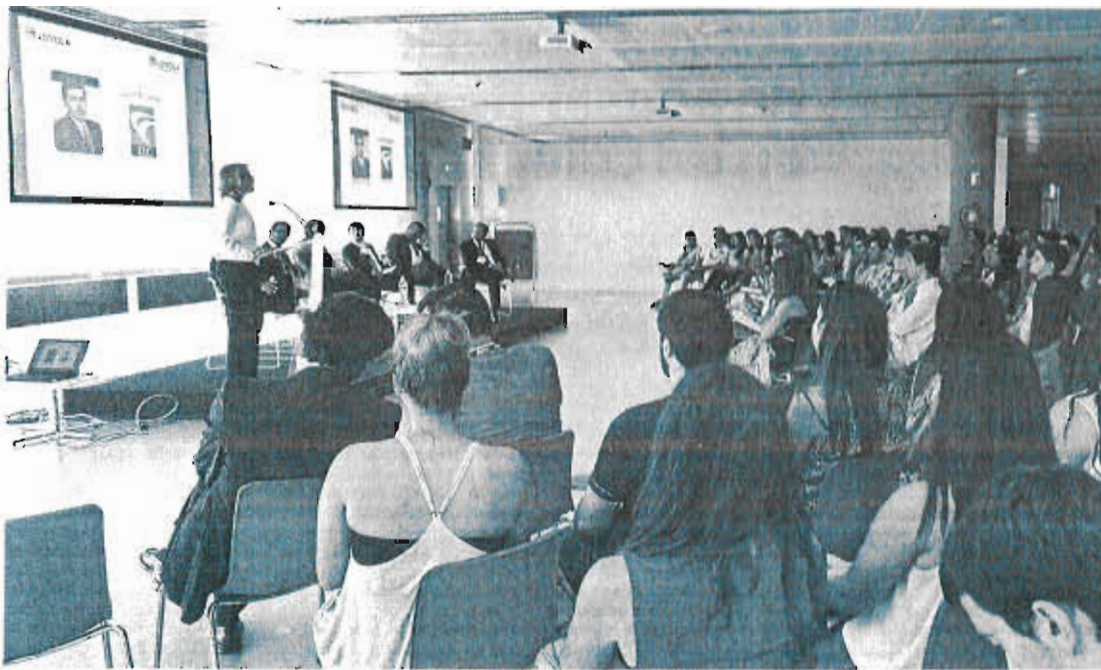
La Universidad Loyola Andalucía cuenta con más de 1.500 alumnos, según la memoria de actividades del curso 2015-2016.