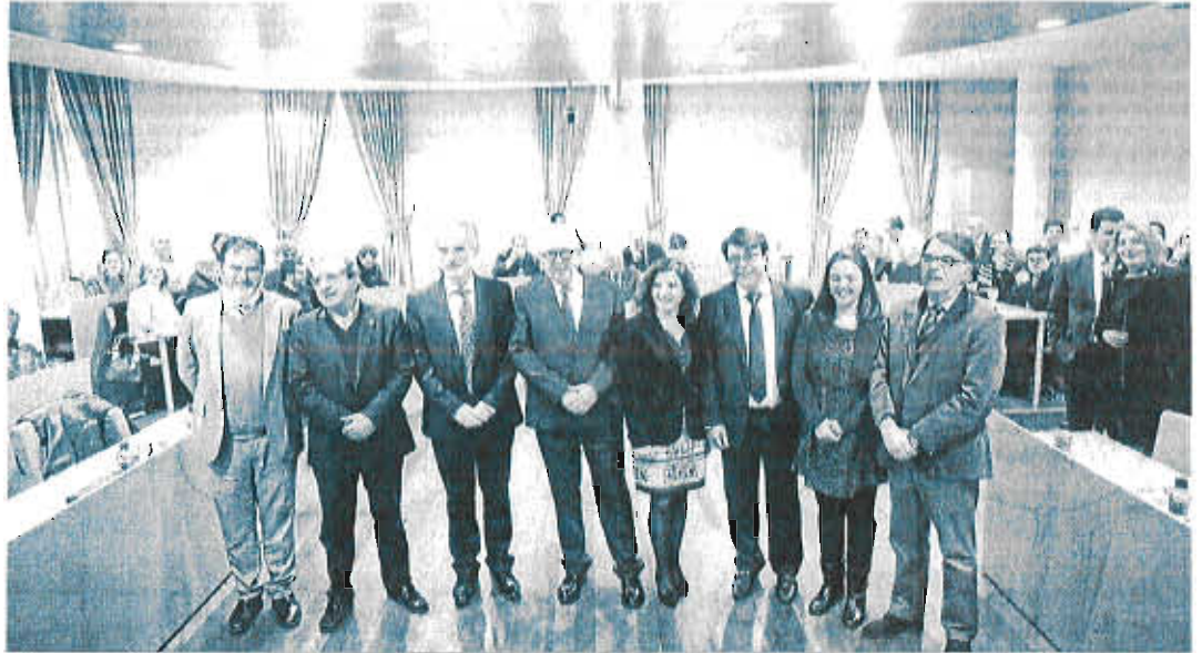
Los consejeros de Salud y Empleo, junto al rector de la UMA y varios miembros de la cátedra de Economía de la Salud, ayer.

"Planteamos que con la nueva estructura y organización hospitalaria en toda la provincia lo que procedía era hacer un grupo de trabajo en el que participasen tan-