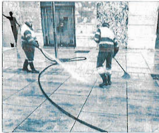
Operarios de Limasa, en Málaga.

De la Torre defendió la municipalización de la empresa ligada a indicadores de productividad, indicando que «este camino nos puede dar un juego muy interesante porque si hay un interés de los trabajadores en que sea así; además, subrayó, «eso nunca se hizo en España y me parecen muy importante que eso se consiga y se haga de una manera convencida por parte de los trabajadores». «Se trata de una operación de cambio de