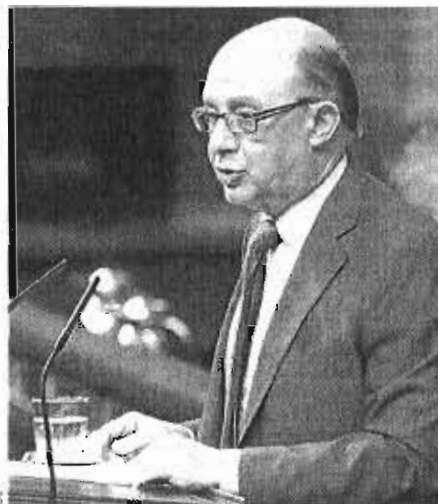
Cristóbal Montoro, ministro de Hacienda

Los abogados de las empresas interesadas no dan el caso por perdido. Aseguran que la clave está en cómo los juzgados nacionales interpreten que una empresa era libre de acogerse al plan. Juan Tornos, abogado de IOS Finance EFC, cree que el juez puede inter-