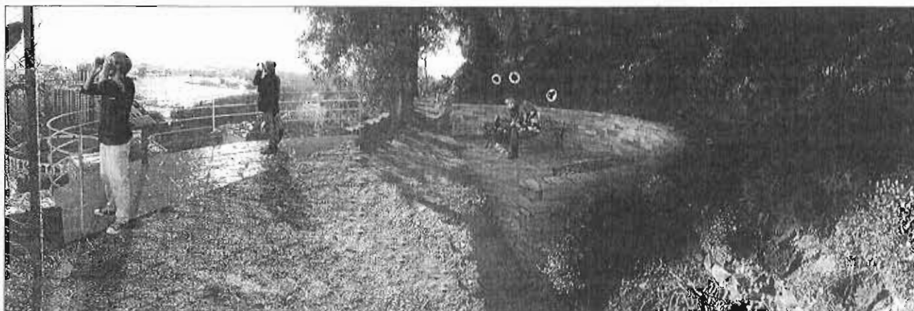
Recreación de como será el nuevo mirador que se abrirá en la ladera de Gibralfaro.