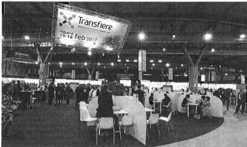
Más de 5.000 reuniones de trabajo se han celebrado en el foro Transfiere.

Así, se proponen poner en marcha de planes de actuaciones comunes que impliquen alianzas público-privadas, el impulso de la cultura de la innovación en las comunidades universitarias y las empresas, la transferencia del conocimiento desde la formación y la renovación del tejido productivo. «Estamos apostando por la innovación y por la internacionalización, y ello tiene ir de la mano del