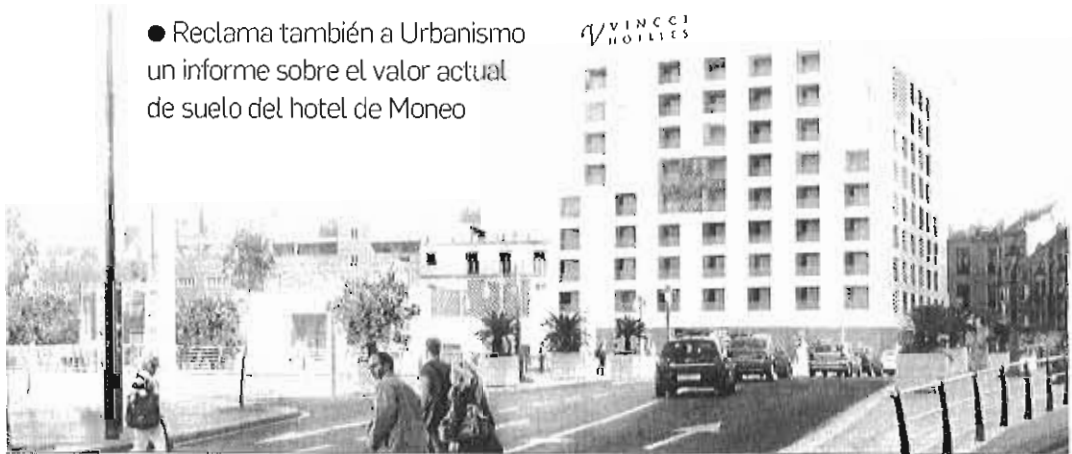
Infografía del diseño del hotel de Rafael Moneo en Hoyo de Esparteros.

● Reclama también a Urbanismo un informe sobre el valor actual de suelo del hotel de Moneo