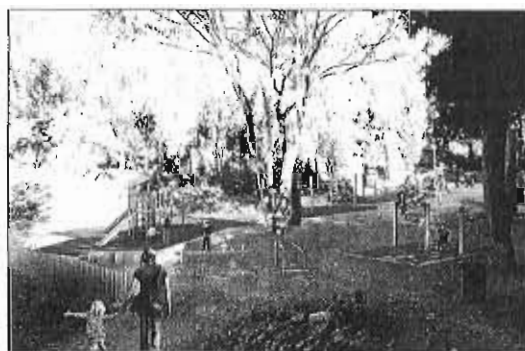
Recreación del parque infantil proyectado en Gibralfaro.