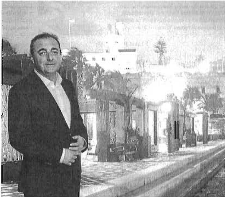
El viceconsejero de Turismo de Melilla posa frente a un cortel del puerto de la ciudad autónoma.

-Pero fueron tiempos más difíciles. Cada día tenemos menos tiempo para disfrutar de las cosas. El que tengamos transportes más ágiles y rápidos con una capacidad mayores es lo que hace posible que disfrutemos todos: que vengan más melillenses a Málaga y más malagueños a Melilla.