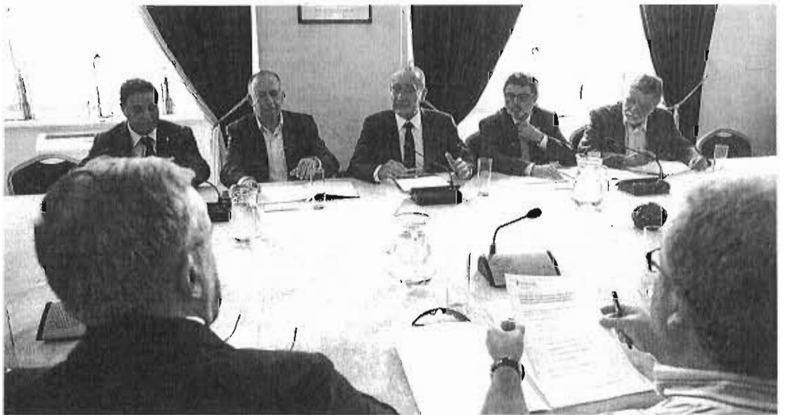
El alcalde, con representantes de colegios, expertos y profesionales de la sanidad, en los preparativos de la candidatura de Málaga.