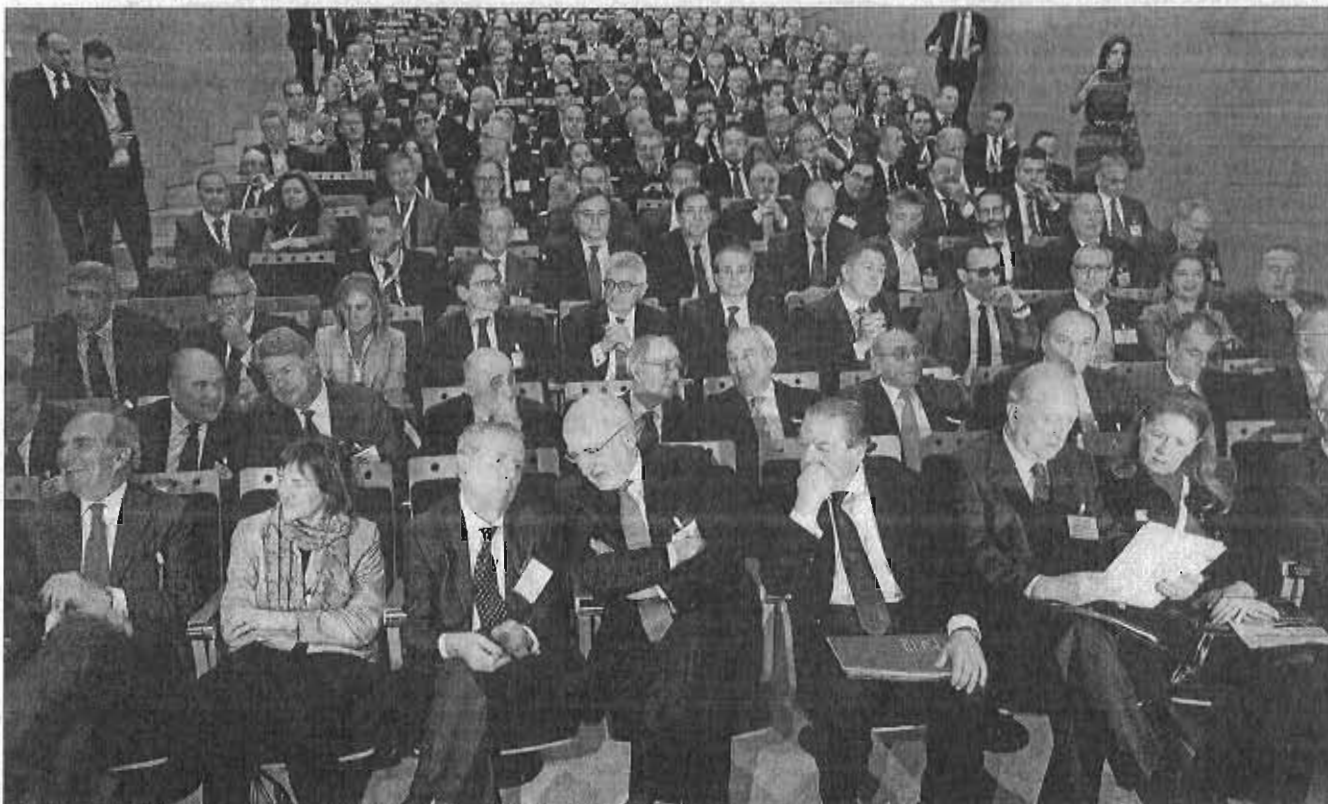
Empresarios que participaron el pasado mes de febrero en el acto celebrado en Tarragona.

▶ ENCUENTRO HOY EN MURCIA AL QUE SEGUIRÁ OTRO EN ABRIL EN ALMERÍA