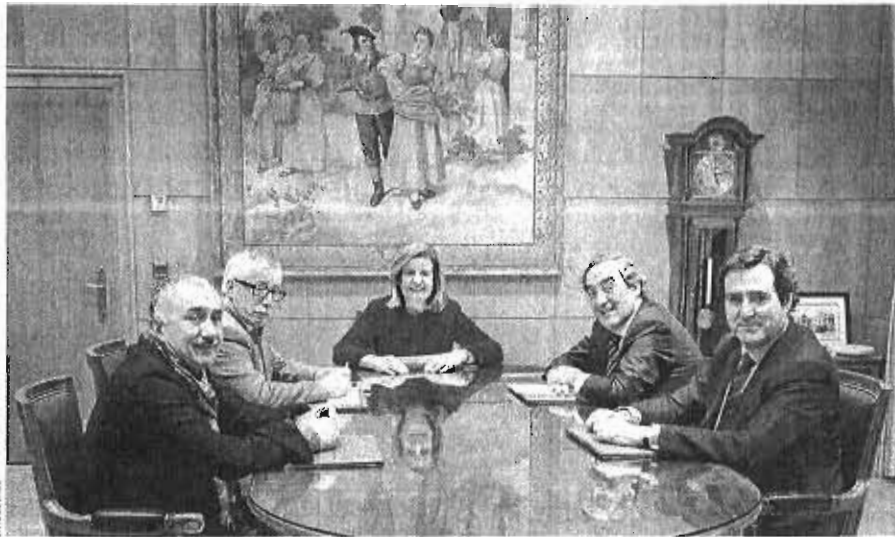
La ministra de Empleo, Fátima Báñez, en una reunión con los representantes de los sindicatos y de la patronal.

La doctrina hasta ahora ha dicho que estos servicios vulneran el derecho a la huelga. Quiénes subcontrataron son clientes de la empresa principal y la subcontratación tuvo el efecto de neutralizar la huelga. La Audiencia Nacional en la sentencia que anula el Supremo, señala que "los actos vulneradores del derecho de huelga pueden ser realizados por terceros empresarios distintos del titular de la empresa o centro de trabajo en cuyo ámbito se produce la huelga, si