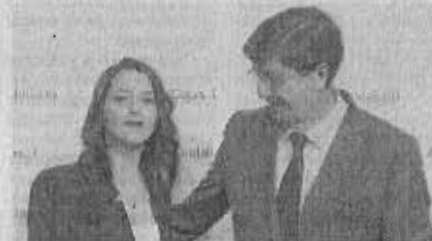
Inés Arrimada y Juan Marín, ayer, en Sevilla.

En la misma línea se manifestó Inés Arrimada, portavoz de la Ejecutiva nacional de Ciudadanos y jefa de la oposición en Cataluña, durante el mismo acto celebrado en la Fundación Cajasol y organizado por Europa Press . "Lo importante para los andaluces no son las crisis internas del PSOE, que no deben afectar en lo más mínimo al día a día de los andaluces", aseguró. "En Ciudadanos queremos ser útiles desde la oposición, aunque aspiramos a gobernar", defendió.