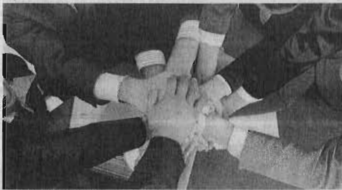
Andalucía registró el 18% de las nuevas cooperativas creadas en España a lo largo de 2016.

Andalucía sigue liderando la creación de cooperativas de trabajo, y respecto a la creación de empleo, la comunidad también ocupa el primer lugar, con el 20% del empleo creado en el sector en 2016. En ese ejercicio se crearon 1.809 nuevos empleos cooperativos, lo que supone un aumento del 3,2% con respecto al año anterior.