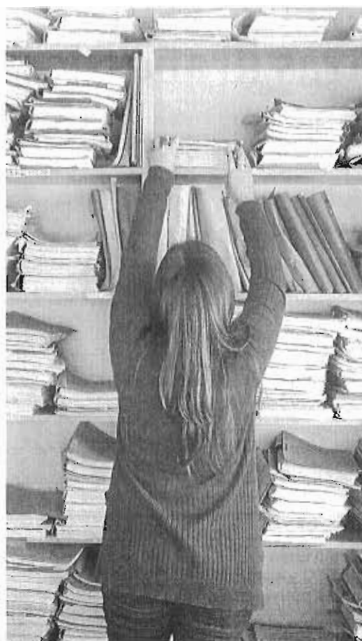
Los juzgados, por ejemplo, están colapsados.