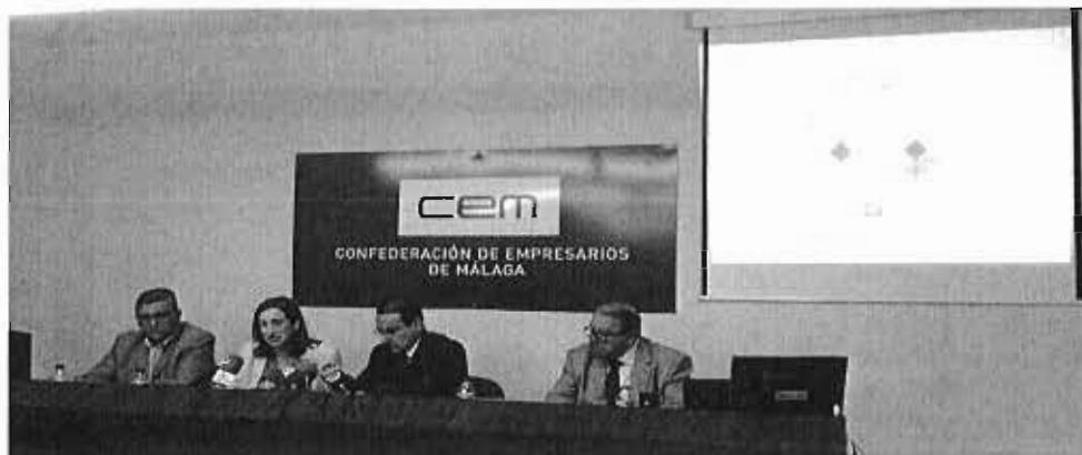
CEM. Presentación informe 2016-2017