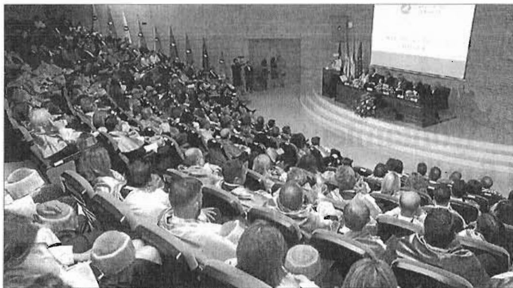
Imagen del salón de actos de las facultades de Ciencias de la Comunicación y Turismo, donde se inauguró ayer el curso de la UMA. ARCHIEGA

Respecto a la Universidad de Málaga, el rector hizo una apuesta decidida por dedicar toda su energía a defender la ciencia, la investigación y la innovación, para lo que luchará por que se reconozca a las instituciones académicas «no solo por su historia, su tamaño o su posición en los rankings, sino ade-