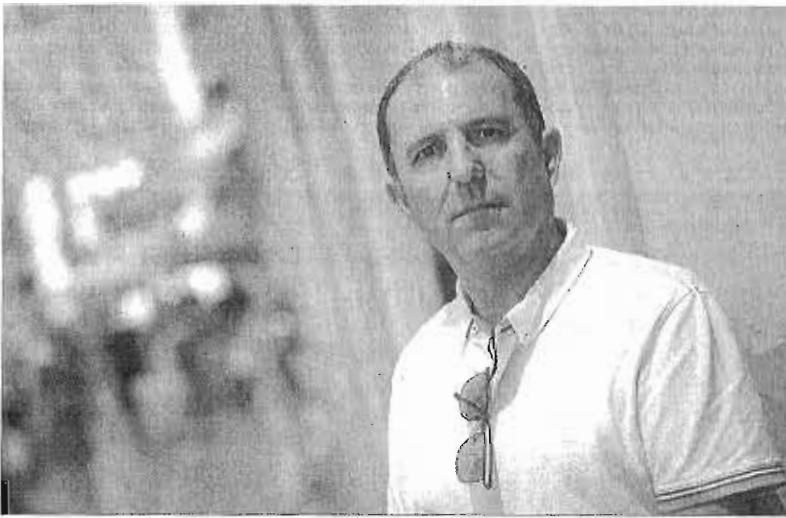
El candidato, al inicio de la campaña en la calle.