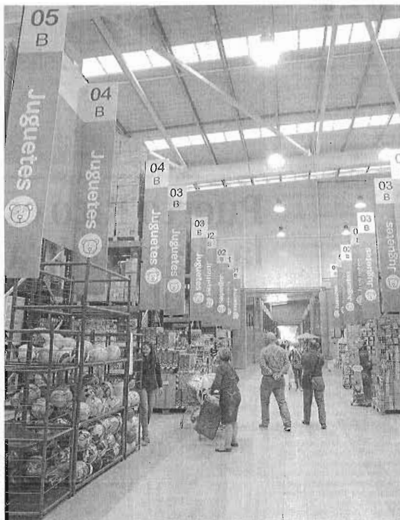
Varios clientes compran en la empresa familiar sevillana Plásticosr.

No obstante, ese optimismo generalizado no hace olvidar a las empresas familiares que se enfrentan también a un entorno complejo plagado de retos. No en vano, un 51% señalan la creciente competencia como el principal desafío al que se enfrentan en la actualidad. La necesidad de contar con profesionales cualificados, indicado por un 40%, y la disminución de la rentabilidad, señalada por un 32%, le siguen como las principales trabas observadas por las empresas familiares españolas.