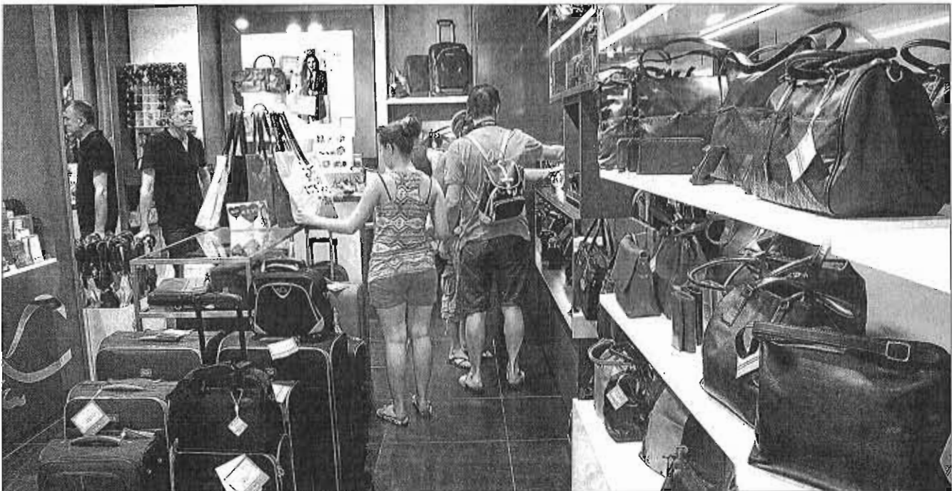
El comercio es el sector que reúne a más autónomos en la provincia de Málaga. ARCNIEGA