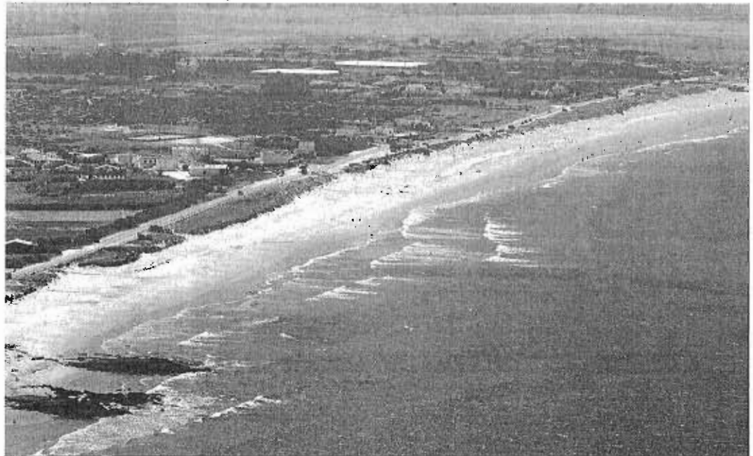
Vista aérea de la playa de El Pelmer, en Vejer.

La sentencia, dictada a instancias de una demanda del Ayuntamiento de Barbate (Cádiz), además de la razón que motivó la anulación, rechaza la concurrencia de circunstancias de "extraordinaria y urgente necesidad", ya que la Junta tiene capacidad legal para proteger los ámbitos de suelo sin tener que acudir a un instrumento tan "excepcional" como el decreto ley por el que se aprobó el plan. Asimismo, se alude a "falta de motivación" y al incumplimiento de varias normas urbanísticas.