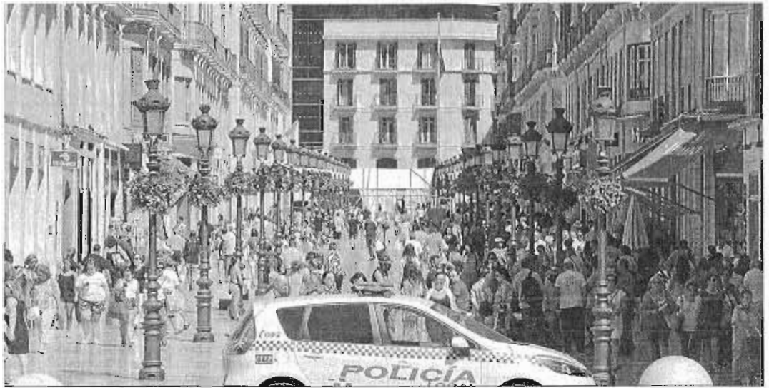
Personas pasean por la calle Larlos.

resto de sectores. El paro se disparó en los años siguientes, llegando a alcanzar tasas de desempleo superiores al 36%, y la depresión económica y social era absoluta. La palabra crisis se repetía en todos sitios, en los bares, en las conferencias, en los colegios... Nadie esperaba que la recesión fuera a ser tan profunda y duradera, pero la verdad es que no se empezó a respirar hasta 2015. Por el camino han quedado muchas empresas y muchas personas, que han tenido serias dificultades para reintegrarse al mercado laboral, tantas que miles de ellas, sobre todo las de mayor edad, aún no