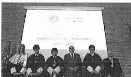
Mesa presidencial de la apertura del curso académico. I. A.