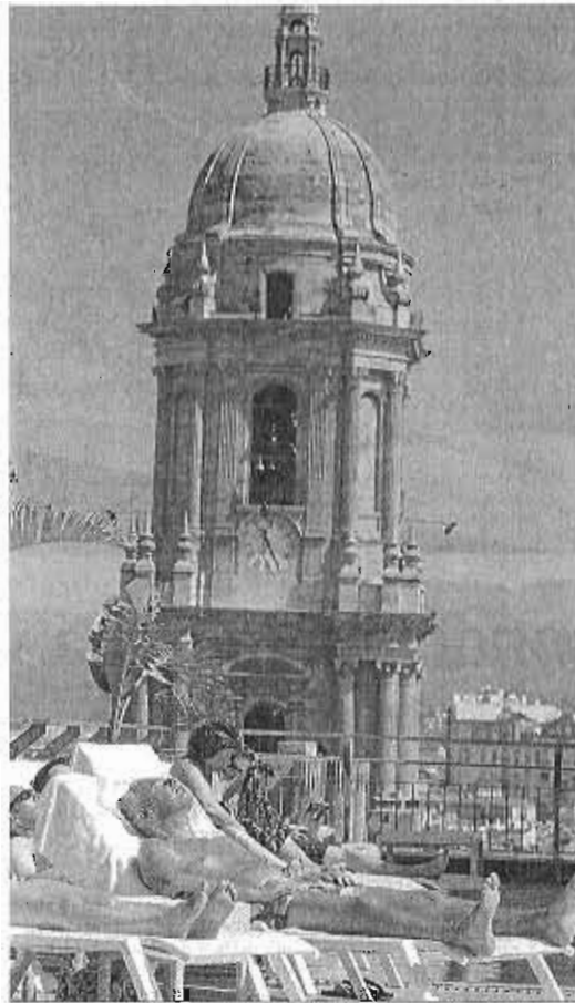
Varios turistas disfrutan de la terraza de un hotel de la capital. JAVIER ALBIÑANA

Así, han destacado que la ciudad de Málaga y la Costa del Sol están demostrando "una gran fortaleza y una auténtica revolución en la reconversión de un