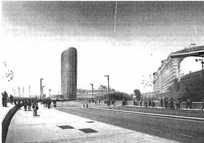
Diseño del hotel proyectado en los terrenos del dique de Levante.

● El Puerto y la CEM advierten del riesgo de que un procedimiento excesivo acabe provocando la marcha y el rechazo de los inversores