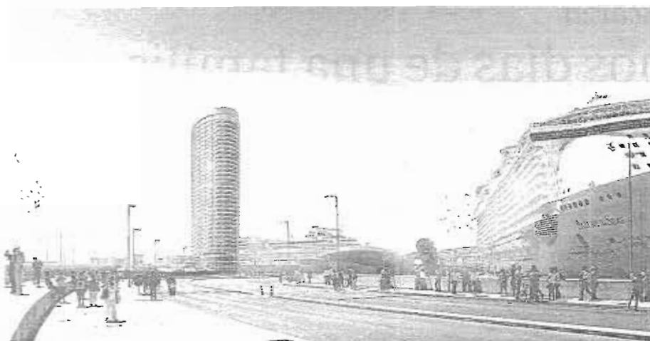
Recreación de la futura torre que en el Puerto de Málaga albergará un hotel, proyectada por José Seguí