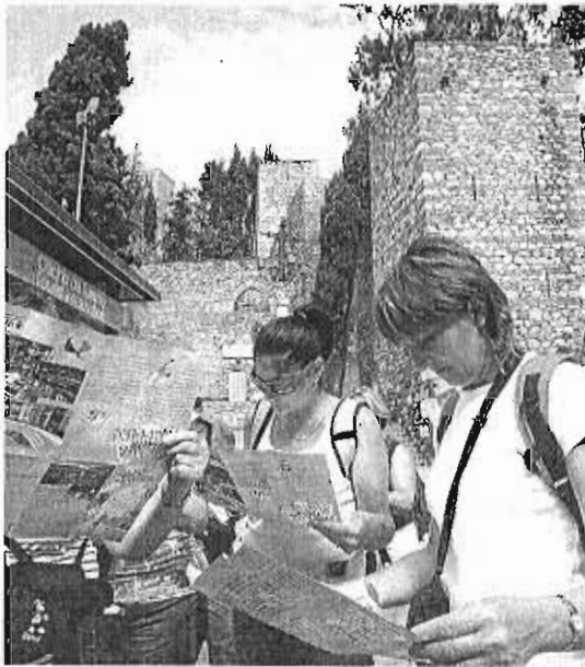
Turistas consultan un mapa a la entrada a la Alcazaba.

«También realizará visitas guiadas (con un precio simbólico de un euro) el Jardín Botánico-Histórico de La Concepción, que se realizarán en diferentes idiomas durante todo el día