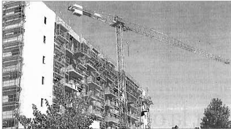
Un edificio de viviendas en construcción en Málaga.

El Observatorio, dependiente del Ayuntamiento de Málaga, advierte en todo caso de que la mayor parte de las familias malagueñas, con su situación económica actual, «no tiene, ni aproximadamente, los recursos necesarios