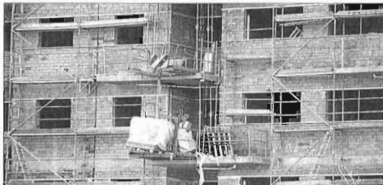
Obras de un edificio de viviendas en Málaga. ARCHIEGA

El nuevo repunte del mercado en este ejercicio mantiene las características de los últimos tres años. Por un lado, las viviendas de segunda mano son las que acaparan el mercado, concentrando el 93% de las operaciones. Ello obedece a que la oferta de vivienda nueva sigue siendo aún muy escasa, a espera de terminar de dar salida al stock inmobiliario y a que se vayan incorporando las nuevas promociones ya en construcción o en proyecto. La