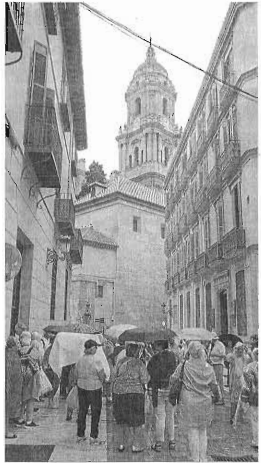
Turistas se refugian de la lluvia en el centro de Málaga, ayer.

A su término, las actividades pasaron al Balcón de Europa donde tuvo lugar el pasacalles Vaso Largo y la apertura de los expositores donde se podían adquirir productos gastronómicos y artesanos. En este popular enclave se homenajeó también a los camareros de la localidad porque "su trabajo es esencial para que los visitantes se vayan con un buen recuerdo y sientan la necesidad de volver", a la Asociación de Empresarios Hosteleros de la Costa (Aehcos) por su 40 aniversario y a Canal Sur Televisión por su labor en la promoción turística del municipio.