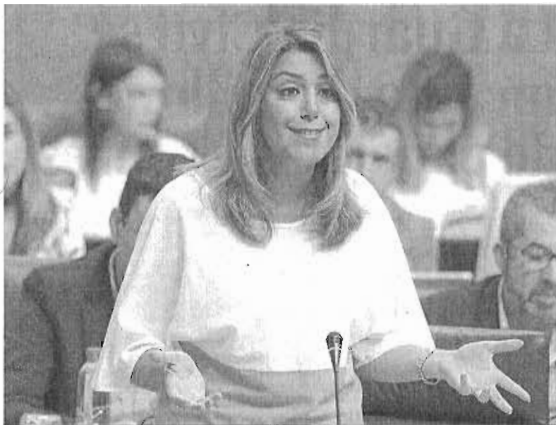
Susana Díaz, durante una de sus intervenciones en la sesión de ayer en la Cámara.

Susana Díaz había intervenido en la sesión de control, que se celebró por la mañana, en ese mismo sentido: la de un apoyo al Estado para impedir el referéndum, a la vez que abogaba por buscar soluciones políticas, pero sólo después del domingo 1 de octubre. "Hoy -indicó la presidenta-, el primer reto es restablecer la ley antes del 1 de octubre, y restablecida la ley habrá momentos para las propuestas, de integración y de igualdad. Vamos a estar al lado del Estado de Derecho, después estaremos en la solución" "El mayor daño que