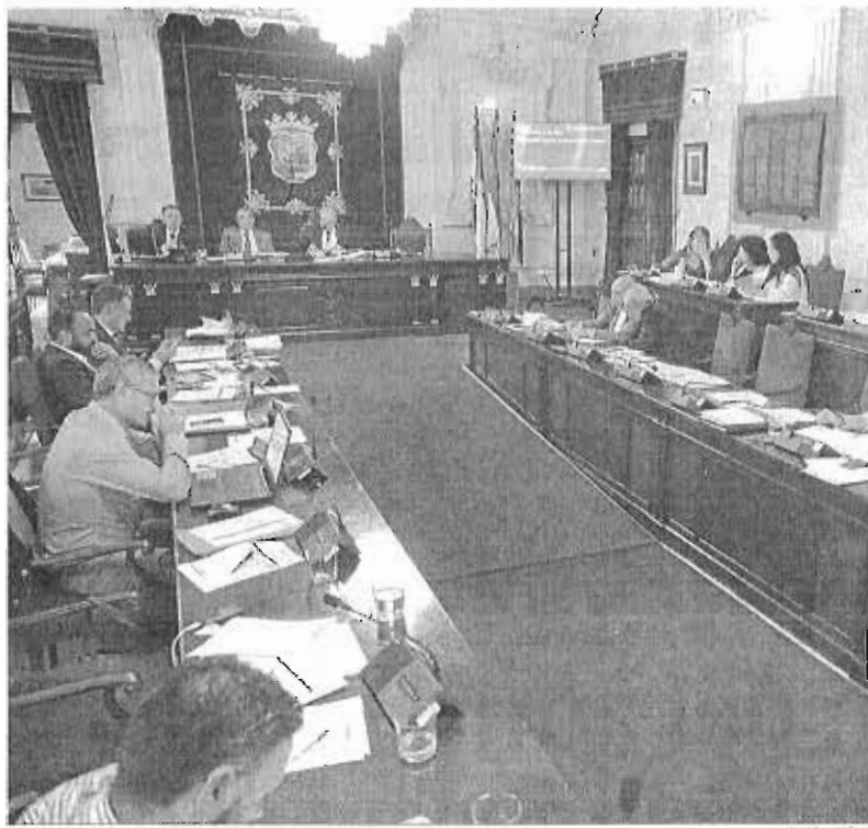
Imagen del Pleno municipal celebrado ayer.

El revés se ve compensado con la aceptación por parte de todo el Pleno del punto primero de la moción urgente presentada por el PP, en la que se demandaba la colaboración económica de la Administración regional. Incluso, se precisa un reparto de obligaciones económicas, de manera que sería la Junta la que, vía fondos Feder del programa operativo de crecimiento sostenible 2014-2020, deberá afrontar el pago de las actuaciones de saneamiento, valoradas en 72 millones, mientras que el Ayuntamiento y Emasa asumirán las