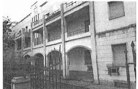
El antiguo edificio del Gobierno Militar data de los años 50.

El primero en hacerlo fue el Colegio Oficial de Farmacéuticos, que mantuvo contactos con el Estado con la intención de instalar su nueva sede en este inmueble que lleva dos décadas cerrado a cal y canto pese a su privilegiada ubicación, junto a los muelles 1 y 2 del puerto. Más recientemente ha sido el Ayuntamiento el que también ha mostrado interés. De hecho, el propio alcalde, Francisco de la Torre, visitó a finales de agosto el inmueble junto a los responsables de patrimonio y proyectos de la Gerencia Municipal de Ur-