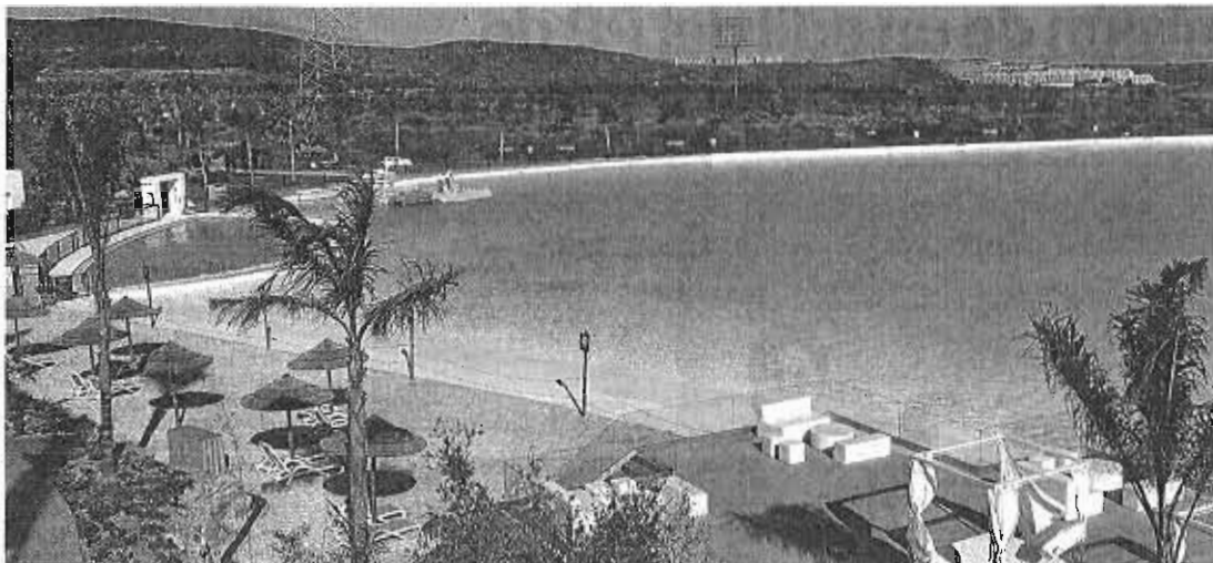
La urbanización Alcazaba Lagoon, en Casares, que será presentada hoy.