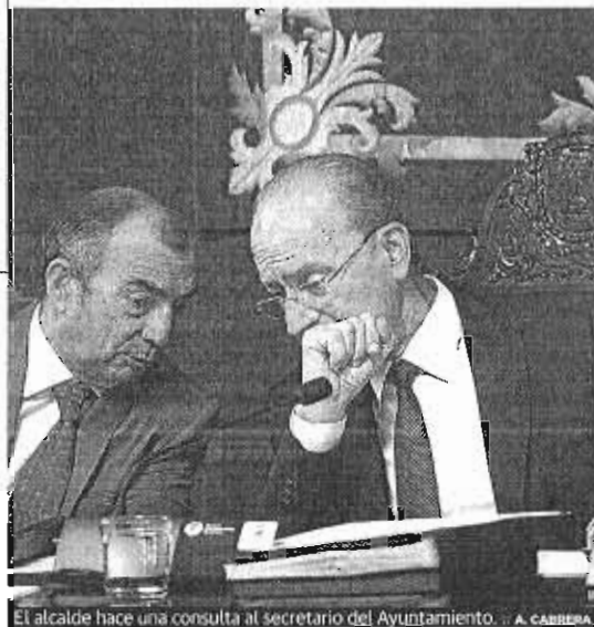
El alcalde hace una consulta al secretario del Ayuntamiento.