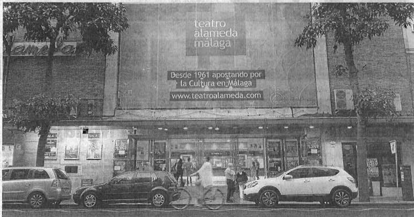
El teatro Alameda, en la céntrica calle Córdoba, será remozado para acoger el proyecto teatral del actor y director malagueño.