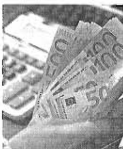
Billetes de euros de varias cantidades.

mo acentuar la inversión en nuevas tecnologías. Reconoció que se han atravesado "momentos complicados" y confirmó que la "incertidumbre" sigue "presente y condiciona la toma de decisiones". Pero, a pesar de todo, dijo que "la economía crece de manera saludable", hay "buenas condiciones de financiación" y, tras la última crisis, "las empresas españolas están saneadas" y con "un alto volumen de liquidez".