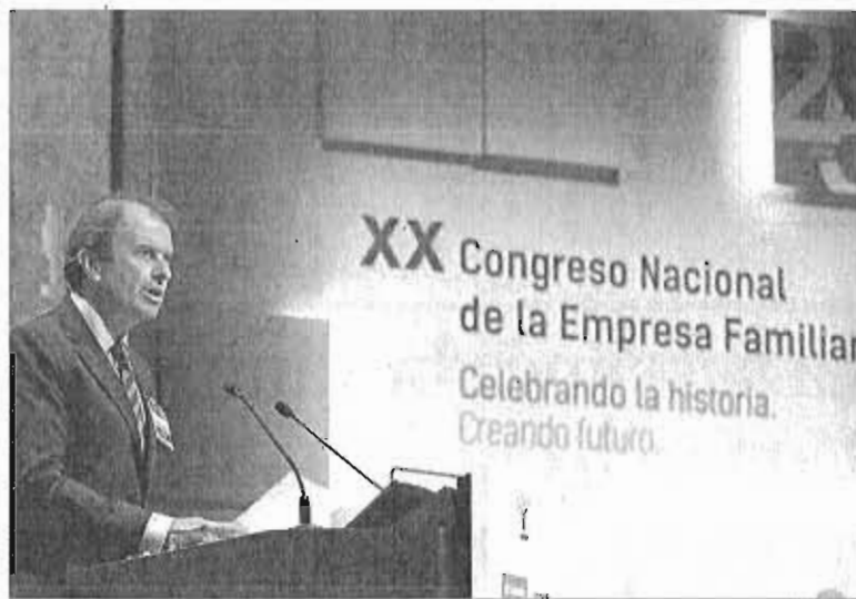
Ignacio Osborne, presidente del Instituto de Empresa Familiar, durante su discurso, ayer, en Toledo.

Esa mejora de resultado espera tener un efecto directo sobre el empleo. El 52% de las empresas declaró en la encuesta que, de acuerdo a sus previsiones para 2018, esperan incrementar plantilla el 52%, frente al 48% de 2016, el 38% la mantendrá (44% hace un año) y el 10% prevé reducirla (un 2% más respecto a la encuesta hecha en Coruña. Para los próximos tres años, el aumento de plantillas crece al 68% (63%), el mantenimiento baja al 25% (30%) y las reducciones siguen en el 7% de 2016.