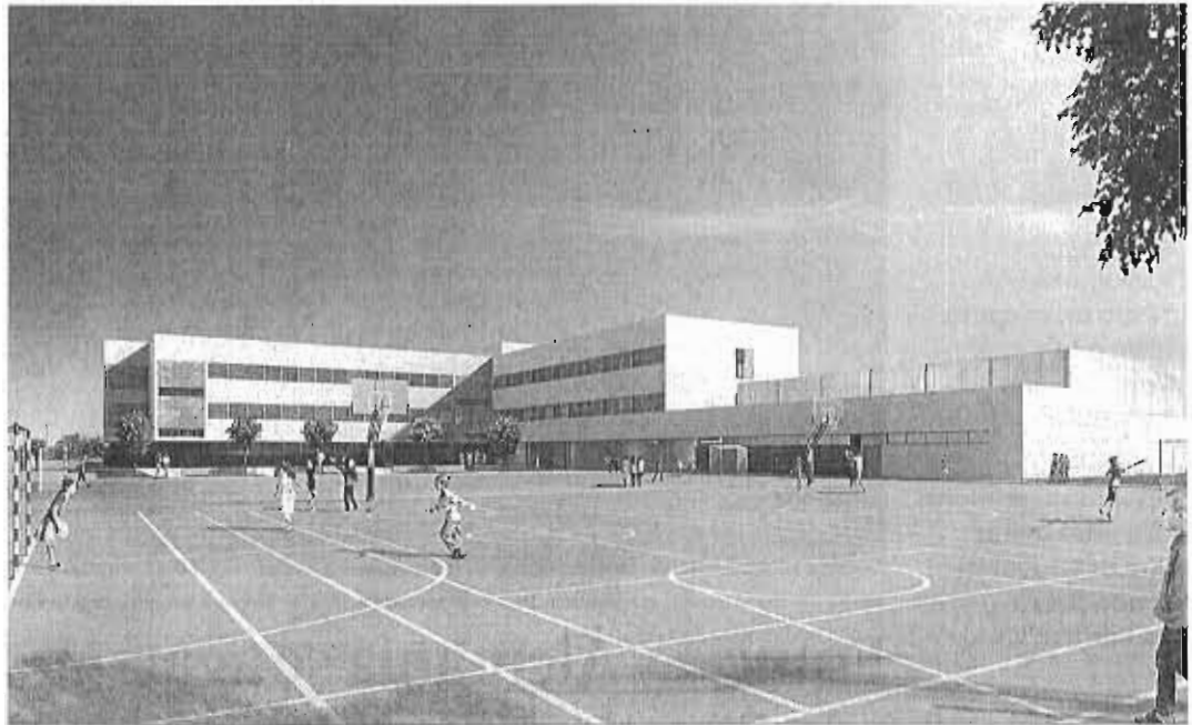
Diseño del nuevo IES de Teatinos.

La obra se adjudica por casi 4,7 millones, frente a los casi 6,3 millones de la licitación