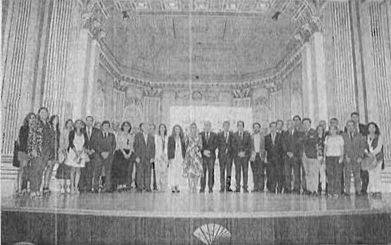
Representantes de Unicaja e instituciones relacionadas con Edufinet posan tras la rueda de prensa.