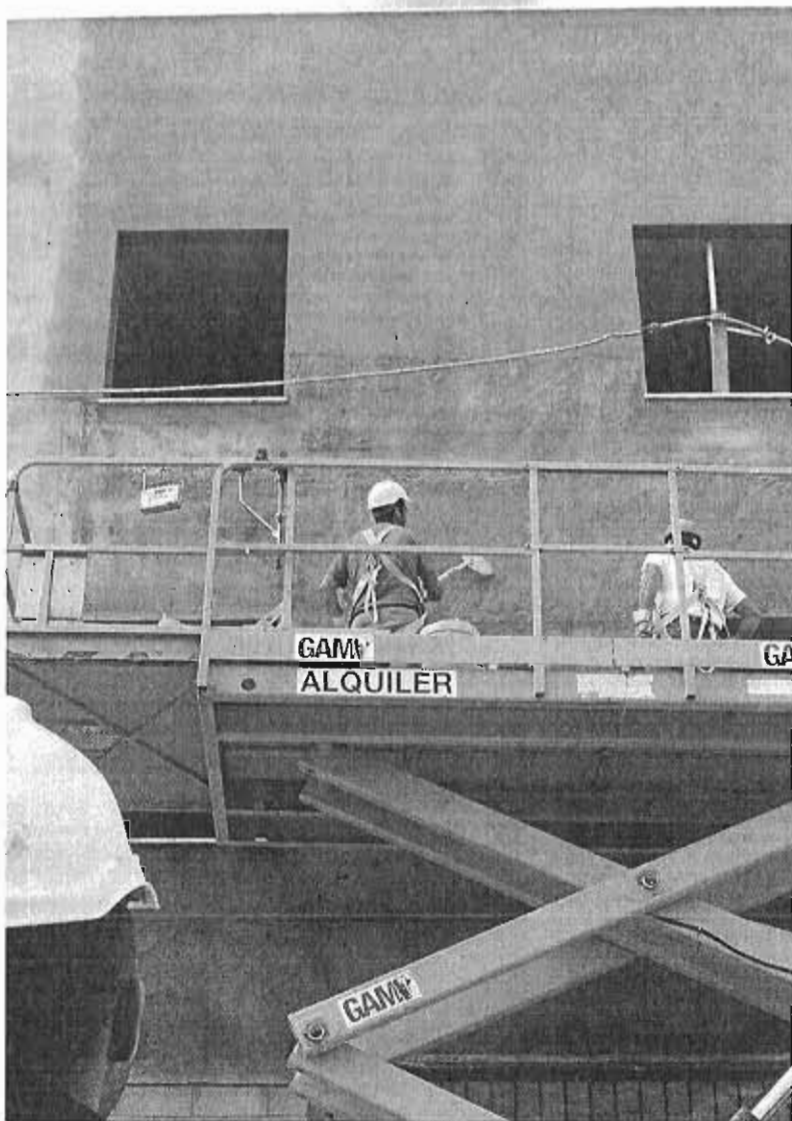
Varios obreros trabajan en la obra de un edificio.

La construcción, como el resto de sectores, vive de la demanda y la oferta, aunque el periodo medio de maduración de los productos es distinto. Construir una urbanización de viviendas, desde que se obtienen las licencias hasta que se entregan las llaves, puede durar dos años y buena parte corresponde a la obra pura y dura. Las perspectivas a futuro son positivas ya que, según el Ministerio de Fomento, la compraventa de viviendas se ha disparado un 19% en el primer semestre de este año en Málaga, hasta las 16.555 unidades, y entre enero y junio se visaron 2.442 viviendas, el doble que en el mismo periodo del año anterior. No obstante, la obra civil, que también mueve grandes bolsas de empleo, sigue prácticamente parada en la provincia hasta el punto que en los seis primeros meses se licitaron obras por solo 149 millones.