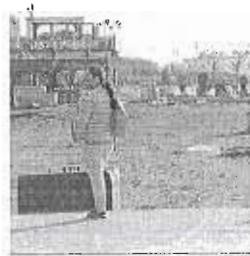
Parte del paseo a ejecutar.

por la Administración central. La intervención afectará a una superficie de 4.120 metros cuadrados. El proyecto consiste en la ejecución del tramo de paseo marítimo comprendido entre el anterior, ya construido, y el existente en la zona del espigón de la terminal, con 90 metros de largo y una anchura máxima de 53 metros en la parte