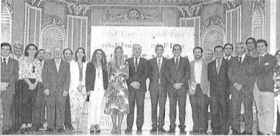
Los responsables de Edufinet, en el centro, junto a responsables de otras entidades colaboradoras

El proyecto Edufinet de Unicaja, pionero a nivel nacional, cumple diez años enseñando a jóvenes (y no tanto) a moverse por el proceloso mundo de la economía y las finanzas