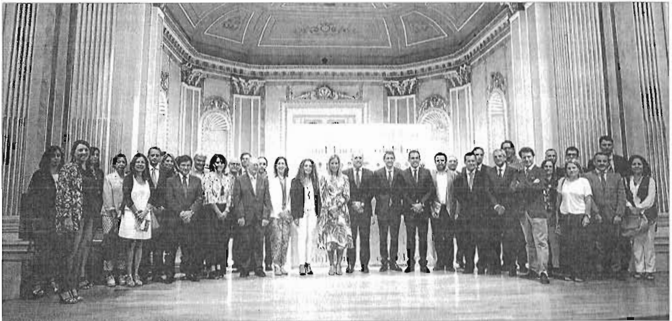
Representantes y colaboradores del Proyecto Edufinet en la conmemoración del X aniversario de la creación del proyecto. MÁLAGA