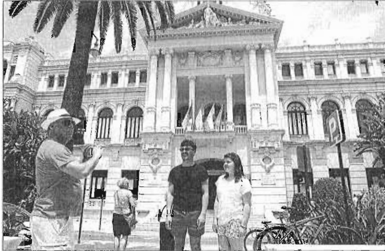
Imagen del Ayuntamiento de la capital. ARCA/NEGA

El 29 de mayo de 2017, el consorcio interpuso un recurso contra el requerimiento de pago que había efectuado el Ayuntamiento a la Diputación, pero el 19 de julio de este ejercicio la institución local desestimó las alegaciones del consorcio, por lo que se acordó en el Consejo de Administración interponer «un recurso Contencioso-