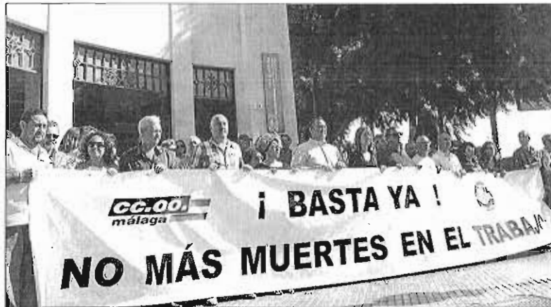
La concentración de los sindicatos CCOO y UGT, ayer en Málaga.

El incremento de este año 2017 da continuidad a una tendencia al alza iniciada en 2012, uno de los años más duros de la crisis y en el que precisamente el Gobierno aprobó su controvertido texto. Si en aquel ejercicio la cifra de siniestros fue de 14.417, el volumen ha ido subiendo año a año hasta alcanzar los 18.732 a cierre de 2016. Las cifras sí están todavía bastante por debajo de los 36.380 de 2007, el último de bonanza antes del estallido de la crisis.