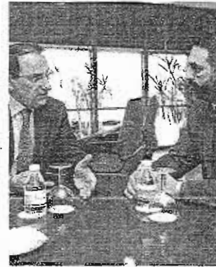
Reunión de ayer.