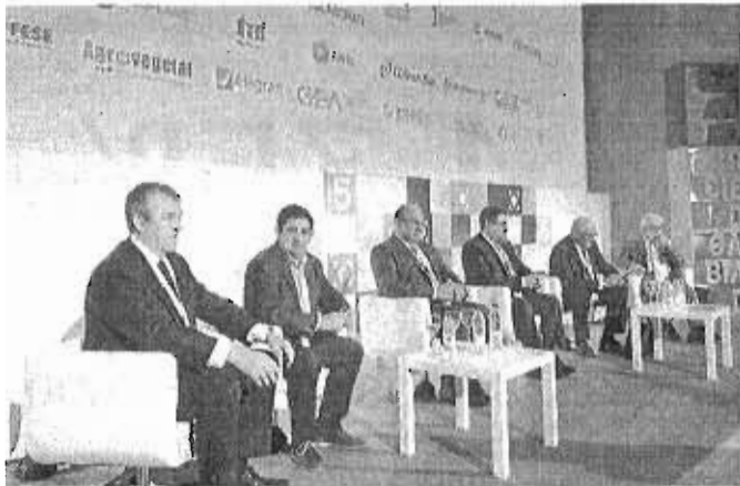
Inauguración del V Congreso de Cooperativas Agroalimentarias de Andalucía, ayer, en Jaén.

Leal defendió a las cooperativas como "motor del desarrollo rural" y herramientas fundamentales para mantener la población en el entorno rural, unas cuestiones que, junto las puramente económicas, también se analiza en