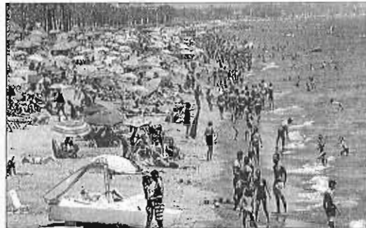
Una playa de Torremolinos en temporada alta.

La subvención se convoca en régimen de concurrencia no competitiva y podrá alcanzar hasta el cien por cien del importe de los