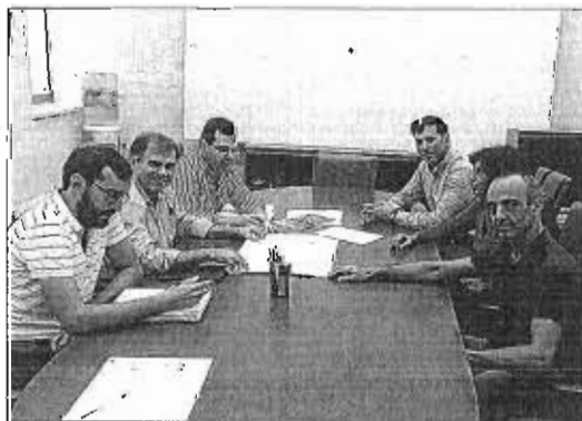
Detalle de la reunión con los comerciantes.

misma semana se ha implantado un paso de peatones permanente en Puerta del Mar, de manera que se mejorará a partir de mañana la permeabilidad en esta zona, conectando de forma segura ambos márgenes de la Alameda.