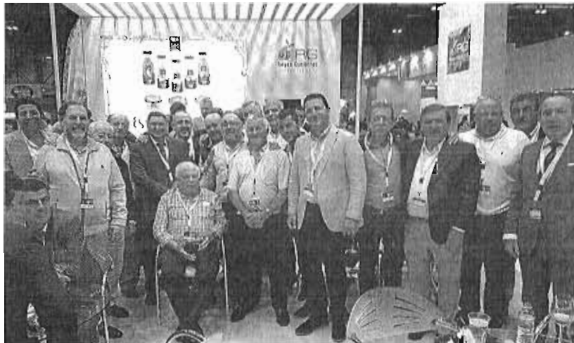
Productores de frutas y hortalizas de Málaga, ayer en el expositor de Frutas Reyes Gutiérrez, una de las 18 empresas de la provincia presentes en Fruit Attraction.

La petición de Trops fue cursada por el gerente de la firma, Enrique Colilles, que recordó a la presidenta andaluza que Málaga produce el 70% de las frutas subtropicales de Andalu-