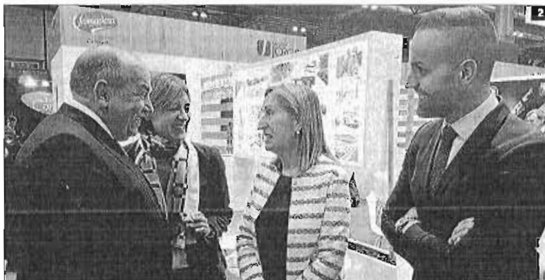
► FRUIT ATTRACTION abrió ayer sus puertas en Madrid. 1 El alcalde de Vélez Málaga, Antonio Moreno Ferrer, visitó el stand de Frutas Montosa. 2 La ministra de Agricultura y Pesca, Isabel García Tejerina, y la presidenta del Congreso, Ana Pastor, con Federico y Guillermo Beltrán, responsables de Famadesa. 3 r. e.

El sector hortofrutícola español cerró el pasado año con 14.000 millones facturados en exportaciones. De ese montante, sólo en aguacates y mangos la comarca malagueña más oriental aportó más de 250. Las exportaciones españolas crecen un ritmo del 6%, pero el subtropical avanza más rápido, con un 25% anual.