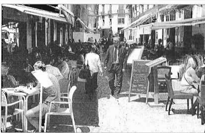
Bares y terrazas en el centro de Málaga.