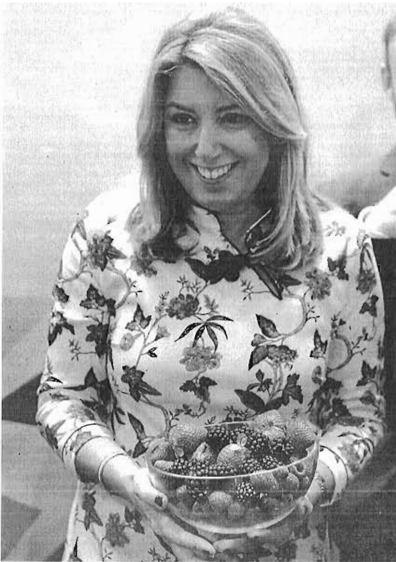
Susana Díaz, ayer en Madrid en la inauguración de la novena edición de Fruit Attraction.

No obstante, ayer en la sesión de control parlamentario del Congreso, y a una pregunta del PNV sobre la fijación del cupo vasco, Montoro aseguró que la reforma del sistema de financiación autonómica estará «ya», es decir dentro del plazo, y aprovechó para pedir el respaldo de otras fuerzas políticas, sobre todo