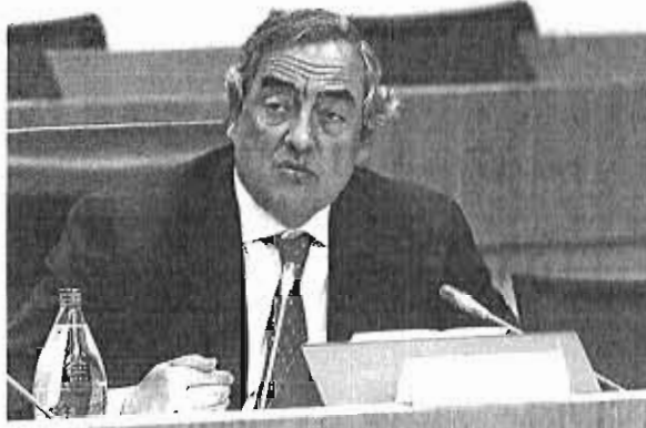
Juan Rosell, presidente de la patronal

La Autoridad Fiscal, en todo caso, avisa de que aún no le consta impacto alguno, por lo que la situación puede revertirse si el problema político se resuelve. Tras meses de pulso político, la tensión independentista ahora late en la economía.