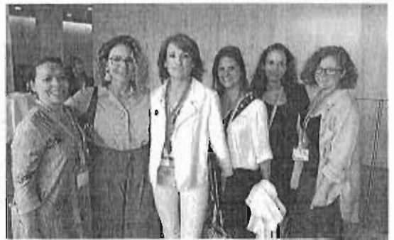
Nuevas incorporaciones de Amupema.