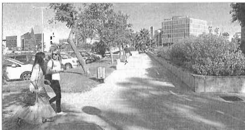
Trabajadores en el Parque Tecnológico de Andalucía (PTA), en Málaga.

«Tenemos una marca consolidada y estamos configurando un entorno cada vez más internacional, lo que nos permite competir con otras ubicaciones de referencia de Europa. Los datos de los últimos tres años indican una tendencia al alza en la llegada de empresas extranjeras, con 24 sociedades», apuntó. Estos datos demuestran, a su juicio, «la visibilidad internacional que el PTA ha alcanzado, siendo a día de hoy una de las mayores concentraciones de tecnología e innovación de España, así como el líder claro en la atracción de la inversión extranjera en I+D+i en Andalucía».