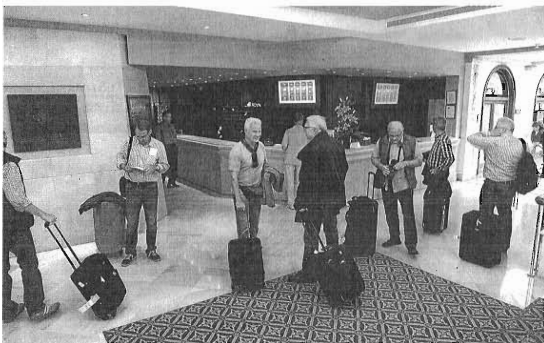
Turistas esperan, junto a la recepción de un hotel, para registrarse.