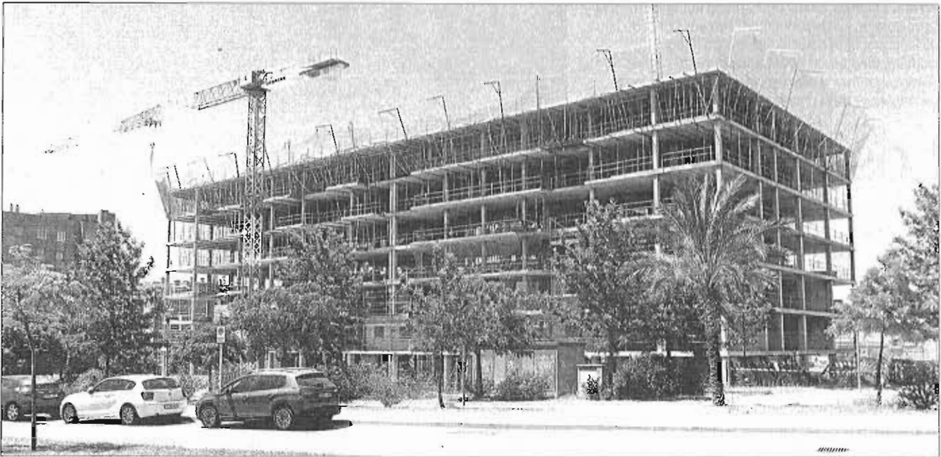
La construcción fue uno de los sectores más castigados durante la crisis. ARCHIEGA