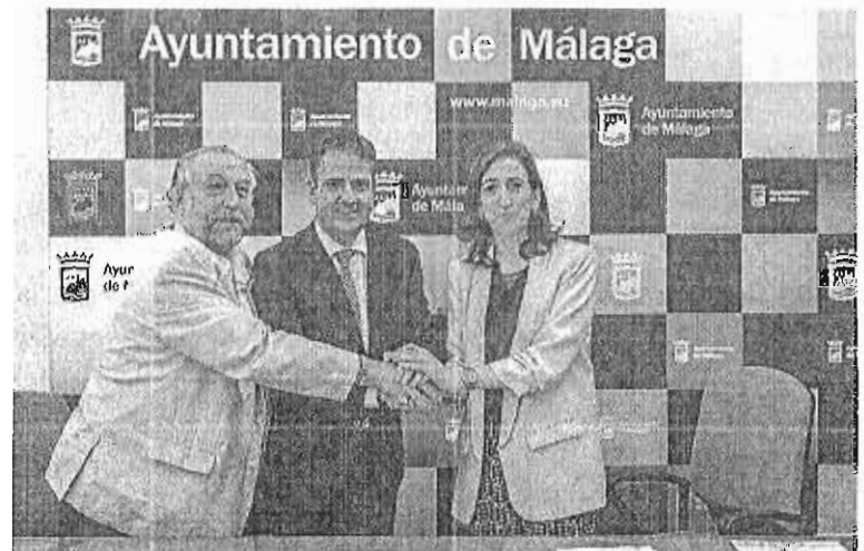
Un momento de la firma del acuerdo en el Ayuntamiento.

Este pacto se plantea «como un nuevo contrato social que hace referencia a la necesidad de desarrollar un nuevo acuerdo entre mujeres y hombres, basado en la corresponsabilidad, que nos permita conciliar y compartir el trabajo asalariado, las responsabilidades familiares y el cuidado a las personas dependientes, el poder y la toma de decisiones: en definitiva, compartir la vida», indicaron.