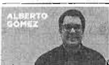
En Twitter: @Agatmenóres

El empleo temporal continúa ganando terreno a los contratos indefinidos, una tendencia que se constata sobre todo en zonas turísticas, cuya actividad está enfocada al sector servicios, como la Costa del Sol. En la provincia de Málaga se firmaron 62.390 contratos temporales en septiembre, un cuatro por ciento más que en el mismo mes