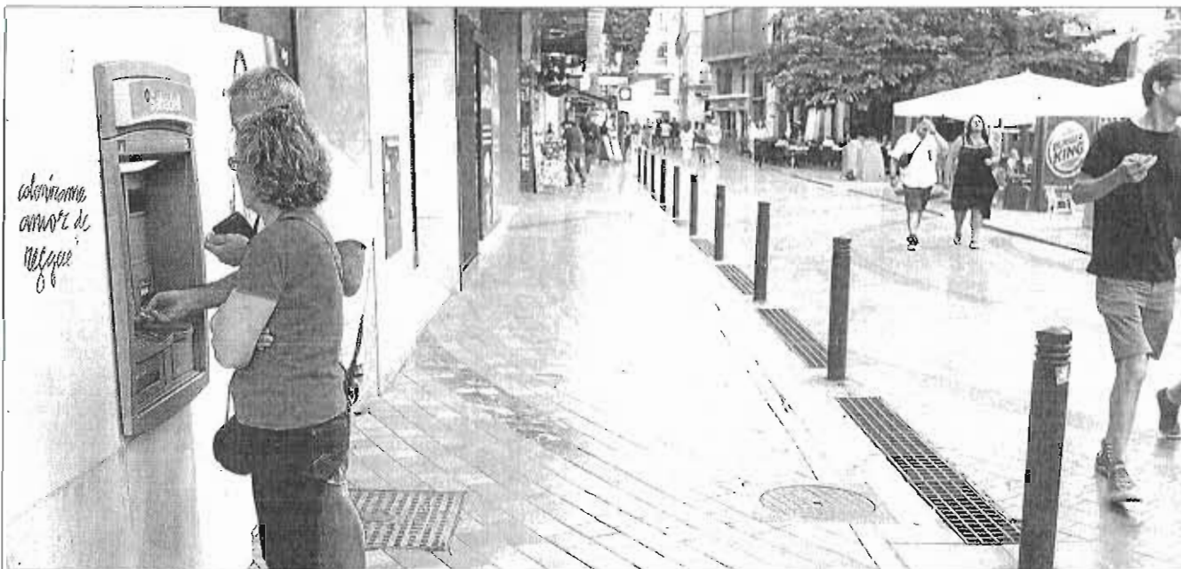
Unos clientes sacan dinero de una sucursal bancaria en Málaga.