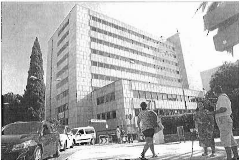
El nuevo hospital estará a espaldas del Materno Infantil. ARCNIEGA

Tras consensuar que el terreno actual en el que está el edificio de La Noria es más amplio que los aparcamientos del Hospital Civil -espacio que también se ha barajado para su construcción-, el siguiente paso es abordar el número de quirófanos, los aparatos de alta tecnología, la inclusión de PET y el desarrollo funcional que tendrá el centro hospitalario. Un encuentro previsto para 90 minutos que se alargó tres horas y en el que estuvieron representantes de las facultades de Medicina y Ciencias de la Salud, Urbanismo, miembros del equipo que non-