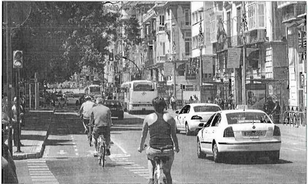
Imagen de la Alameda Principal, actualmente tomada por las obras del metro.

En el ámbito de oficinas, apuntó que la ciudad «necesita un parque de este tipo de edificios, sobre todo en el Centro de la ciudad, es un mercado que está dando una rentabilidad muy elevada». La tendencia de las grandes empresas ex-