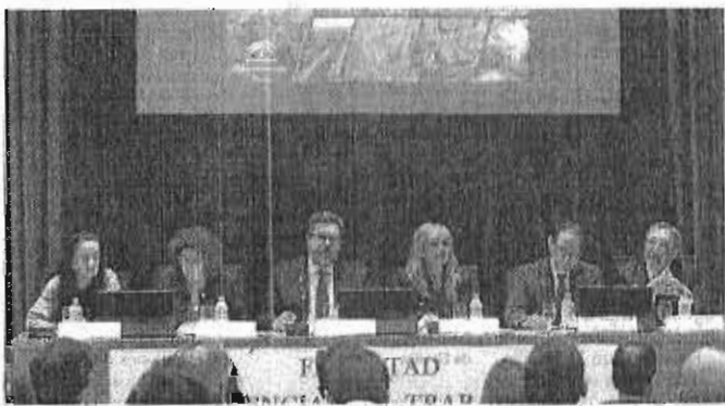
Representantes de la Junta de Andalucía, CCOO-A y UGT-A, ayer, en la jornada celebrada en Sevilla.

La precariedad en el empleo sigue siendo el gran talón