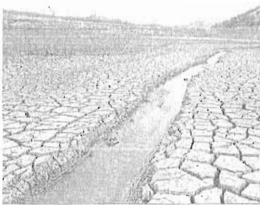
Estado actual del pantano del Guadalteba.

Las lluvias tampoco han sido significativas en octubre, mes en el que suele caer la mitad de agua que en los dos últimos meses del año, con un registro histórico que no supera los 57 litros por metro cuadrado. Los aguaceros de mediados de ese mes dejaron una cantidad similar de agua en dos días a la que se recoge en todo octubre. Llovió, además, de forma generalizada en toda la provincia, con lo que el aporte a los pantanos fue importante, aunque insufi-