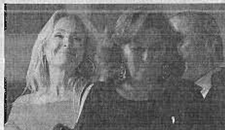
Esther Alcocer Koplowitz.