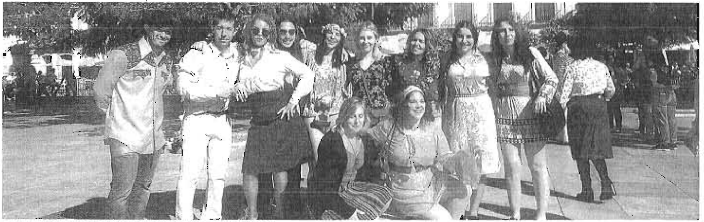
Los figurantes del cortometraje 'Memories', en la plaza de la Merced.