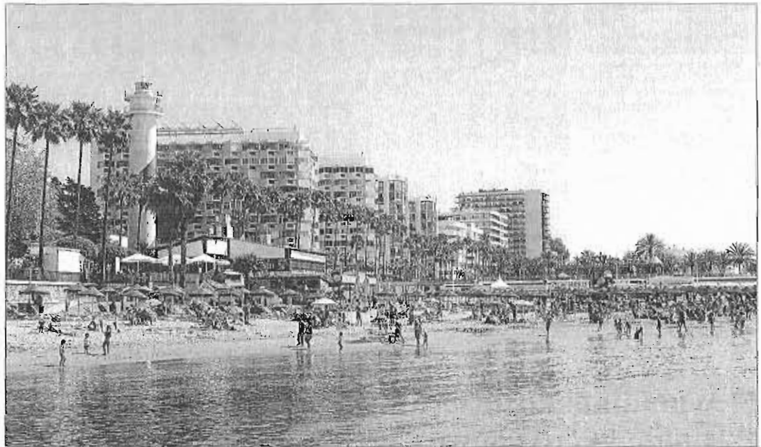
Marbella y los municipios colindantes sigue siendo uno de los puntos con mayor demanda. Lo