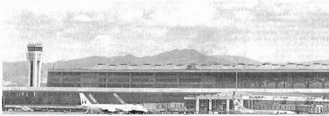
Un avión de Ryanair despegando del aeropuerto malagueño.