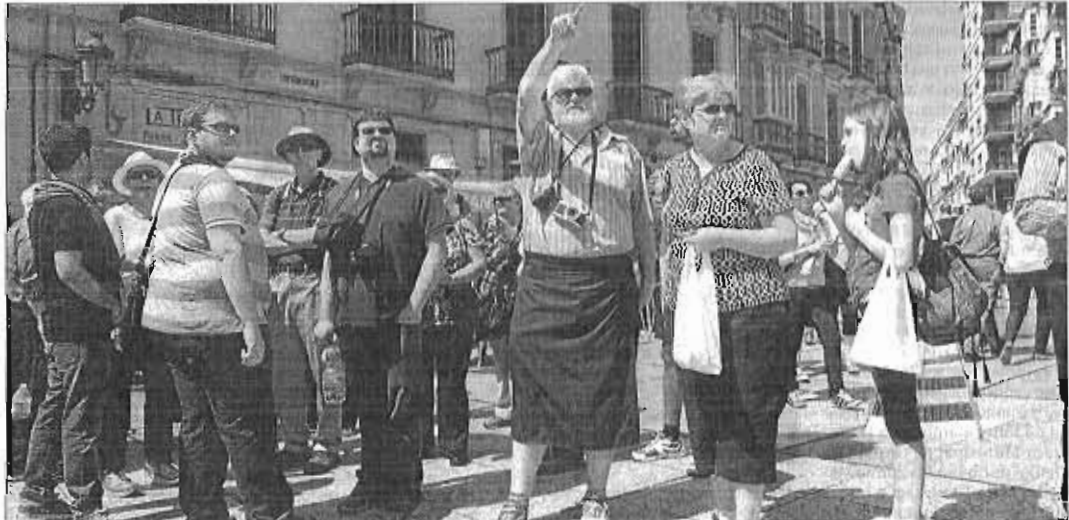
Turistas por el Centro Histórico de la capital malagueña. ARKIMEGA

Y en lo que respecta al balance de este año, con datos del Instituto Nacional de Estadística hasta sep-