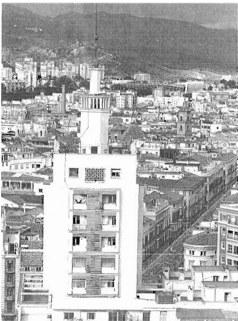
El edificio de La Equitativa es seña de identidad del paisaje urbano del Centro.

En España, posee hoteles en Madrid, Sevilla, Palma de Mallorca, Córdoba, Murcia y Trujillo (Cáceres), cuatro de ellos explotados por la cadena NH. También gestiona edificios de viviendas en condominio, y de oficinas como el situado en el número 43 de la calle Principe de Vergara en Madrid, donde Key Continental ha establecido su sede.