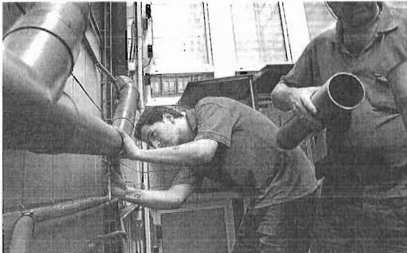
Actualmente, los autónomos representan un 19% del total de trabajadores de la provincia. :: SUR