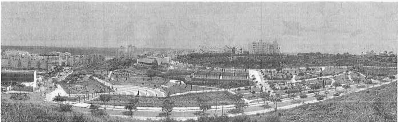
Una promoción de viviendas nuevas que se desarrolla en Estepona.

El caso de Málaga es significativo porque es, junto a Alicante, la provincia española en la que se venden más inmuebles a extranjeros no residentes. Por eso es Málaga cuarta a escala global por encima de otras provincias que tienen más población como Sevilla o Valencia. En este sentido, Málaga acapara un tercio de todas las viviendas vendidas en Andalucía, su-