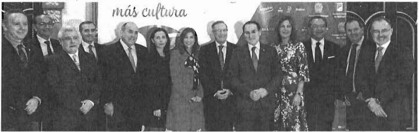
Los patronos de la Fundación de Málaga, acompañados por representantes institucionales.