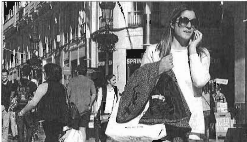
La Navidad supone uno de los momentos clave para el sector del comercio. ARCHINEGA

Volviendo a los datos de Adecco, el cálculo en toda España indica que se harán más de un millón