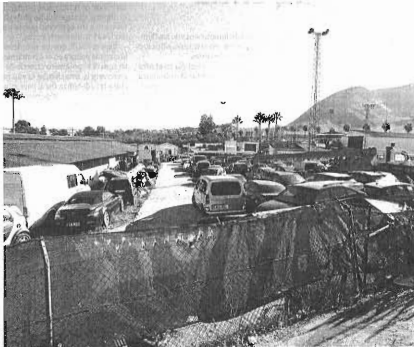
Depósito judicial de Cártama, uno de los dos que existen en la provincia.