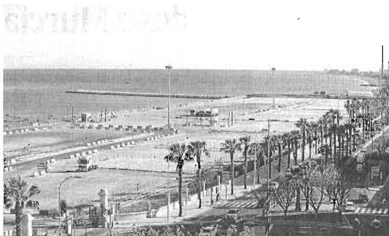
Vista de la plataforma de San Andrés, donde se dibuja el Auditorio.