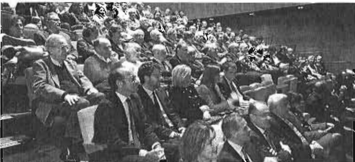
Patio de butacas del Teatro Echegaray, durante la gala.