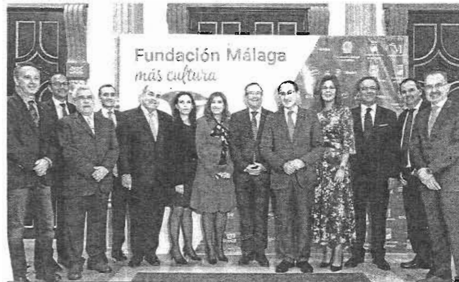
Patronos de la Fundación Málaga, ayer, en el Teatro Echegaray.