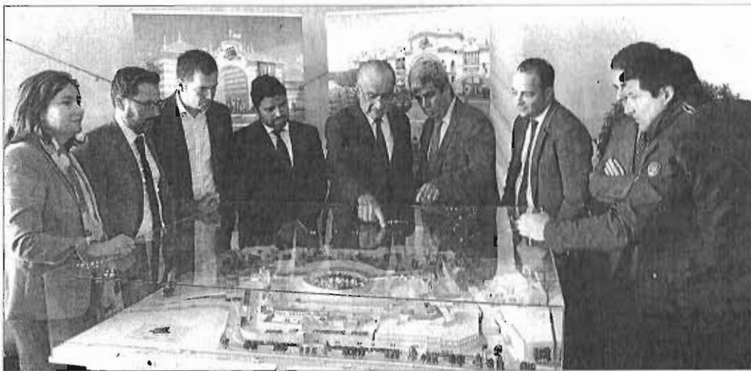
Empresarios y autoridades contemplan la maqueta del futuro centro comercial. ARCHIEGA