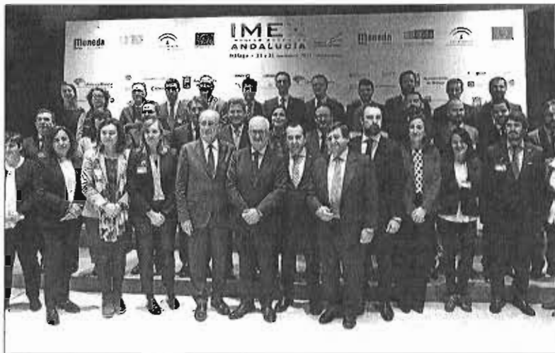
Una imagen de la clausura de la feria de negocio IMEX ayer.

Según indicó, esto ha permitido a Andalucía superar por primera vez los 22.700 millones de euros en exportaciones —que es la primera vez que pasa en los nueve primeros meses de un año— y lograr un récord en el superávit comercial de 1.474 millones de euros. De igual modo, subrayó el «valor estratégico» de la internacionalización de la economía durante la crisis económica «ya que