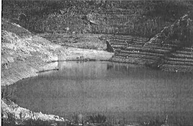
Vista general del embalse de La Viñuela.