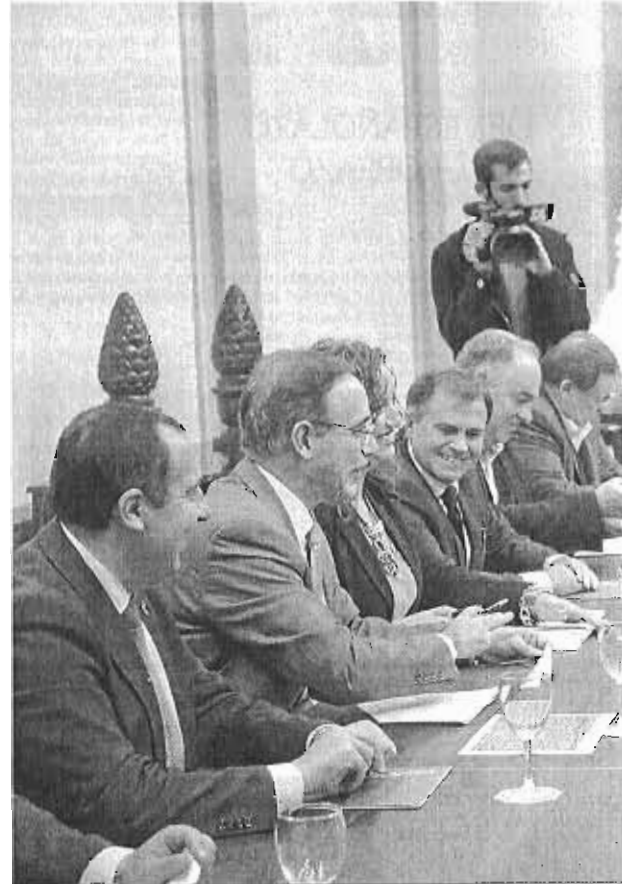
Imagen de la última reunión de la comisión del Metro.

quier caso, abundó en lo que viene afirmando desde hace meses, señalando la necesidad de respetar la opinión de los vecinos de la zona y subrayó la importancia de "no crear problemas que afectaría gravemente al transporte público existente en el zona, la EMT". De acuerdo con las propias estimaciones de la sociedad municipal, la construcción del Metro en superficie tocaría de lleno a las líneas de autobuses que pasan por la zona, incluyendo la 15, que se vería mermada en unos 1,5 millones de usuarios.