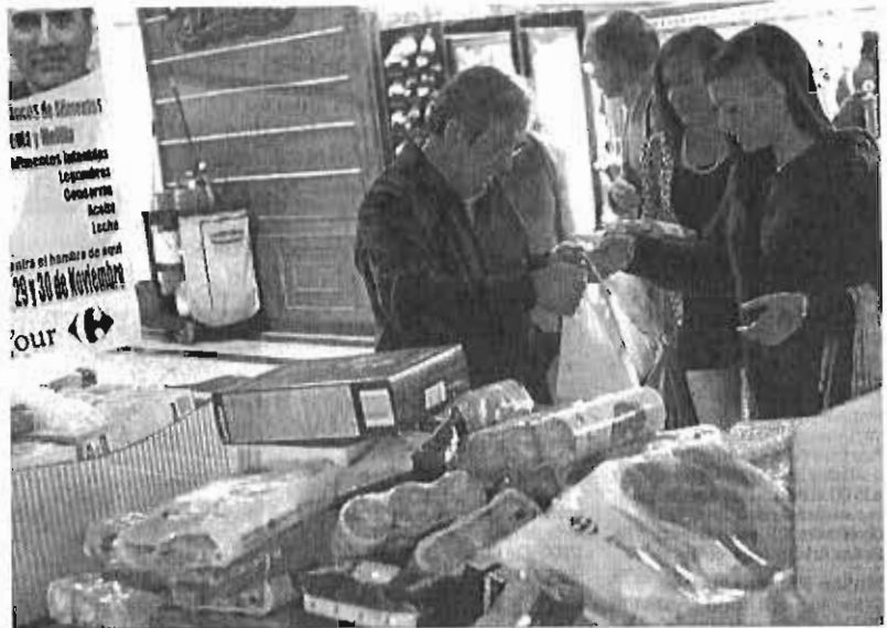
La Gran Recogida, en una edición anterior.

Una vez más, Bancosol, que coordina el dispositivo en la provincia de Málaga junto con la Federación de Bancos de Alimentos de Andalucía, Ceuta y