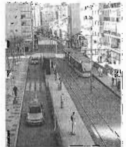
Infografía de Metro al Civil.

cómo tendrá lugar. El paso es indispensable para que Fomento vaya adelante con la aspiración de licitar la construcción del ramal, valorado en unos 41 millones de euros. Una vez el Consejo de Gobierno andaluz ratifique el trámite final, que vendrá a sumarse a la declaración de interés metropolitano del ramal, se dará respuesta al Ayuntamiento, que meses atrás vino a señalar que esta actuación chocaba con el planeamiento de la ciudad.