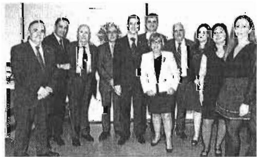
Representantes del Colegio, durante la gala.

Mucho tiene que ver en ello el gran trabajo que se realiza durante el año en colaboración con la Universidad, concretamente con el Grado de Comercio y Gestión. Por otro lado, se realizaba un ho-