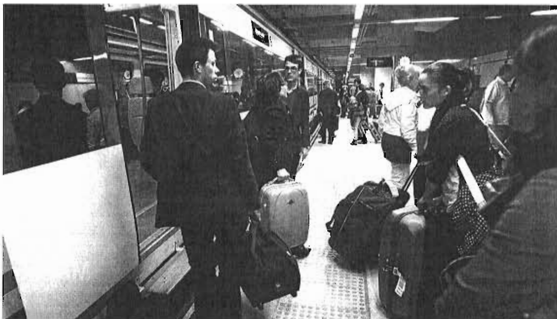
Viajeros suben a un tren de la línea de Cercanías de la Costa, en Málaga.

Para el alcalde, la saturación actual del Cercanías no es negativo, sino todo lo contrario, ya que «puede servir como elemento de impulso a la hora de abordar futuras actuaciones». Así, fue contundente al reclamar que la llegada del tren a Marbella no debería lograrse por la extensión de las vías actuales, sino con otra línea alternativa y de mayor capacidad. De la Torre reiteró que la alternativa debería pasar por «plan-