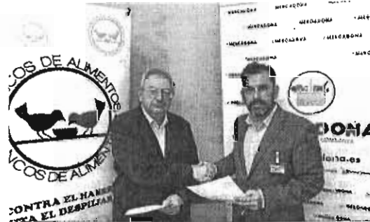
Firma del acuerdo entre Bancosol y Mercadona.

Melilla, fomenta la solidaridad ciudadana con las personas más necesitadas, las que tienen dificultades para acceder a los alimentos más básicos y carecen de los recursos más elementales.