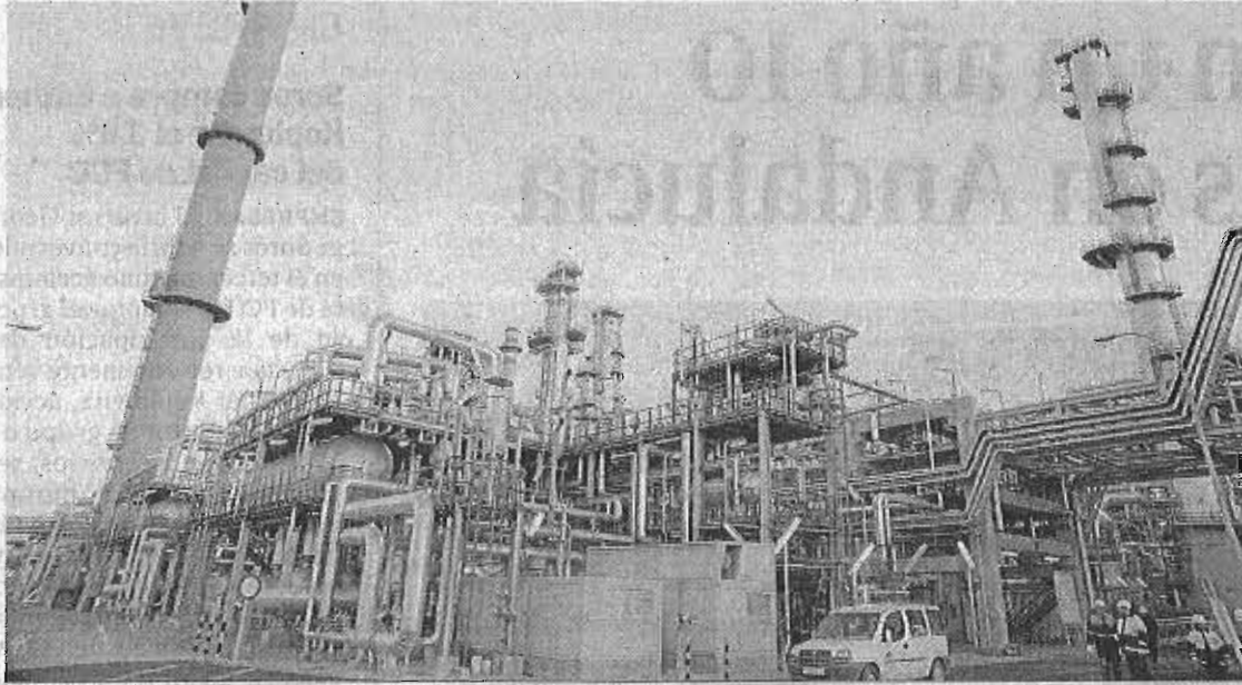
Refinería La Rábida de Cepsa en Huelva, uno de los motores de la industria andaluza.