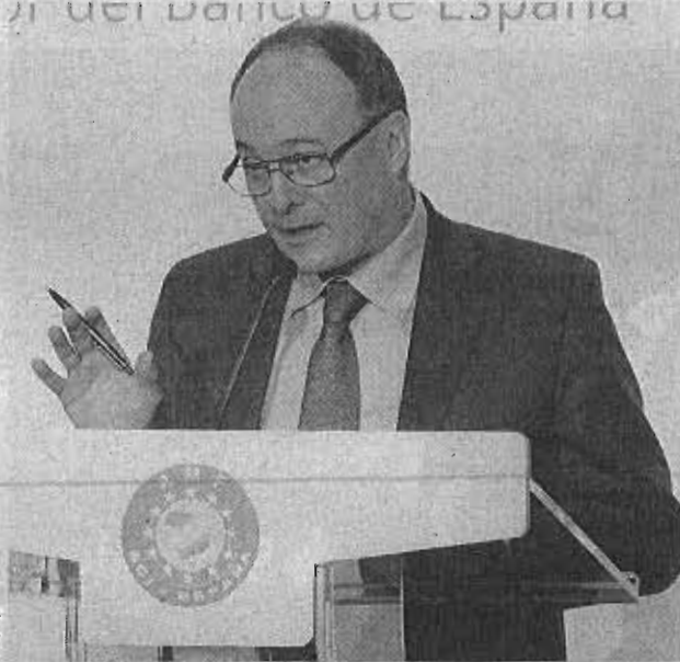
Luis María Linde, gobernador del Banco de España.

Dentro del sector, Santander considera que en la medida en que se despejen las dudas sobre el sector financiero europeo, mejoren sus expectativas y se asiente el nuevo marco regulatorio, la banca acompañará la recuperación de la economía real con más crédito. Fuentes de la entidad han explicado que el banco ya está haciendo todo lo posible para crecer en financiación, y aunque ha caído el saldo total de crédito, están aumentando las nuevas operaciones. Aunque