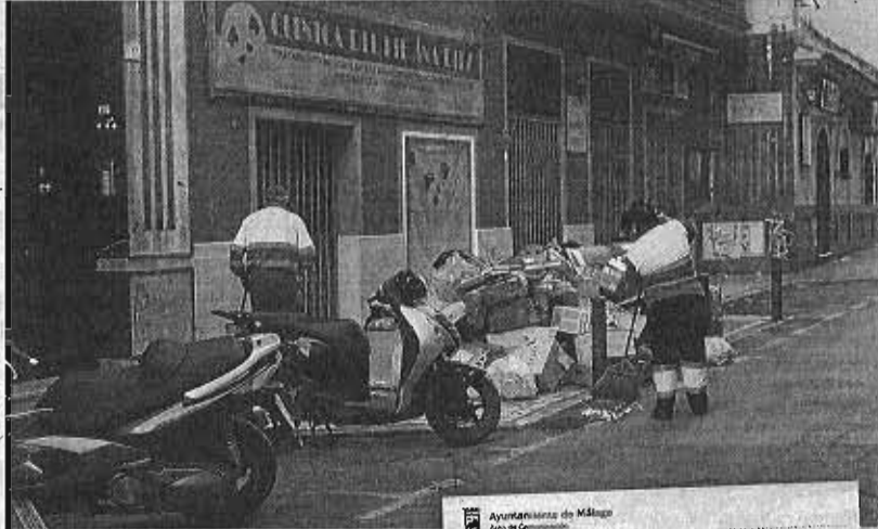
Empleados de Limasa recogen desechos acumulados en el Centro.

Técnicamente, esto último si que se está cumpliendo, ya que los fijos cobrarán como cualquier jornada laboral sin horas extras (se pagan entre 8,33 y 9,41 euros en función de la categoría profesional). Además, también ha habido contrataciones temporales para acelerar la retirada de los residuos amontonados durante los