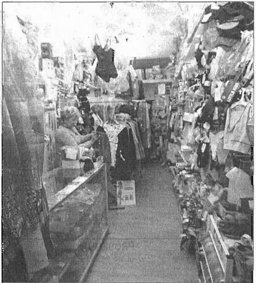
El principal problema de las pymes es la falta de crédito. E. SENRA

Tampoco parece que vaya a surtir efecto una de las medidas estrella del Ejecutivo, el nuevo Criterio de Caja que debería solucionar la situación por la que las pymes viven financiando a la Hacienda Pública, pero que en la práctica "suma complicaciones", según voces del sector. Ha sido una de las reivindicaciones más demandadas de los últimos años tanto de pymes como de autónomos. Finalmente, el Gobierno ha atendido estas peticiones