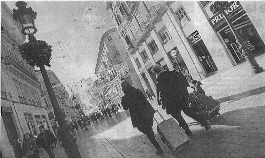
Turistas enfilan, con sus maletas, la calle más comercial de la capital malagueña.