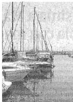
Puerto deportivo de Caleta.

Para evitar este sobredimensionamiento, Fomento circunscribe las nuevas actuaciones de creación de atraques deportivos a proyectos justificados por existir de-