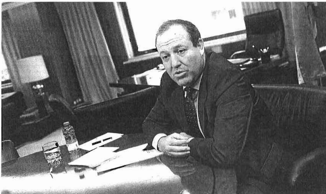
El presidente de Cepyme, Jesús Terciado, en su despacho. :: ÁNGEL NAVARRETE