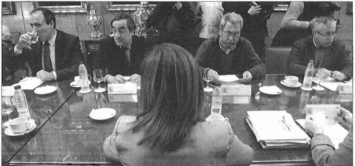
La ministra Fátima Báñez, de espaldas, en una de las últimas reuniones con los máximos dirigentes de las organizaciones empresariales y los sindicatos, en la sede del Ministerio de Empleo.