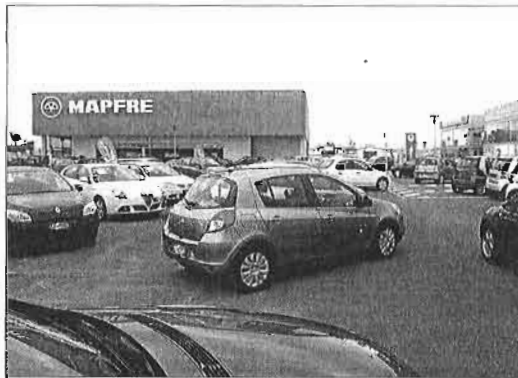
Vehículos en la zona de concesionarios del aeropuerto. ARCHIMEGA

«Se nota más confianza en el comprador, es un cambio de feeling . Podemos decir que empezamos a ver las cosas de otro color. Si antes hemos estado muy graves,