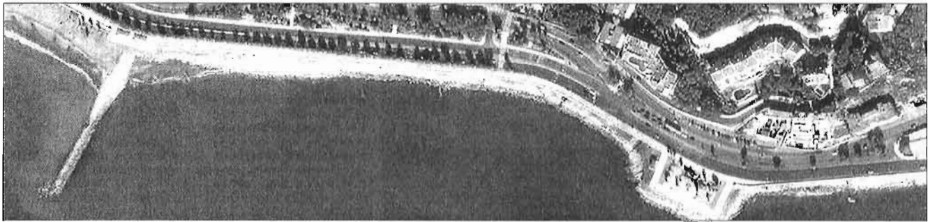
El futuro puerto de El Morlaco deberá ser un proyecto «económicamente viable» como insiste la Junta de Andalucía. LA OPINIÓN