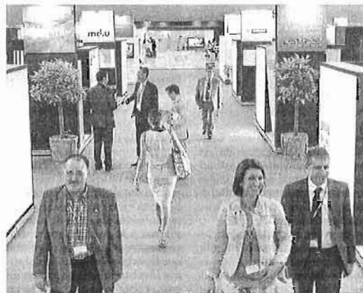
Imagen de los 'stands' de las empresas ubicados en la zona central de Fibes.

Paralelamente a estos discursos, los stands ubicados en los 8.000 metros cuadrados de la zona central de Fibes, donde se celebra la feria