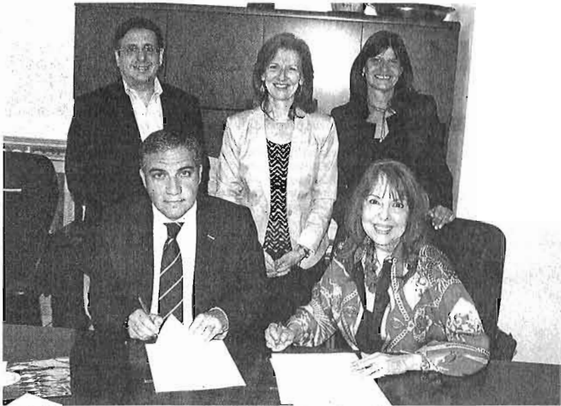
Bendodo renovó ayer, en la acción en Estados Unidos, el acuerdo con Virtuoso :: SUR