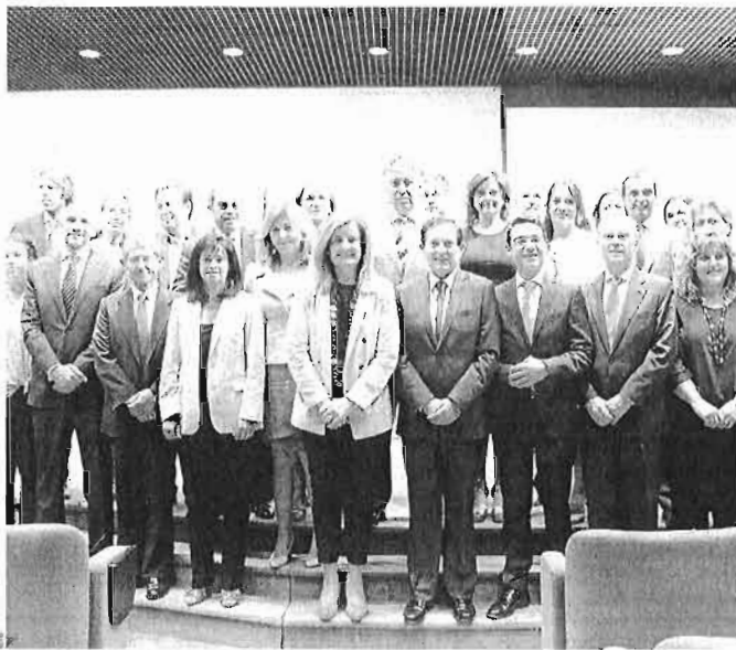
85.000 EMPLEOS EN LA RED El Gobierno presentó ayer el portal www.empleate.gob.es . Con la colaboración de las comunidades autónomas y de La Caixa, el proyecto reúne las ofertas de trabajo de los servicios públicos de empleo, y los portales y empresas privadas que quieran sumarse a la iniciativa. De momento, el portal cuenta con 23.000 ofertas, que reúnen 85.000 empleos vacantes. En la foto, la ministra de Empleo y de Seguridad Social, Fátima Báñez, ayer, con quienes han trabajado en el proyecto.

Las medidas que quiere poner en marcha el Gobierno para reducir el gasto en este tipo de incapacidad temporal tratan de agilizar los procesos de bajas y reducir el tiempo me-