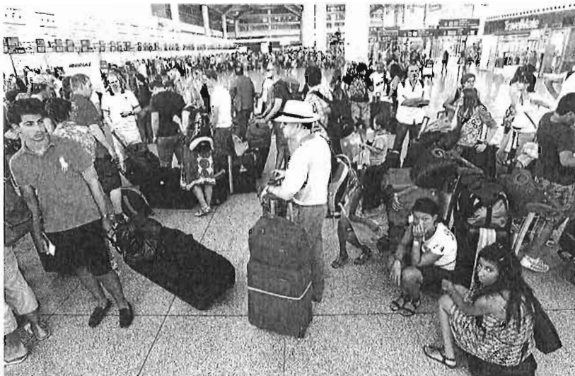
Turistas esperan en cola ante los mostradores de facturación del aeropuerto de Málaga.

Pero además, en el caso de Málaga también escalan posiciones las compañías tradicionales, que superan la primera mitad del año con un crecimiento del 4,6% hasta mover hacia este aeropuerto a 828.852 viajeros. Este dato revela el peso de la aerolínea de bajo coste en la Costa, que traen en el mismo periodo un