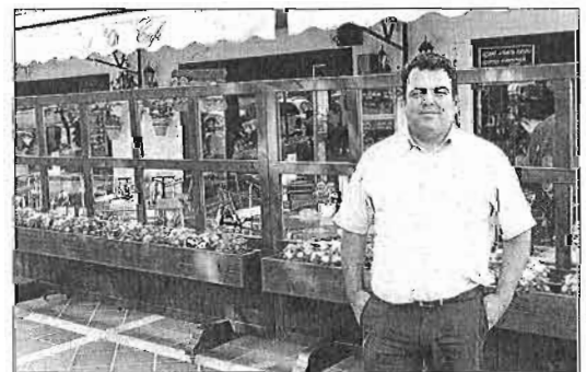
El concejal de Vía Pública de Mijas junto a uno de los cerramientos.

Estos cerramientos, realizados en madera y que incluyen jardi-