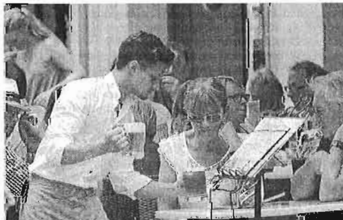
Un camarero sirve unas perxizas en un bar.