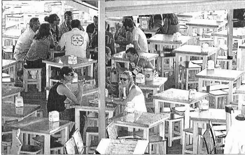
Detalle de los establecimientos hosteleros del Muelle 1. ÁLEX ZEA