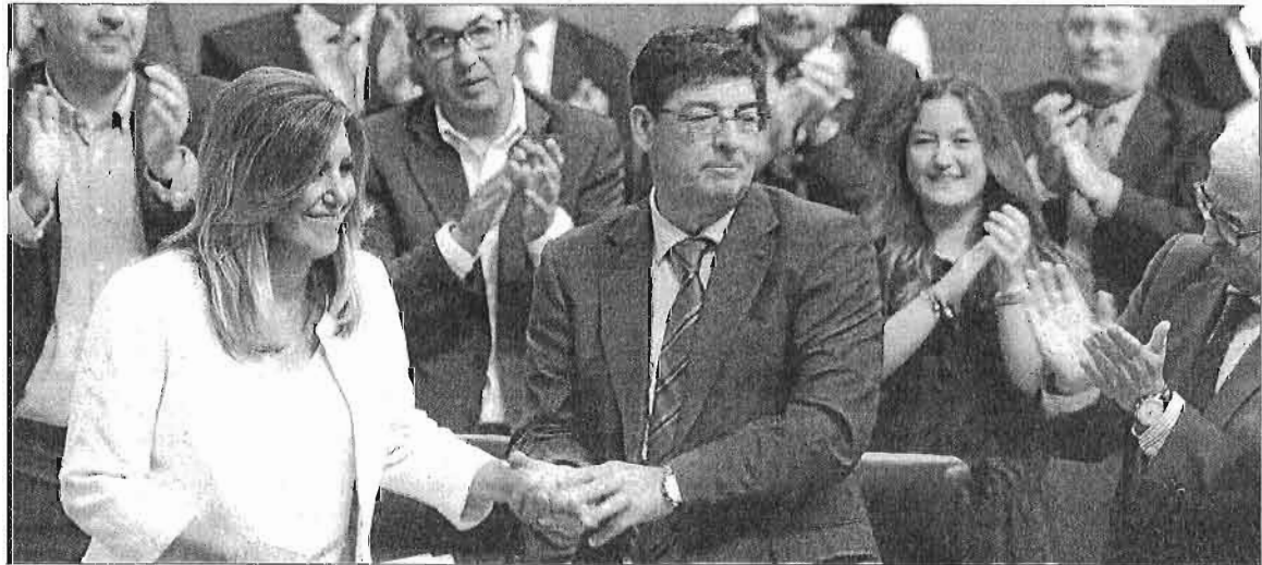
Susana Díaz estrecha la mano del vicepresidente de la Junta, Diego Valderas, al ser aplaudida tras su intervención en el debate.

Díaz garantizó que Andalucía contará con un «buen presupuesto» el próximo año, pese a que hay un contexto complicado, en el que se va a combinar la capacidad de crear empleo con el mantenimiento y blindaje del estado del bienestar. «Vamos a aprobar el presupuesto y vamos a dejarnos la piel para luchar contra todos los elementos», sentenció la presidenta. E.P. SEVILLA