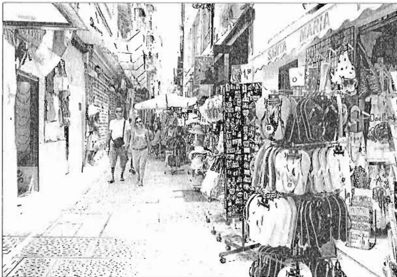
Tiendas del Centro Histórico de la capital. CARLOS CRIADO

Asimismo, la plataforma virtual está dirigida a todo tipo de soportes, tanto ordenadores como móviles o tabletas digitales, de tal for-